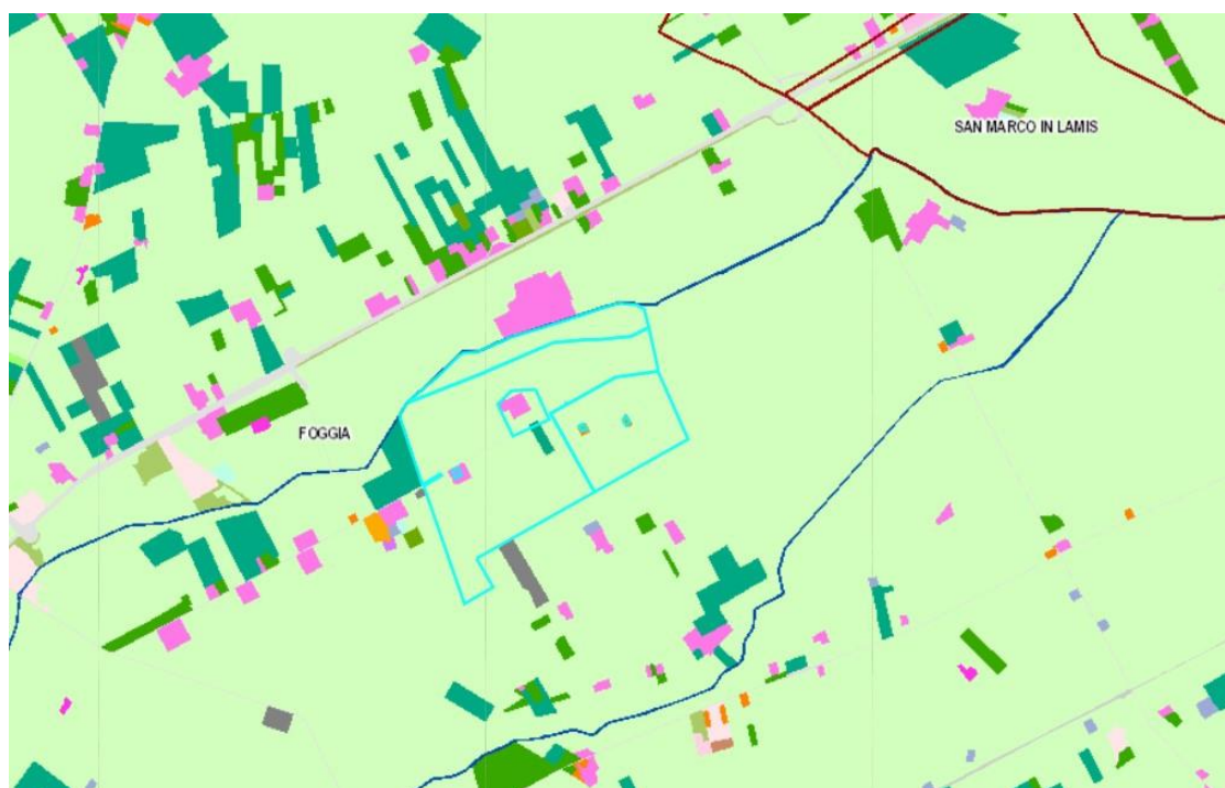
Figura 3.1 Uso del suolo

Le aree in cui ricade l'impianto fotovoltaico sono classificate come "Seminativo semplice in aree irrigue".