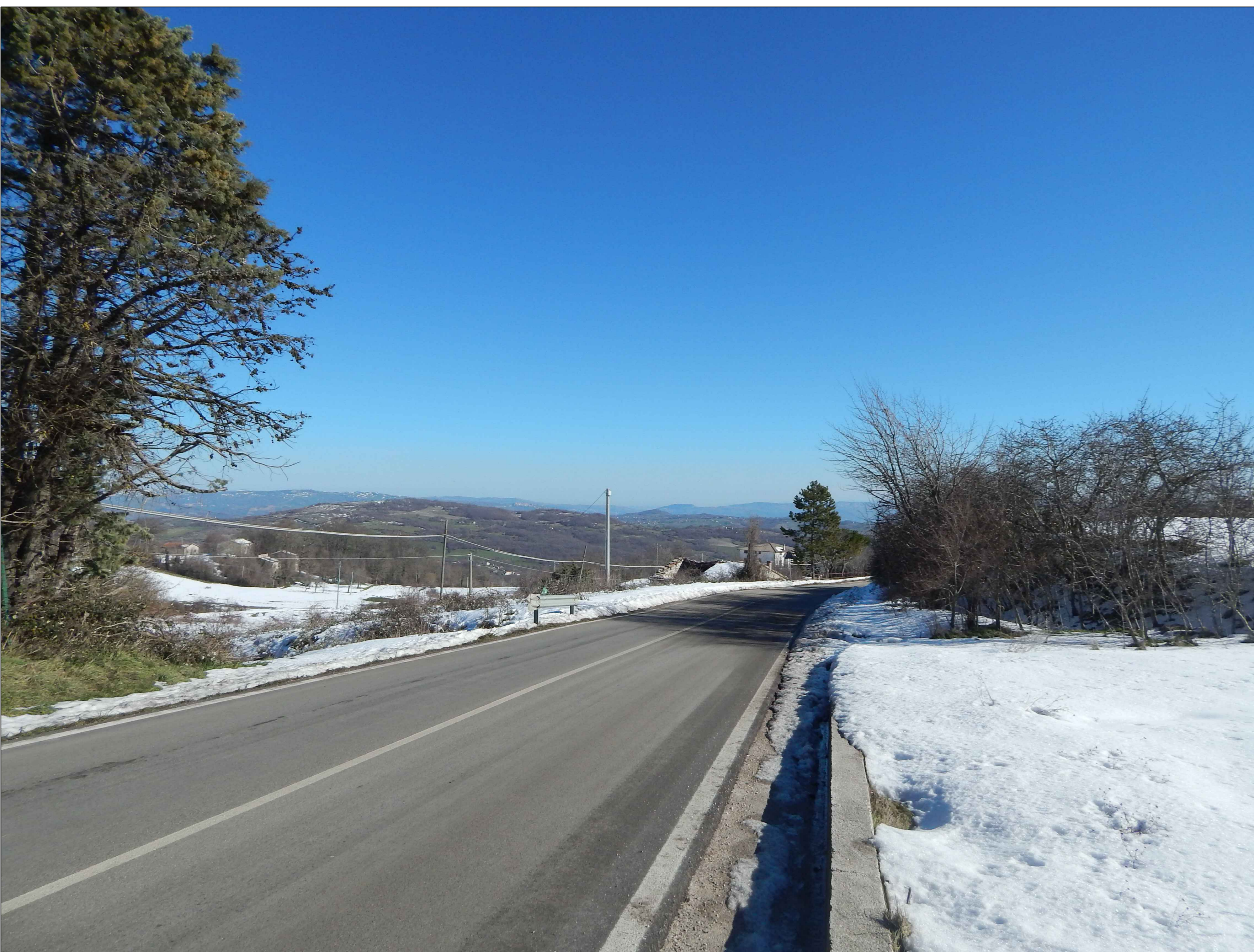
STATO DI FATTO (Recettore 2)