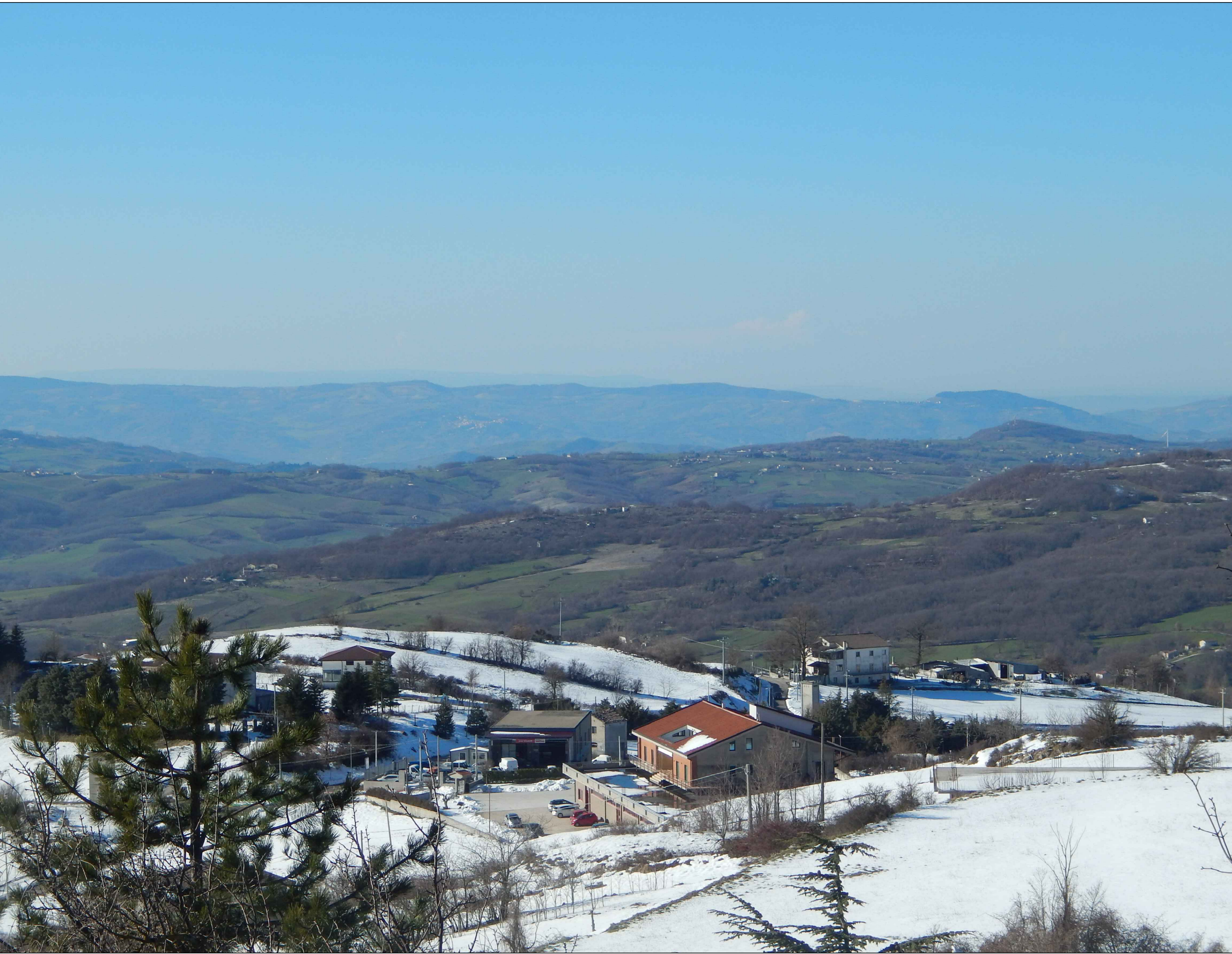
STATO DI FATTO (Recettore 1)