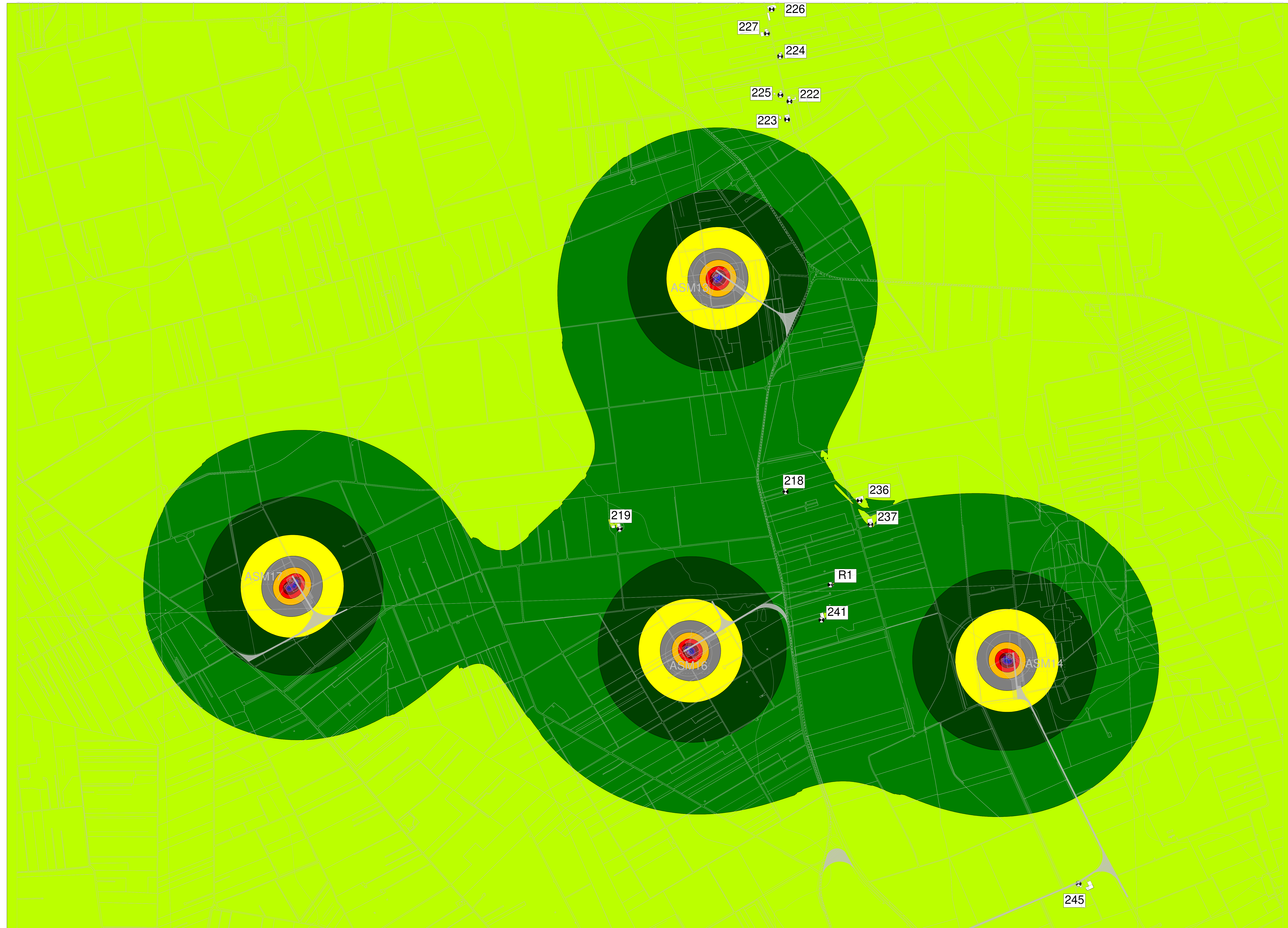
MAPPA A COLORI CON ISOFONICHE - LIVELLI DI EMISSIONE CANTIERE