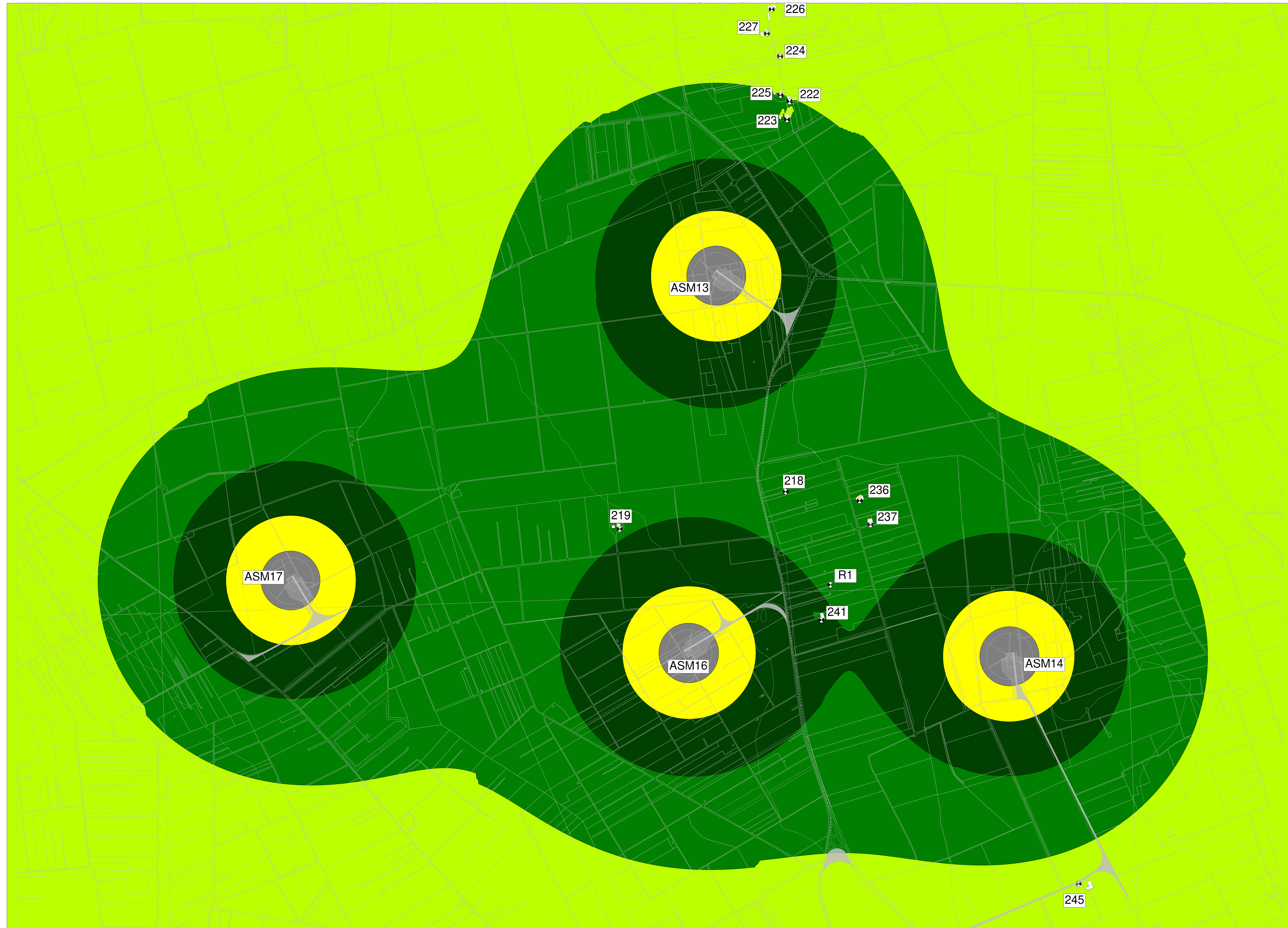
MAPPA A COLORI CON ISOFONICHE - LIVELLI DI EMISSIONE DIURNI E NOTTURNI