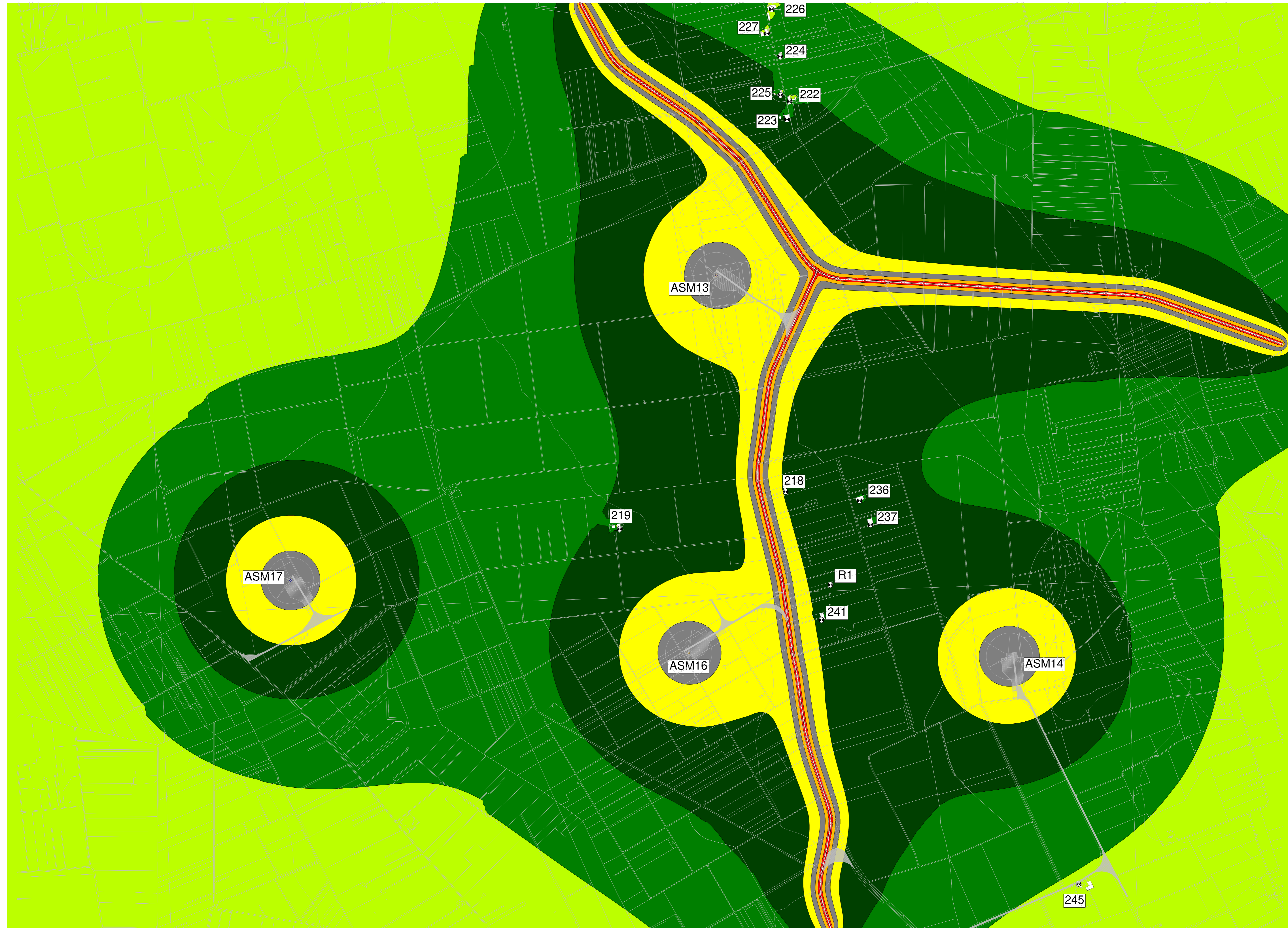
MAPPA A COLORI CON ISOFONICHE - LIVELLI DI IMMISSIONE DIURNI