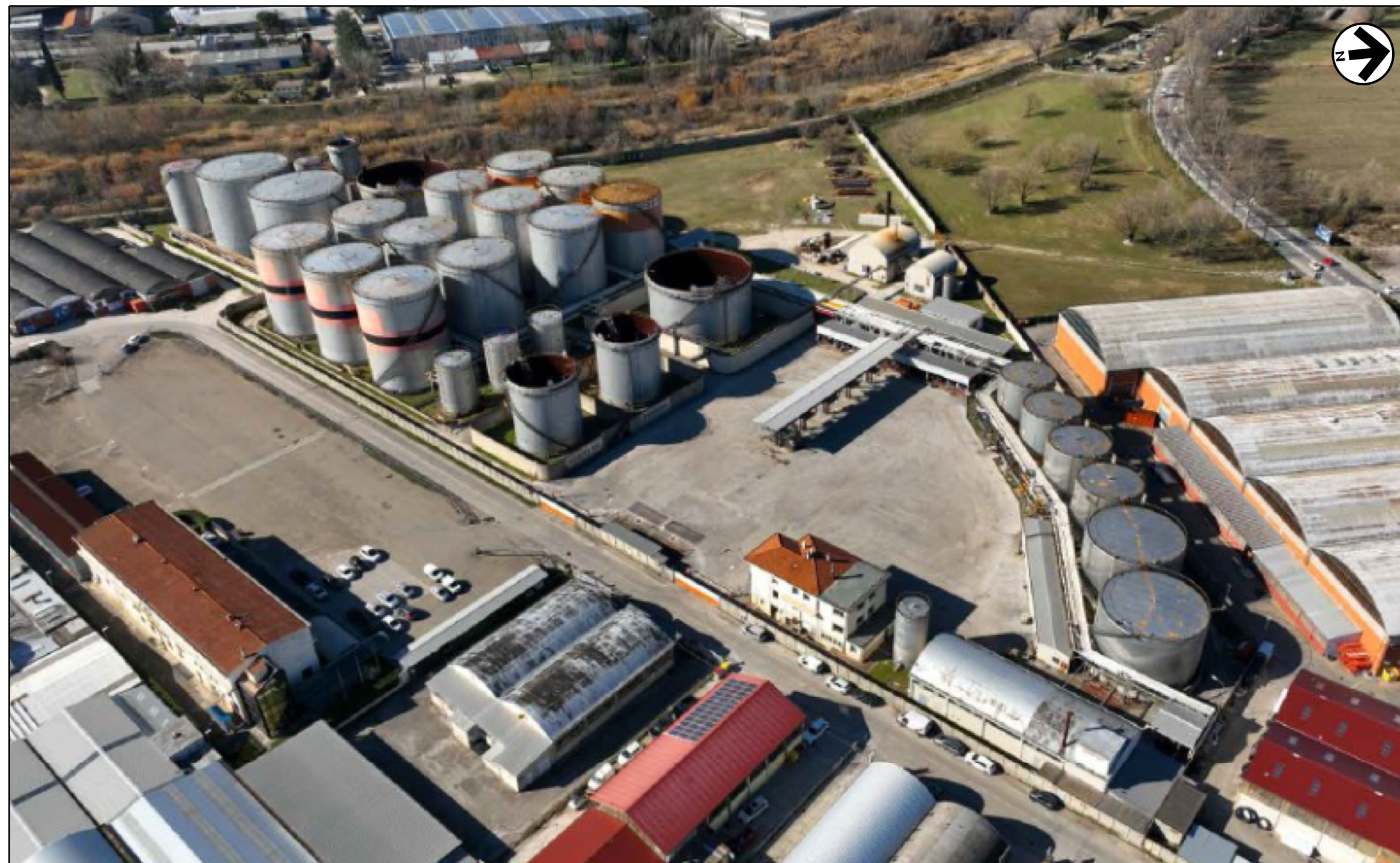
VISTA 3: STATO DI FATTO