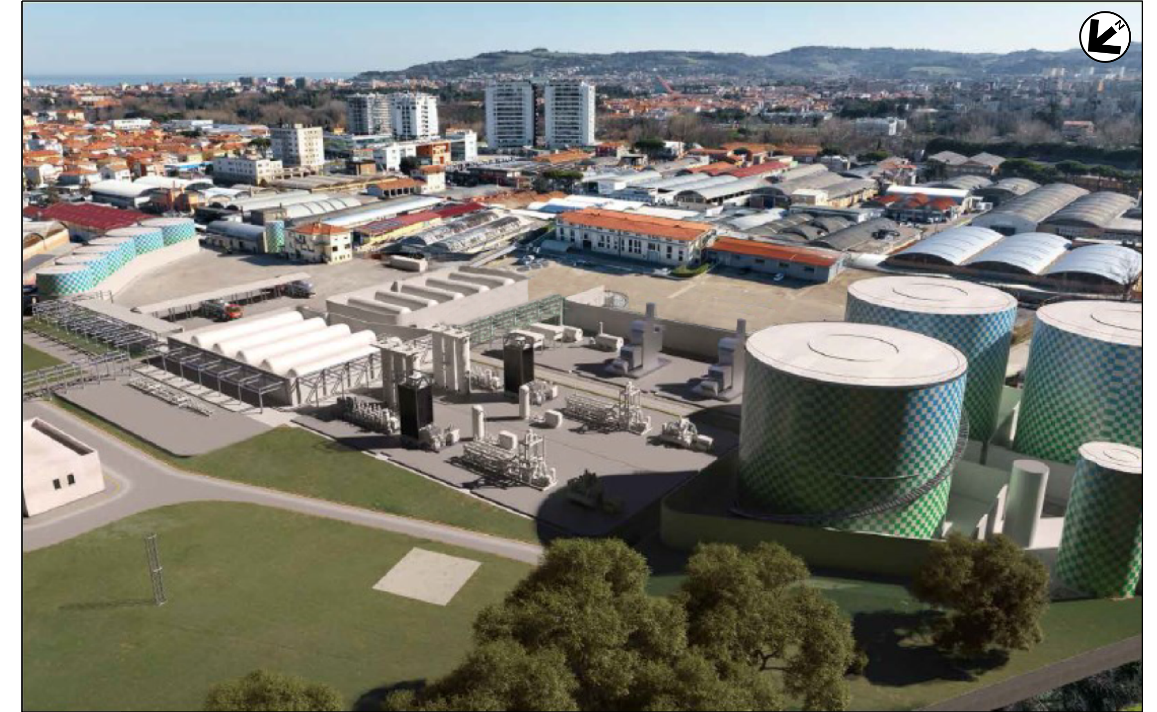
VISTA 2: STATO DI PROGETTO