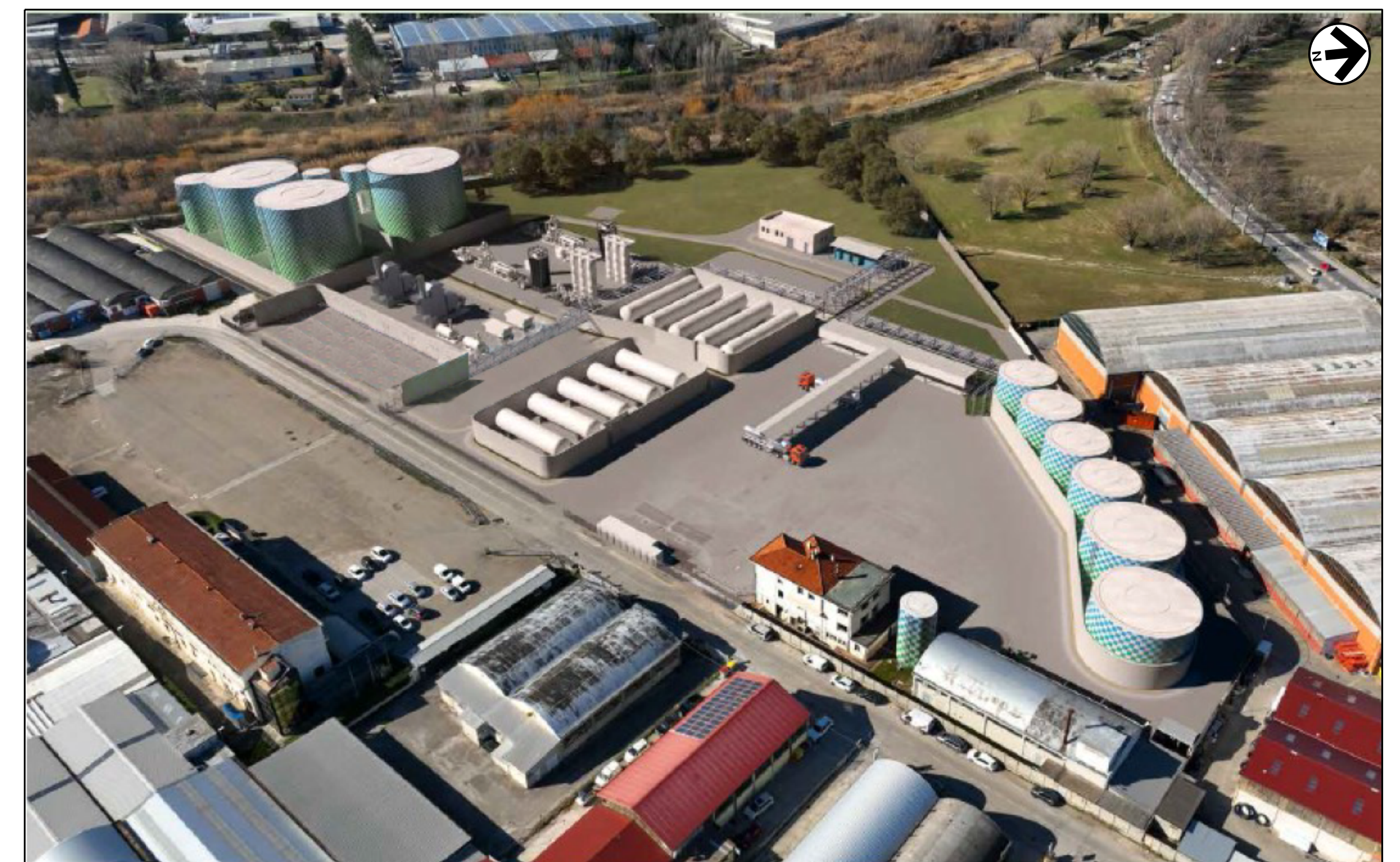
VISTA 4: STATO DI PROGETTO