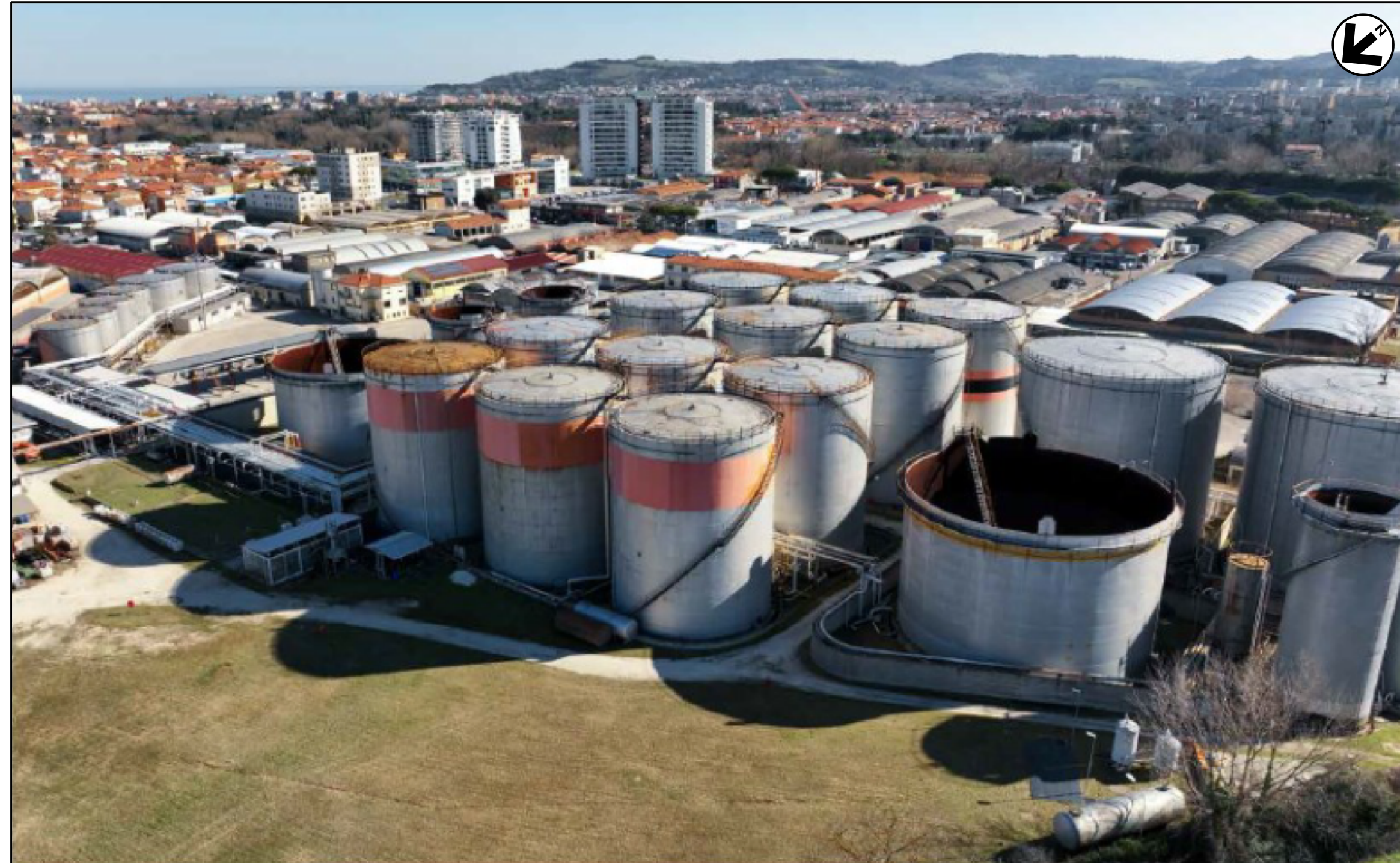
VISTA 1: STATO DI FATTO