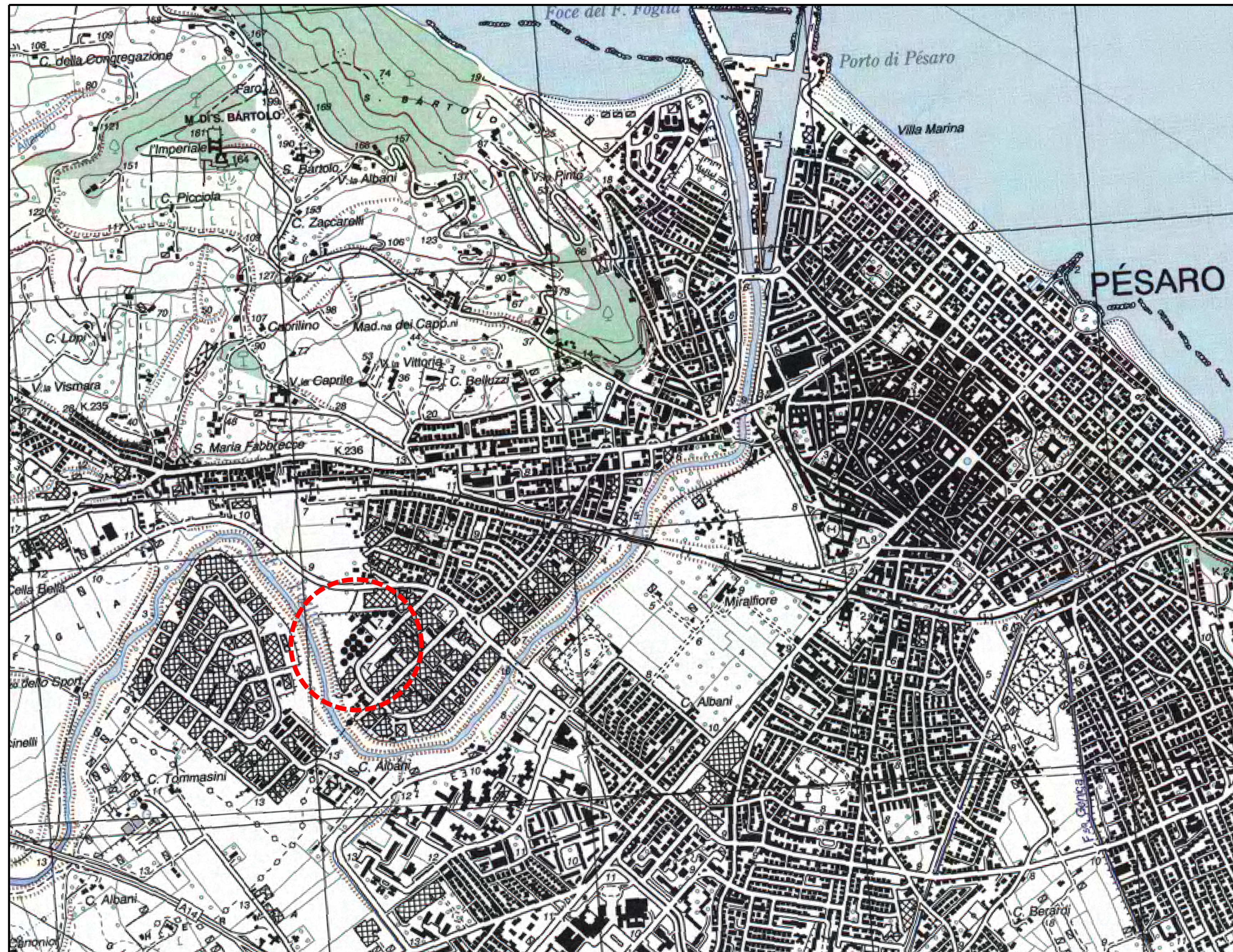
COROGRAFIA Scala 10.000