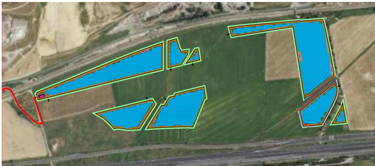
Figura 4: Layout preliminare – Impianto denominato EG STELLA – Lotto 1

Di seguito si riporta una rappresentazione di layout preliminare di impianto.