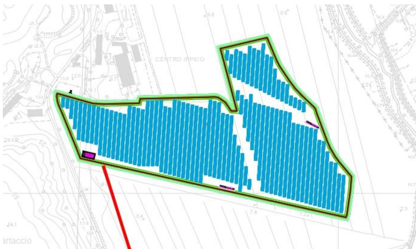
Figura 3: CTR – Impianto denominato EG STELLA – particolare Lotto 2