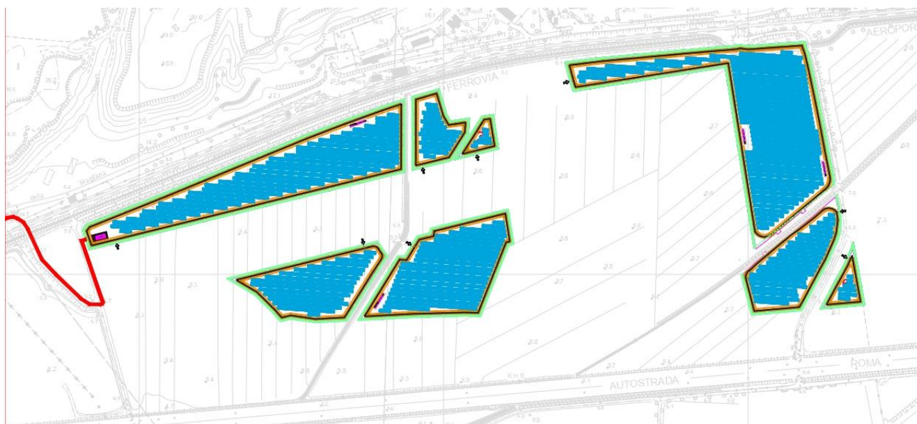
Figura 2: CTR – Impianto denominato EG STELLA – particolare Lotto 1