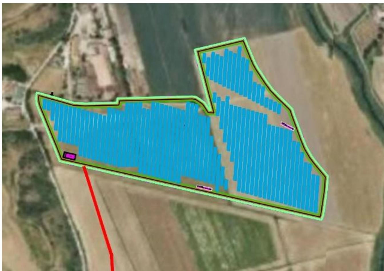
Figura 5: Layout preliminare – Impianto denominato EG STELLA – Lotto 2