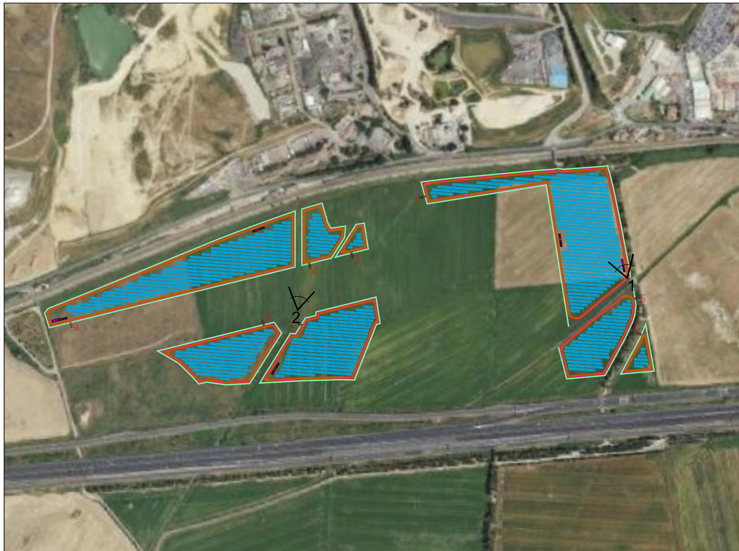
Vista n.1_ante operam