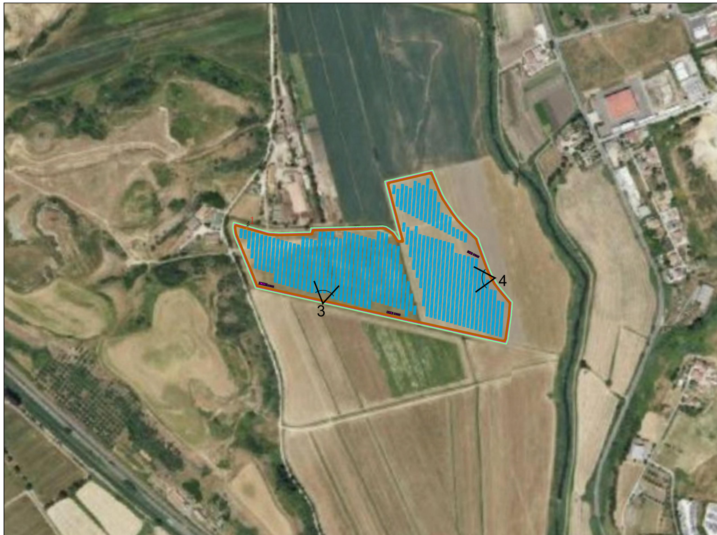
Vista n.3_ ante operam