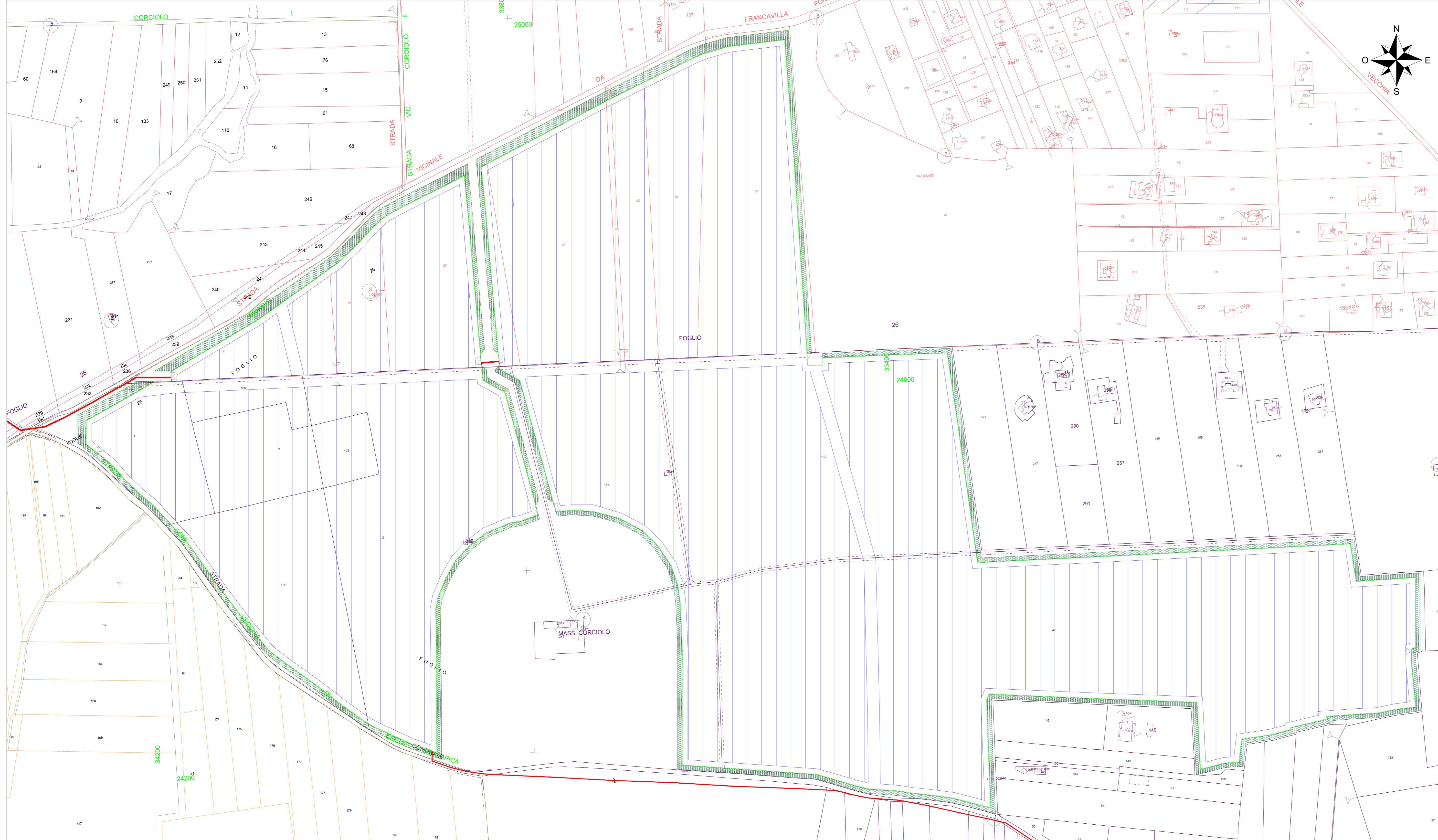
Vista E - Scala 1:2000