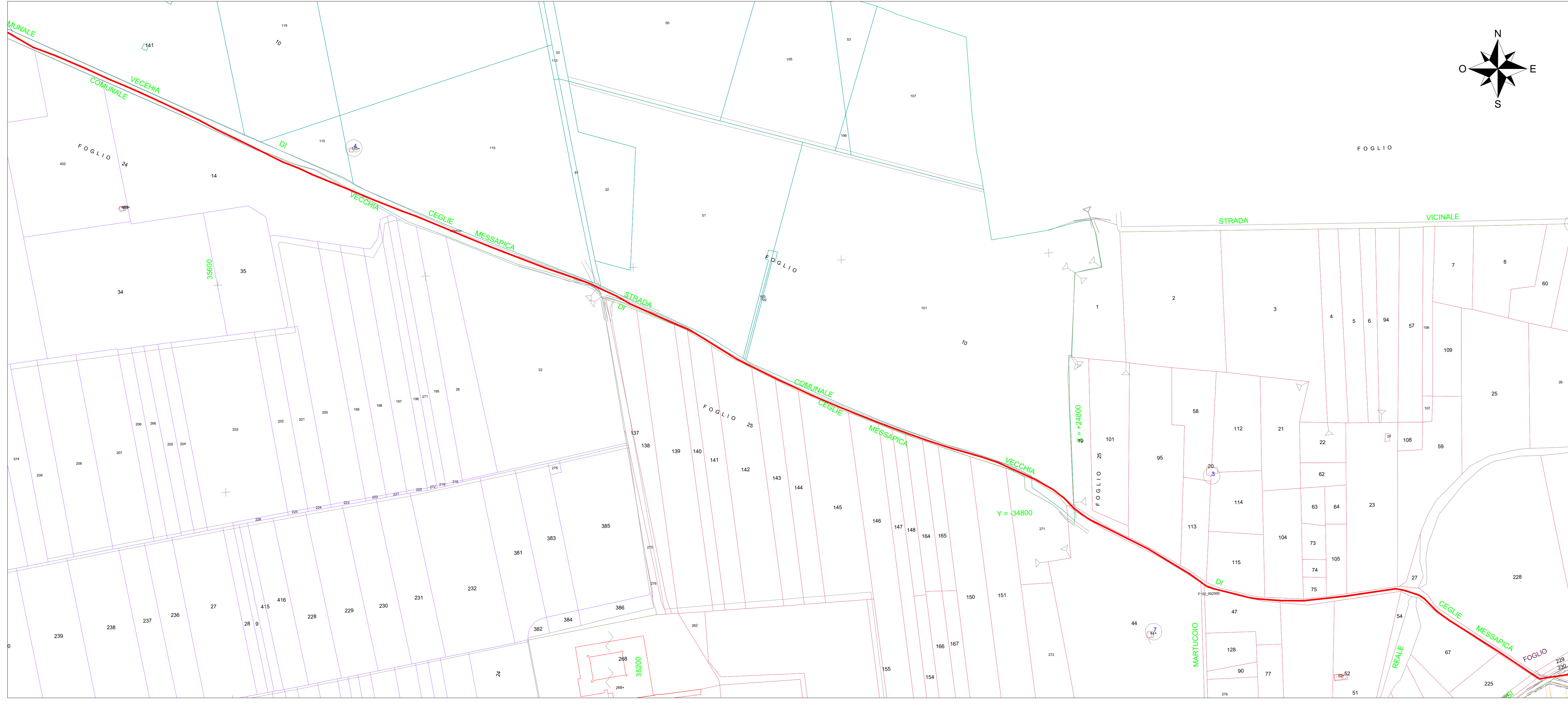
Vista F - Scala 1:2000