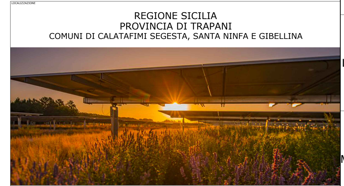
REGIONE SICILIA PROVINCIA DI TRAPANI COMUNI DI CALATAFIMI SEGESTA, SANTA NINFA E GIBELLINA AGRIVOLTAICO "GIBELLINA"