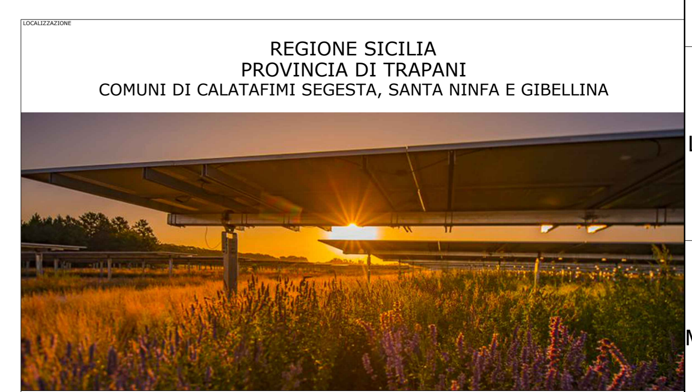
REGIONE SICILIA PROVINCIA DI TRAPANI COMUNI DI CALATAFIMI SEGESTA, SANTA NINFA E GIBELLINA AGRIVOLTAICO "GIBELLINA"