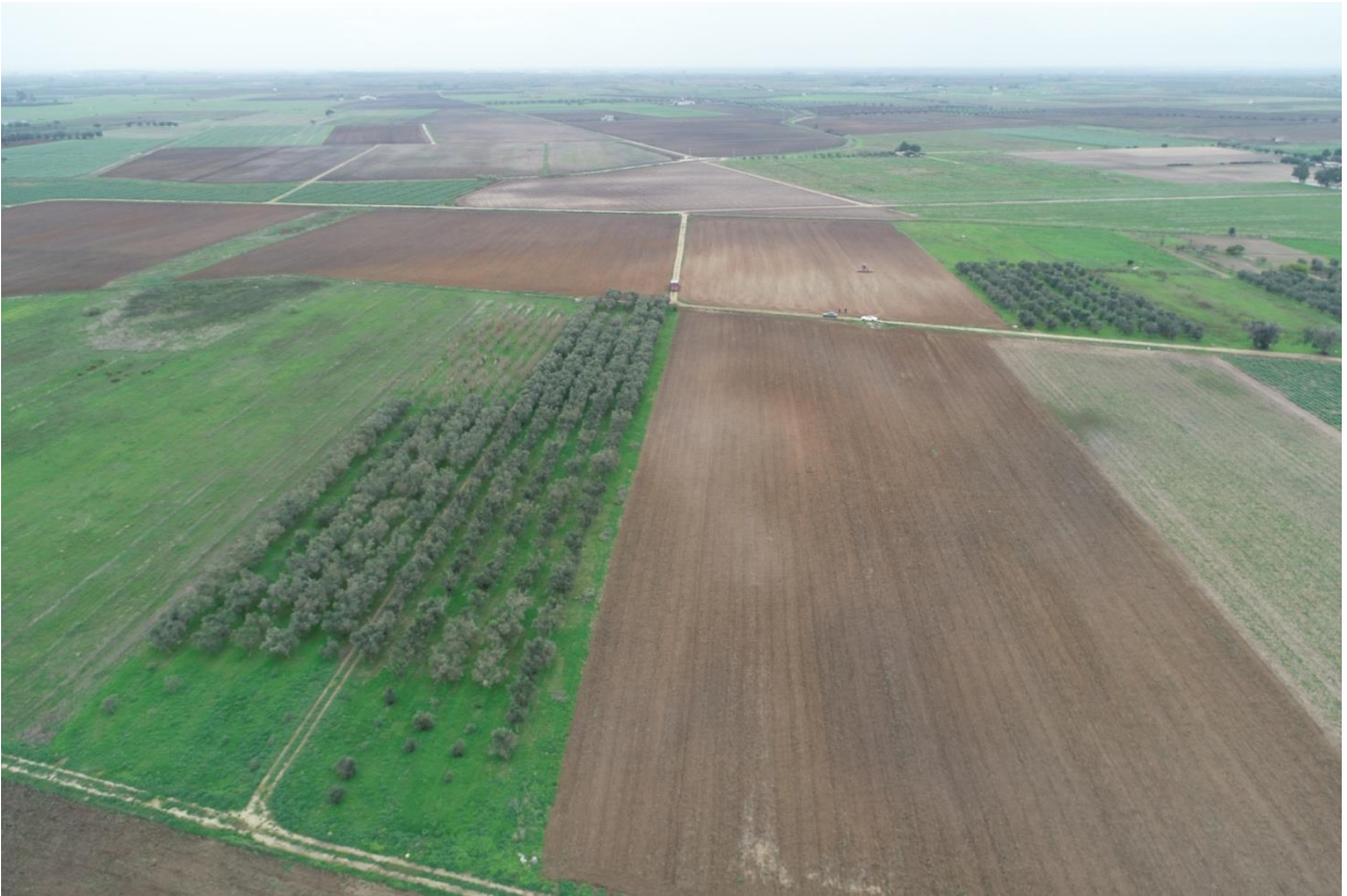
Punto di Presa 13

Coordinate: 40° 31' 37,896" N - 17° 53' 57,294" E