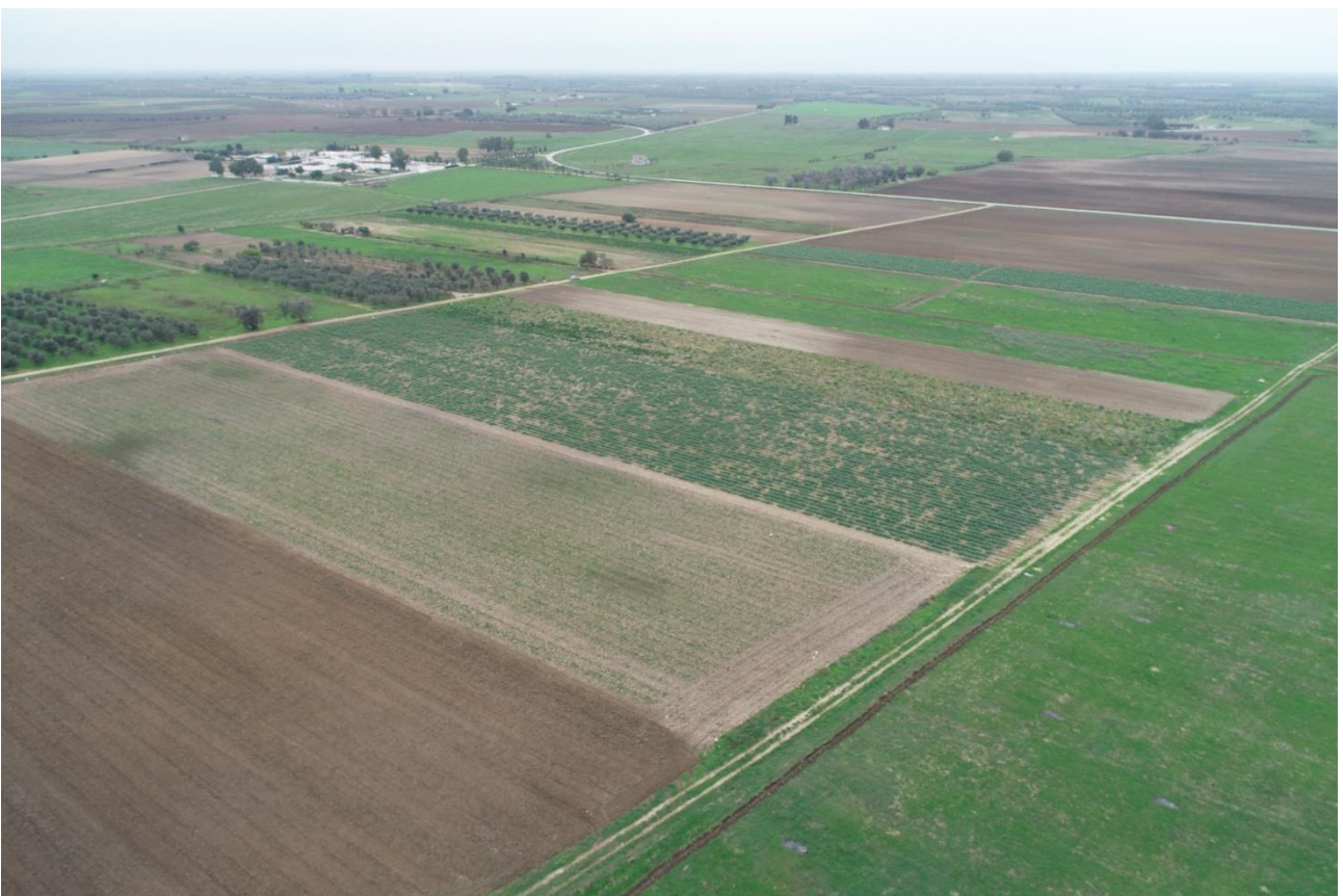
Punto di Presa 14

Coordinate: 40° 31' 37,896" N - 17° 53' 57,294" E