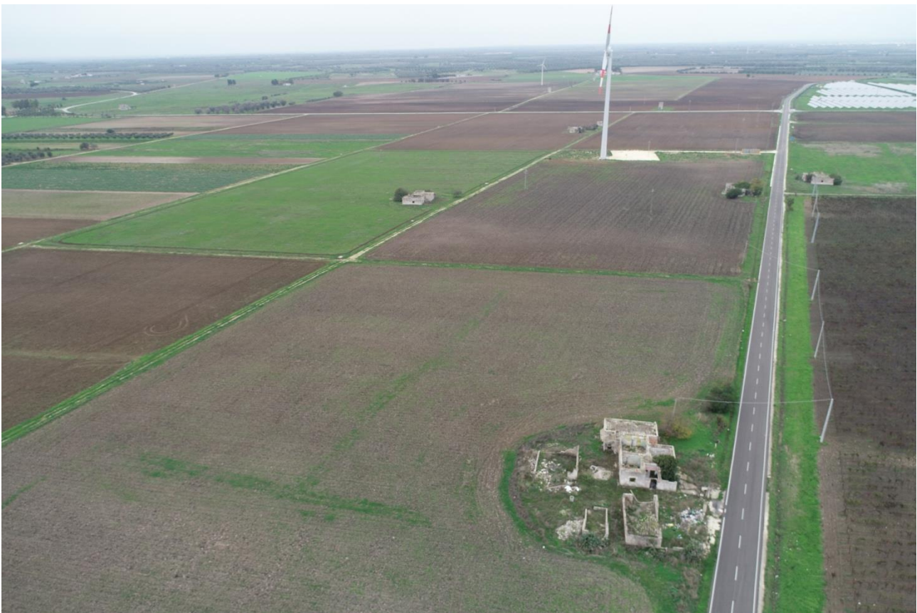
Punto di Presa 12

Coordinate: 40° 31' 43,992" N - 17° 54' 4,764" E