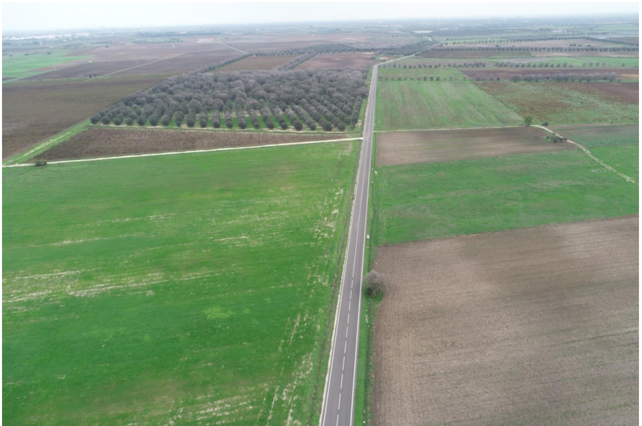
Punto di Presa 10

Coordinate: 40° 31' 44,004" N - 17° 54' 4,8" E