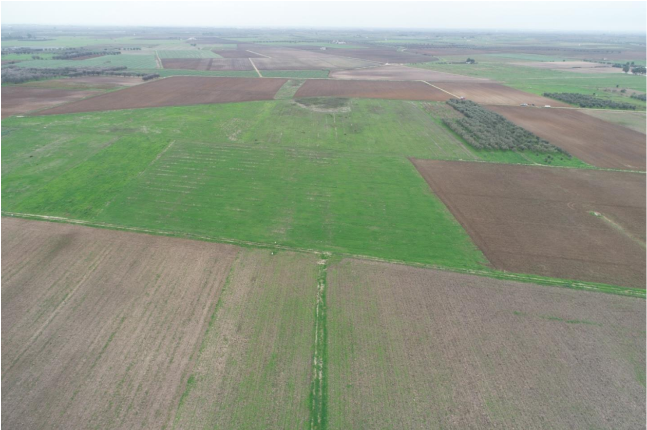
Punto di Presa 11

Coordinate: 40° 31' 43,992" N - 17° 54' 4,764" E