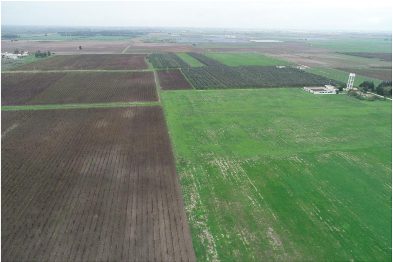
Punto di Presa 9

Coordinate: 40° 31' 44,004" N - 17° 54' 4,8" E