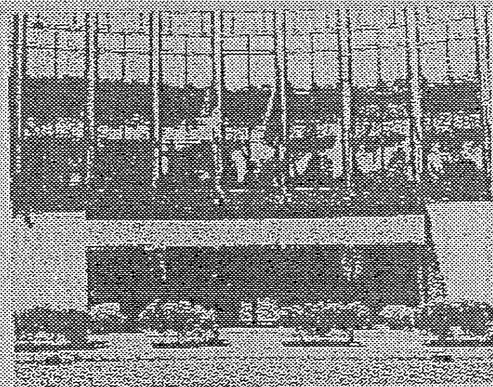
La sede di Finmeccanica

azio- tore o con ieria le so- ganiz- che lo- zione r il 12 l'ulti- la co- apri- presi-