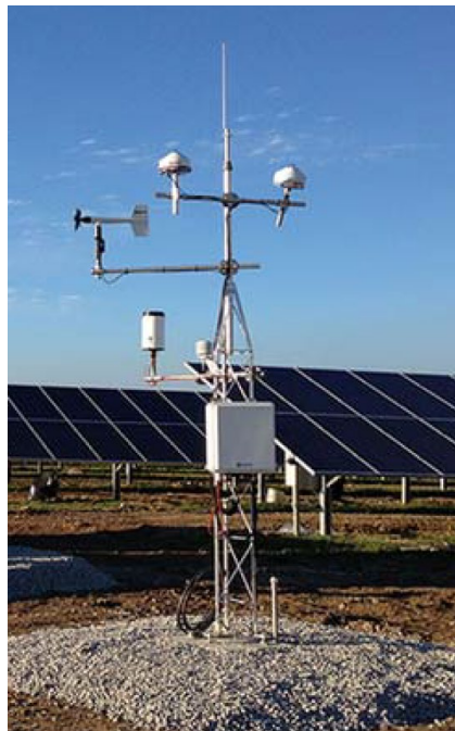
Figura 2: esempio di installazione meteorologica in campo fotovoltaico