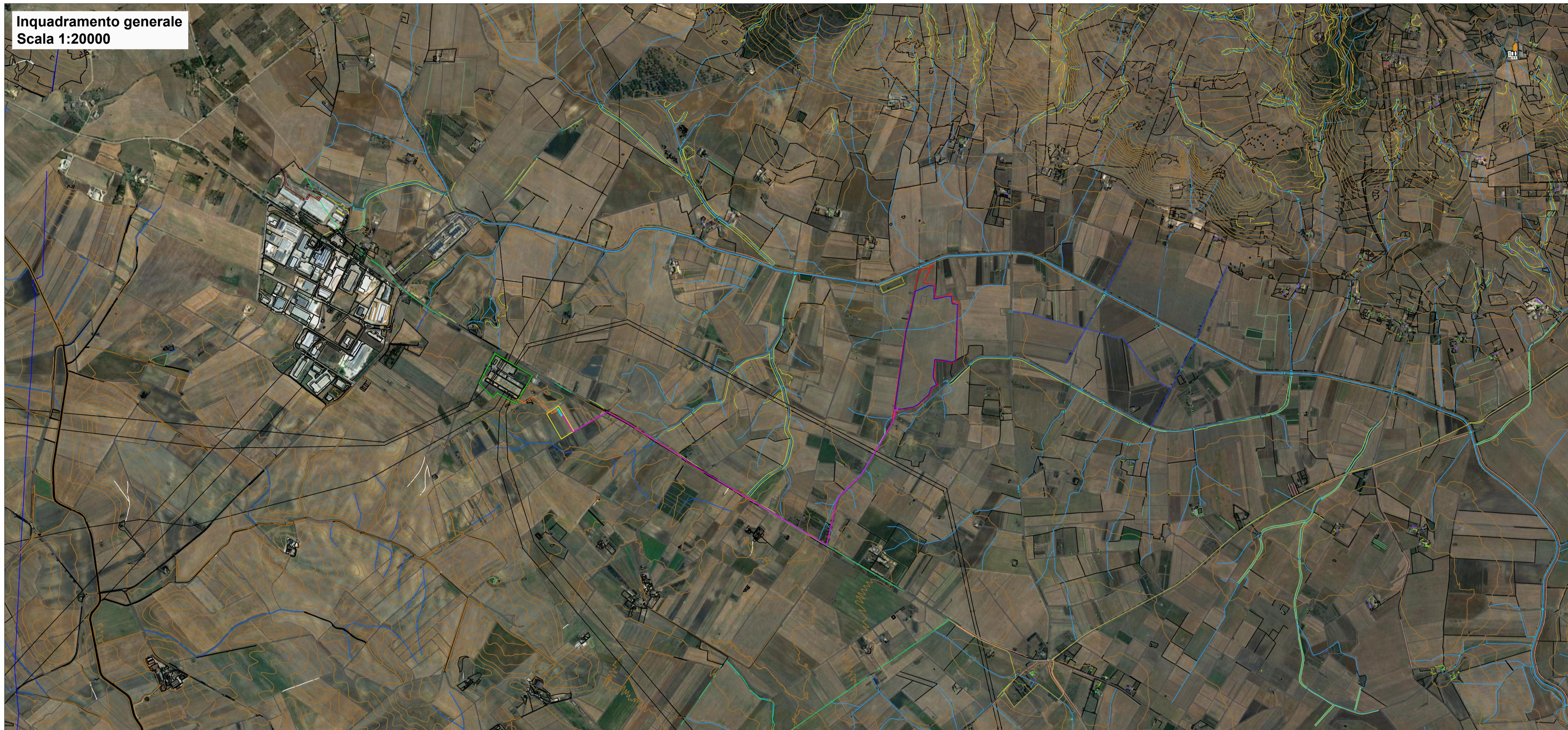
Inquadramento generale Scala 1:20000