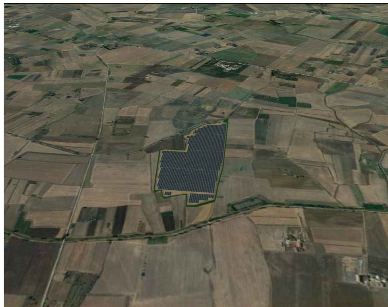
VISTA LATO NORD POST OPERAM