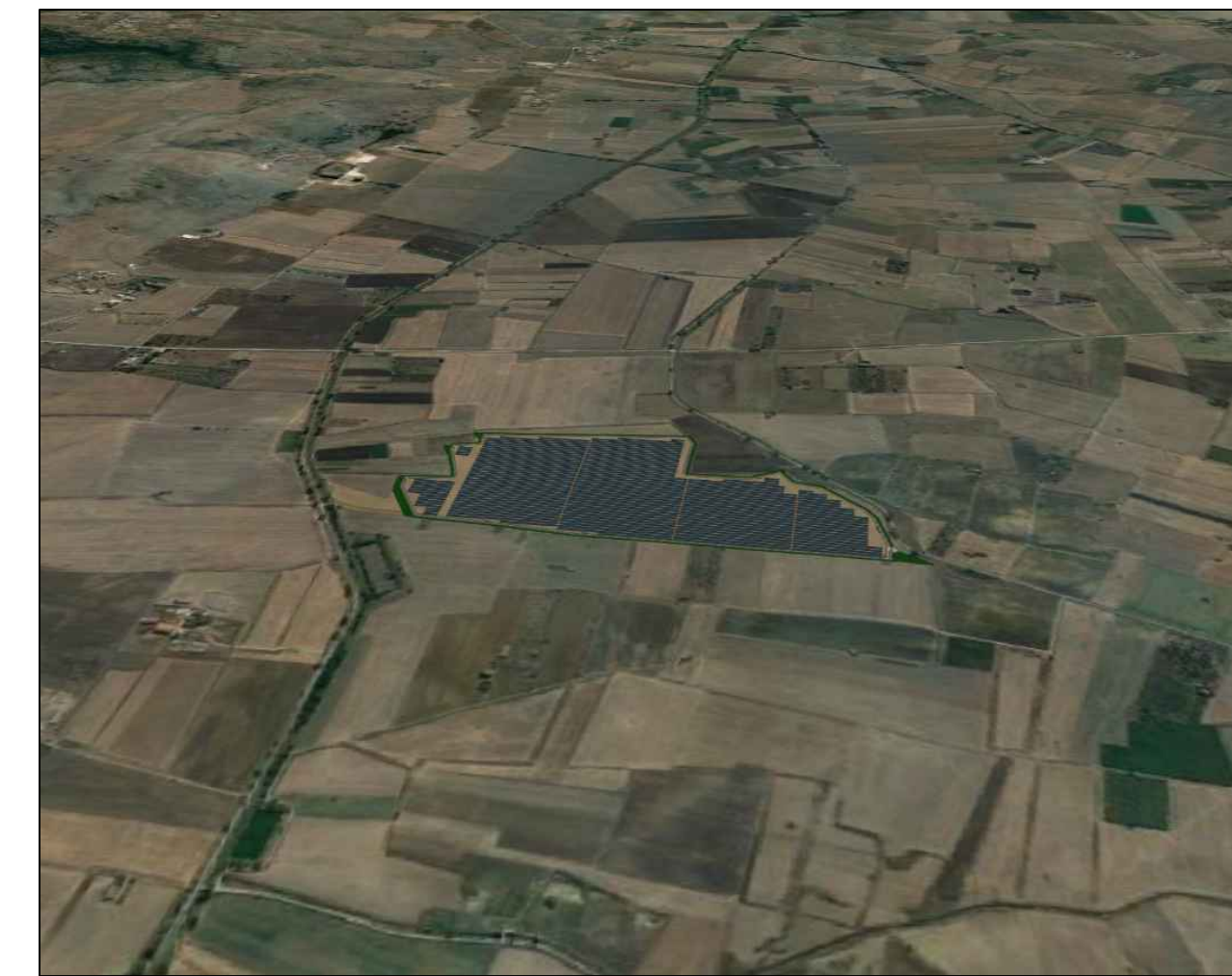
VISTA LATO OVEST POST OPERAM