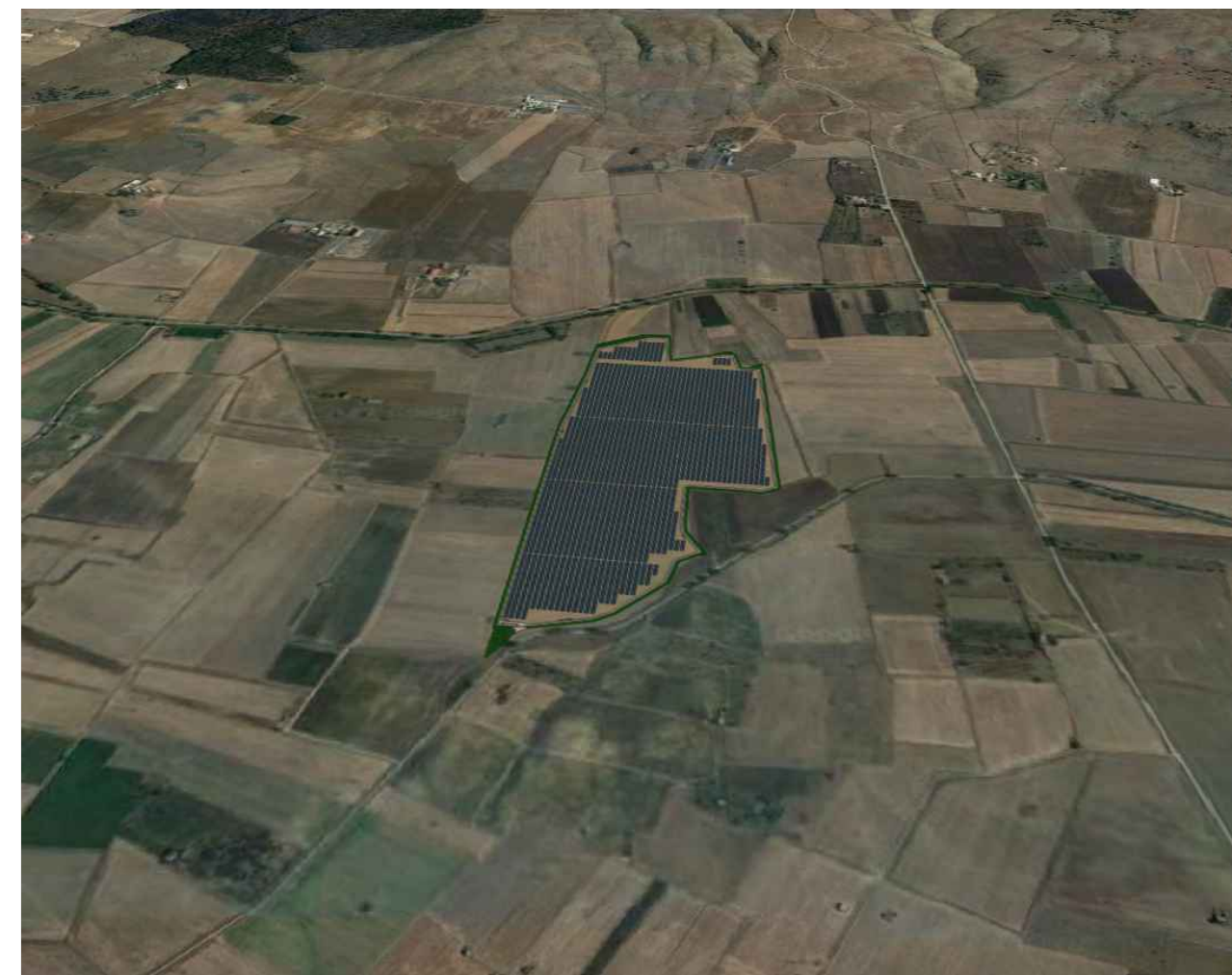
VISTA LATO SUD POST OPERAM