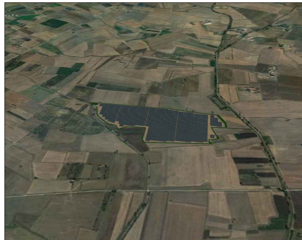
VISTA LATO EST POST OPERAM