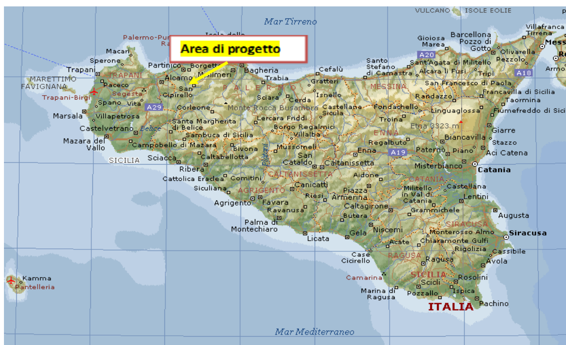
Figura 4-1 – Inquadramento regionale

L'area interessata dal progetto è facilmente raggiungibili grazie ad una fitta rete di strade di vario ordine presenti in zona.