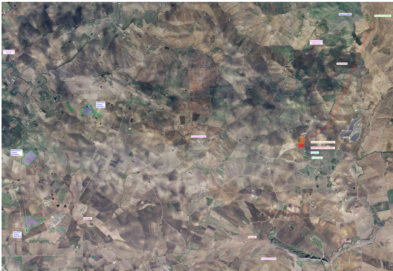
Figura 4-2 – Area impianto su ortofoto

L'altimetria media risulta essere circa 390 m s.l.m..