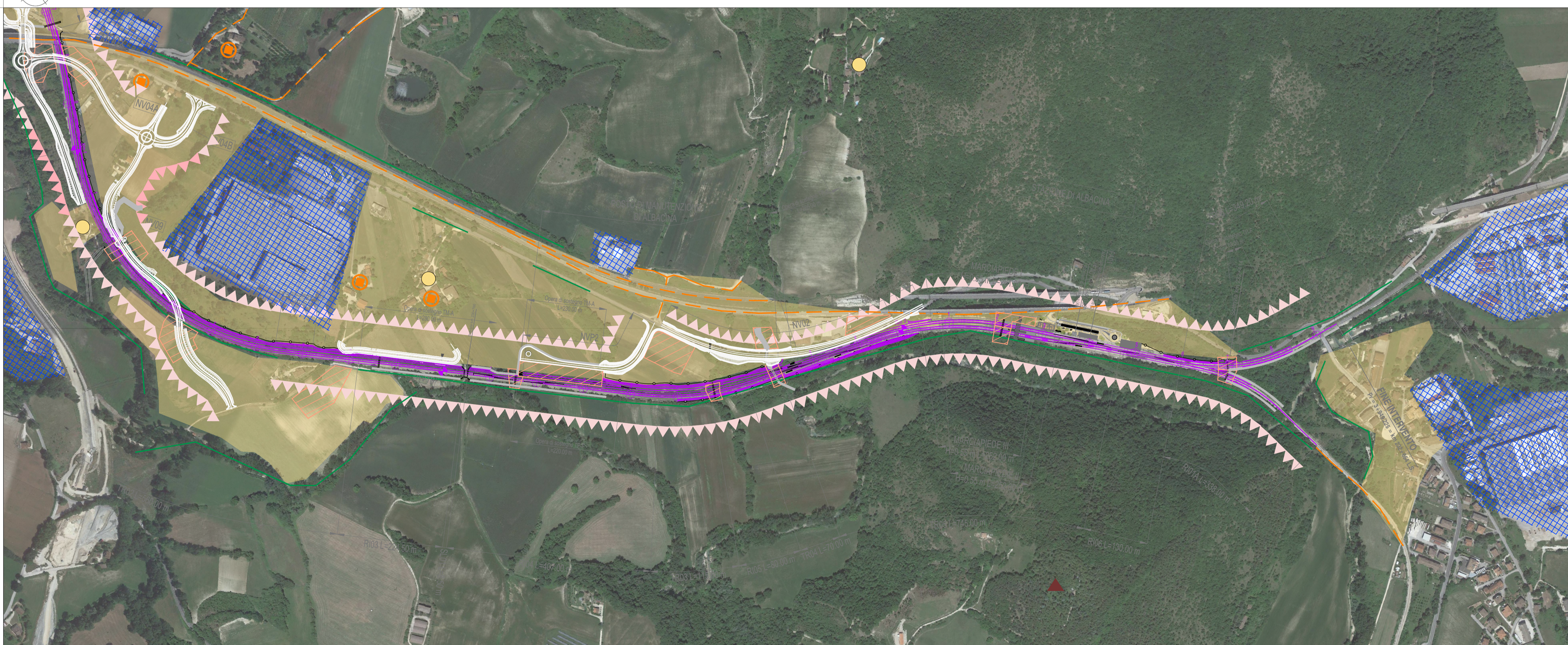
TRATTO B - CARTA DELLA VISUALITA'