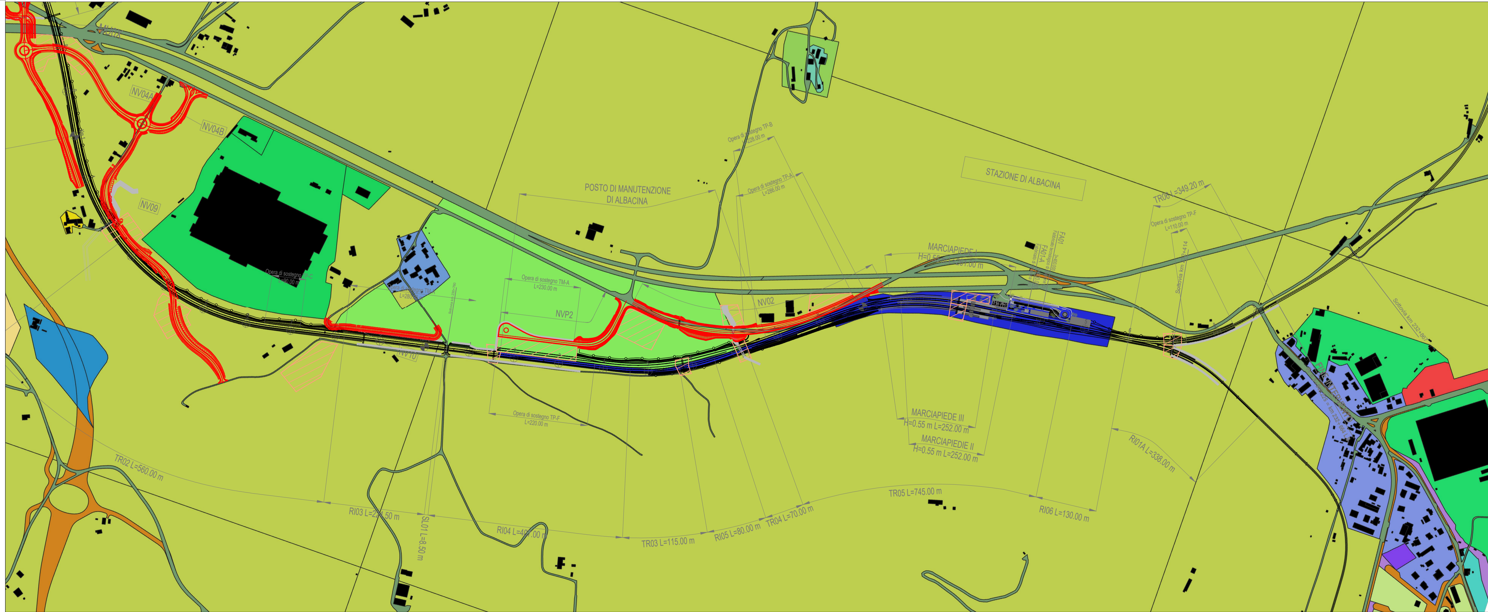
TRATTO B - PLANIMETRIA DELL'USO PROGRAMMATO DEL SUOLO