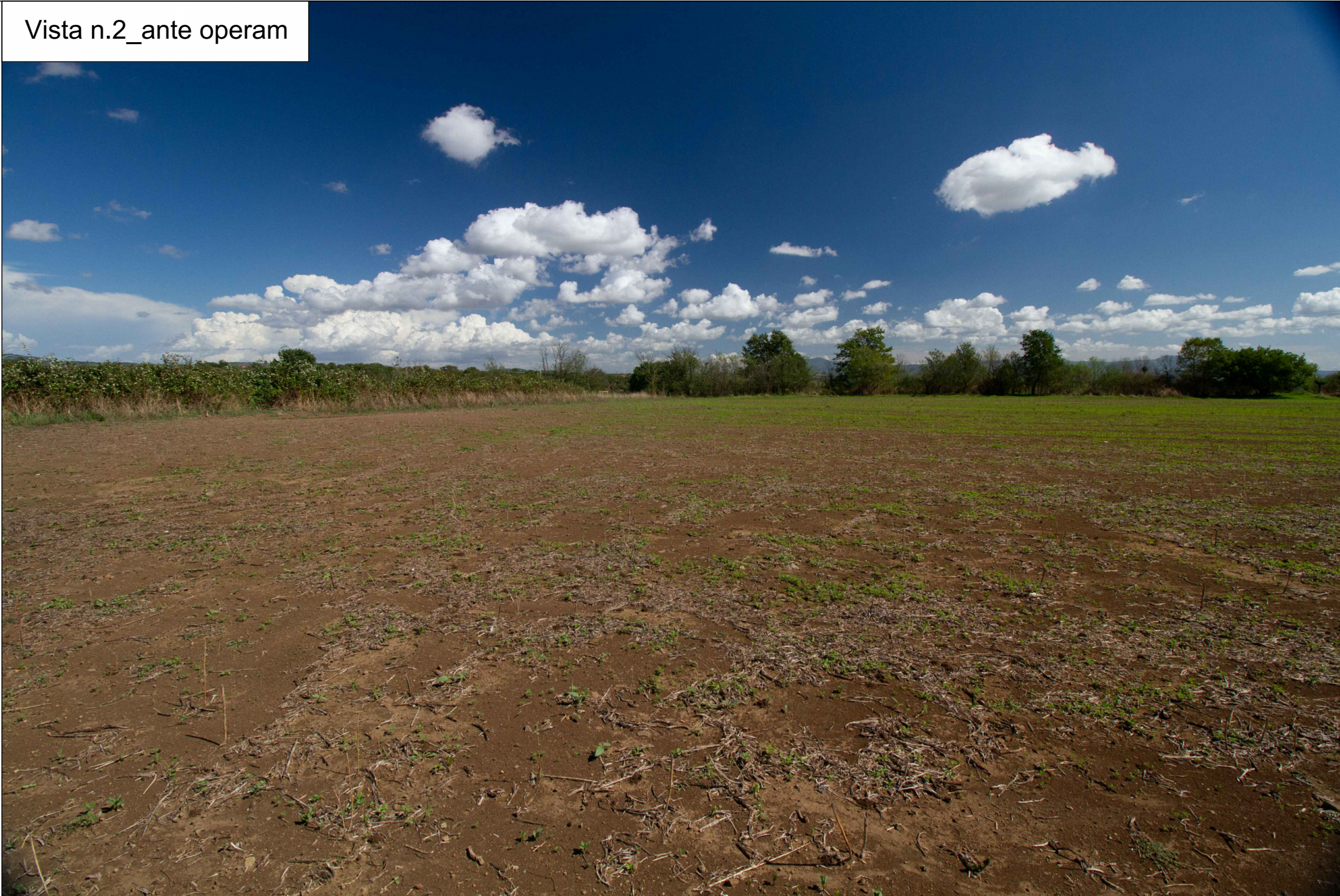
Vista n.2_ante operam