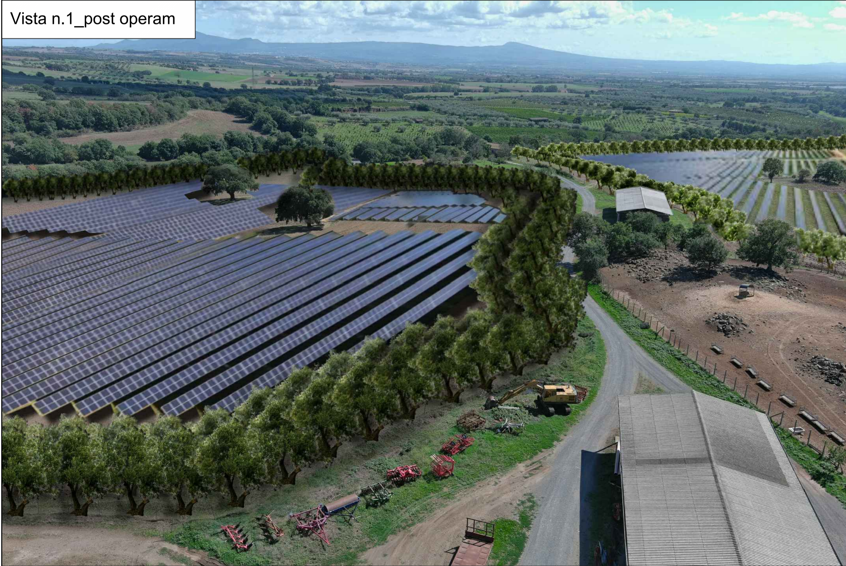
Vista n.1_post operam