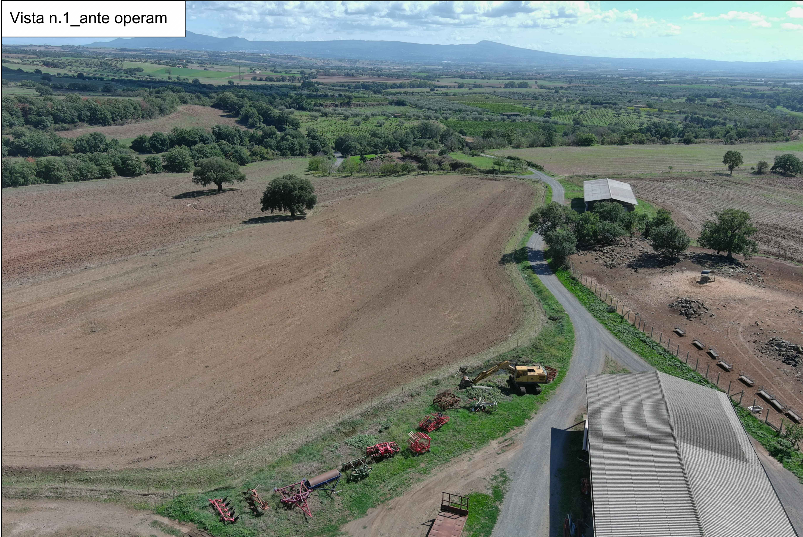
Vista n.1_ante operam