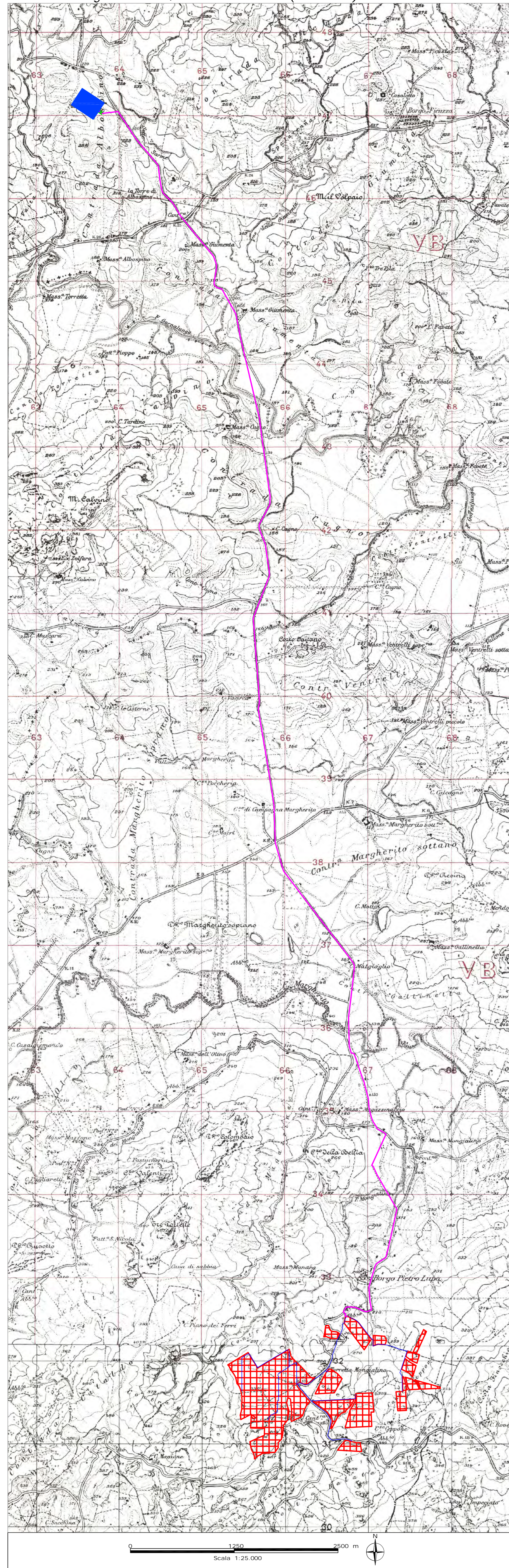
Tav.1: Corografia – Quadro d'unione (1:25000)