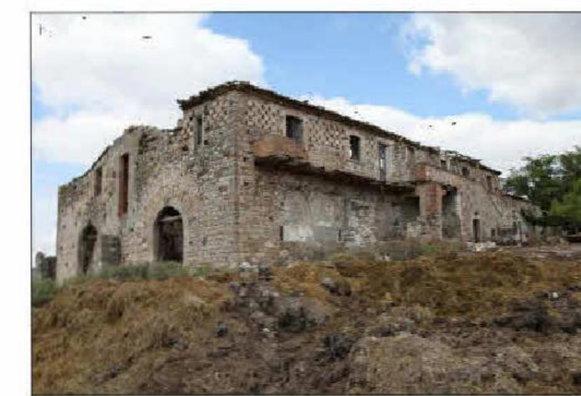
MASSERIA LA SPRINIA