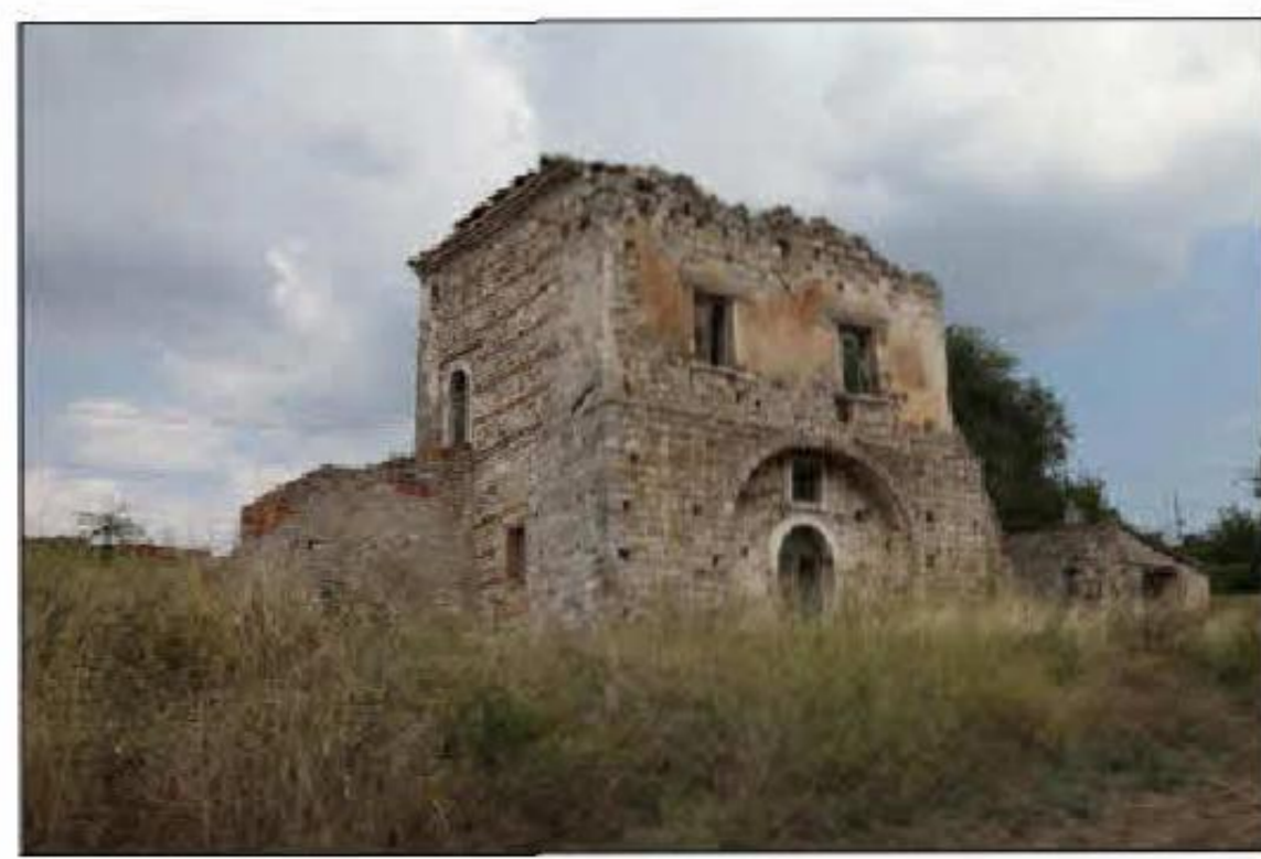
MASSERIA S. ELEUTERIO