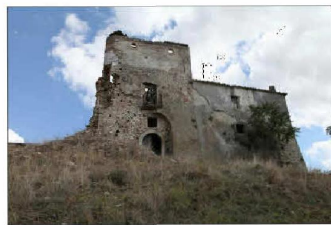
MASSERIA CHIUPPO DE BRUNO