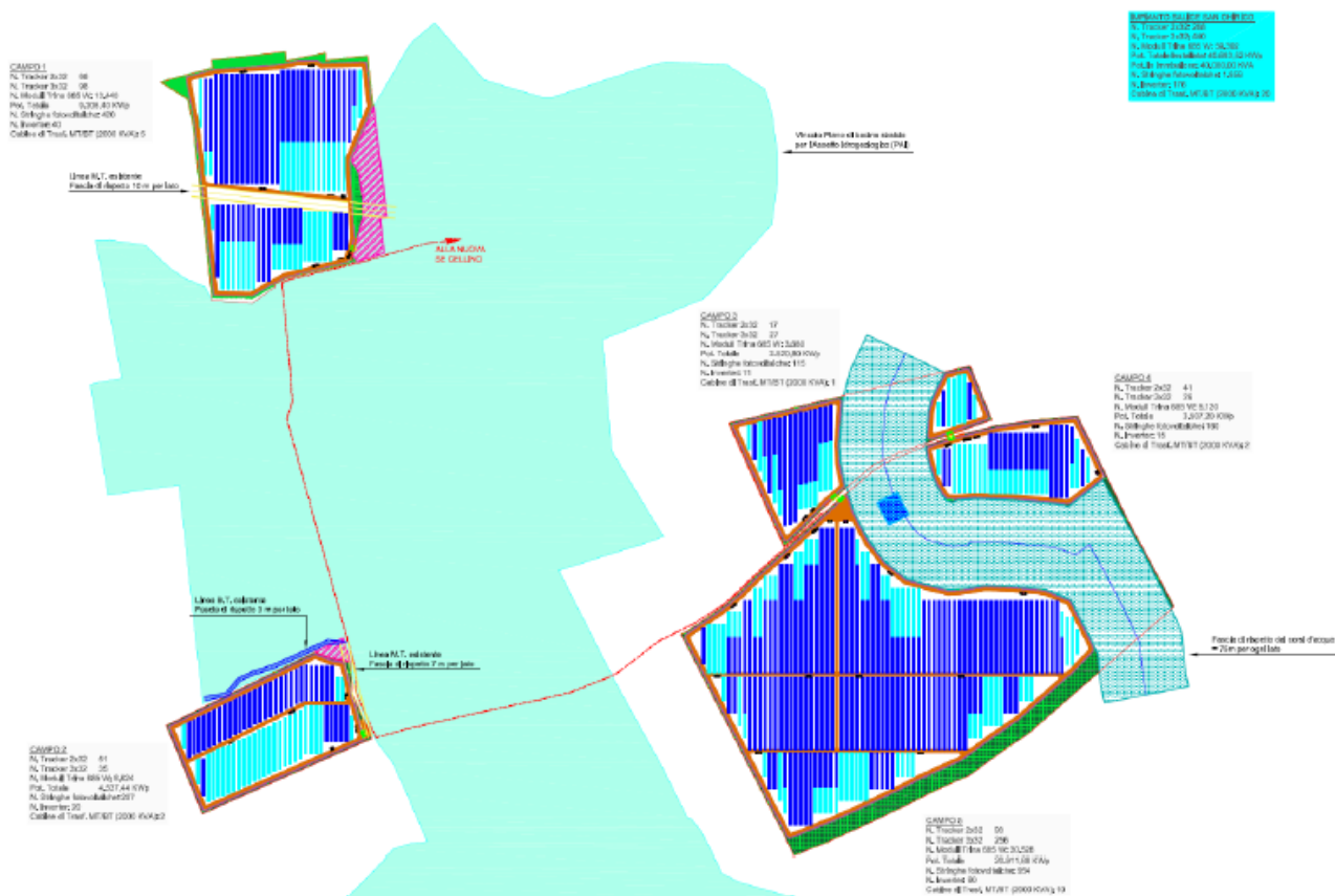
Fig. 3 – Layout di impianto