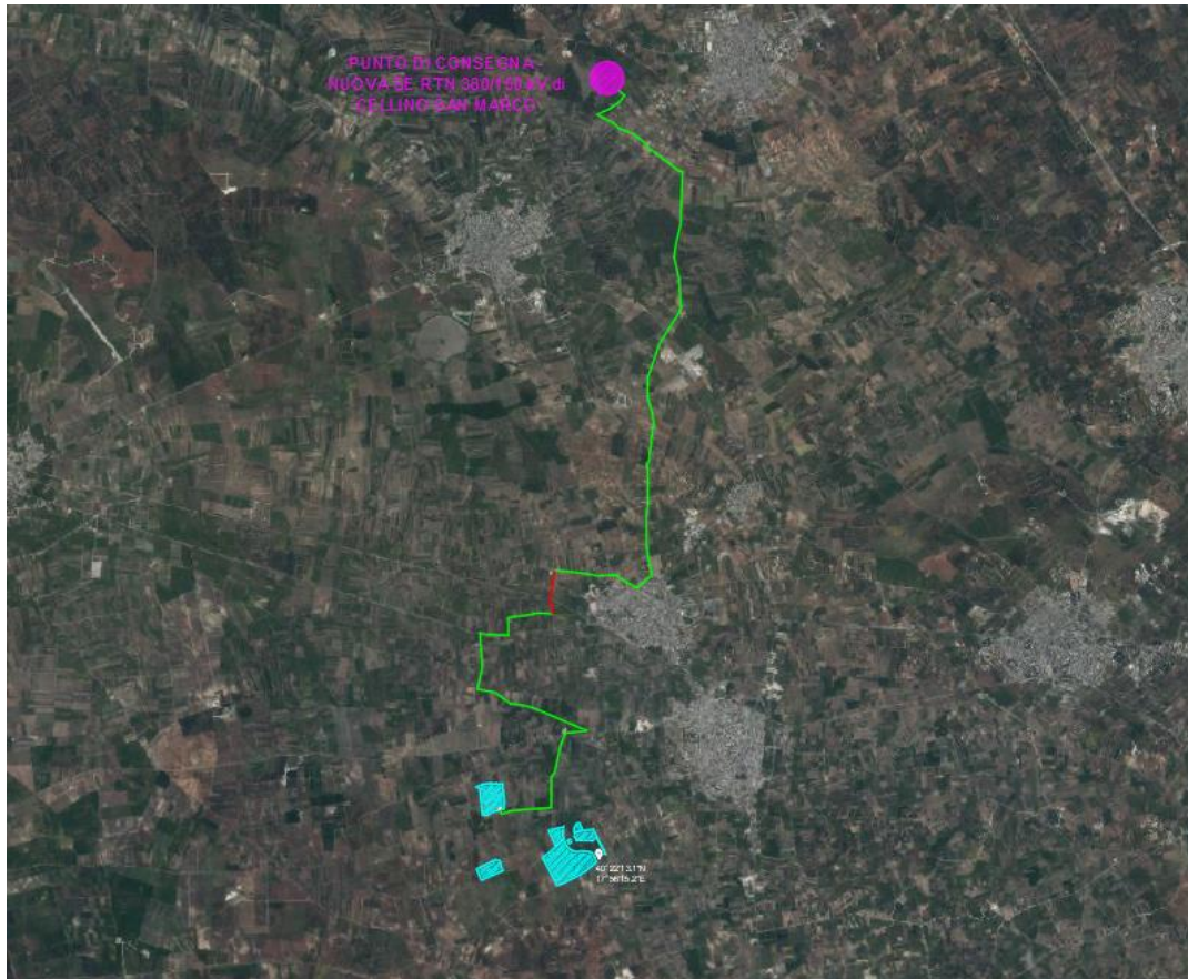
Fig. 2 – Ortofoto dell’area oggetto d’intervento e del tracciato del cavidotto fino al punto di consegna