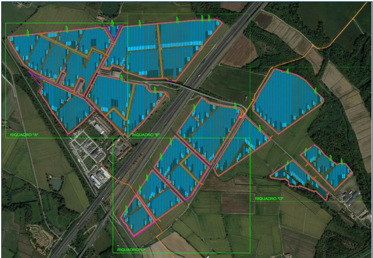
Figura 1. Sito di intervento di Santhià