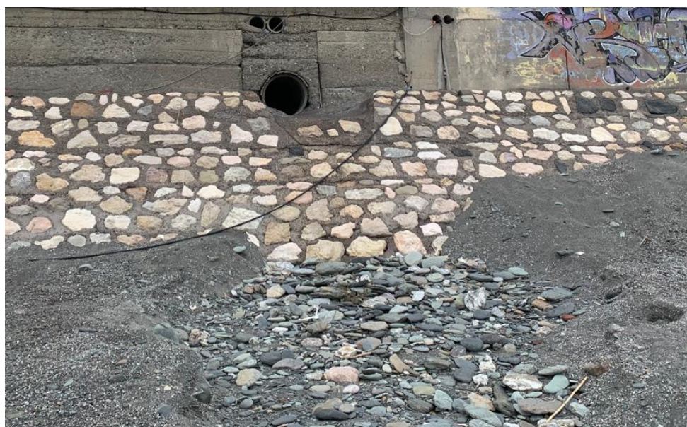
Figura 2-5: Interferenza n. 4