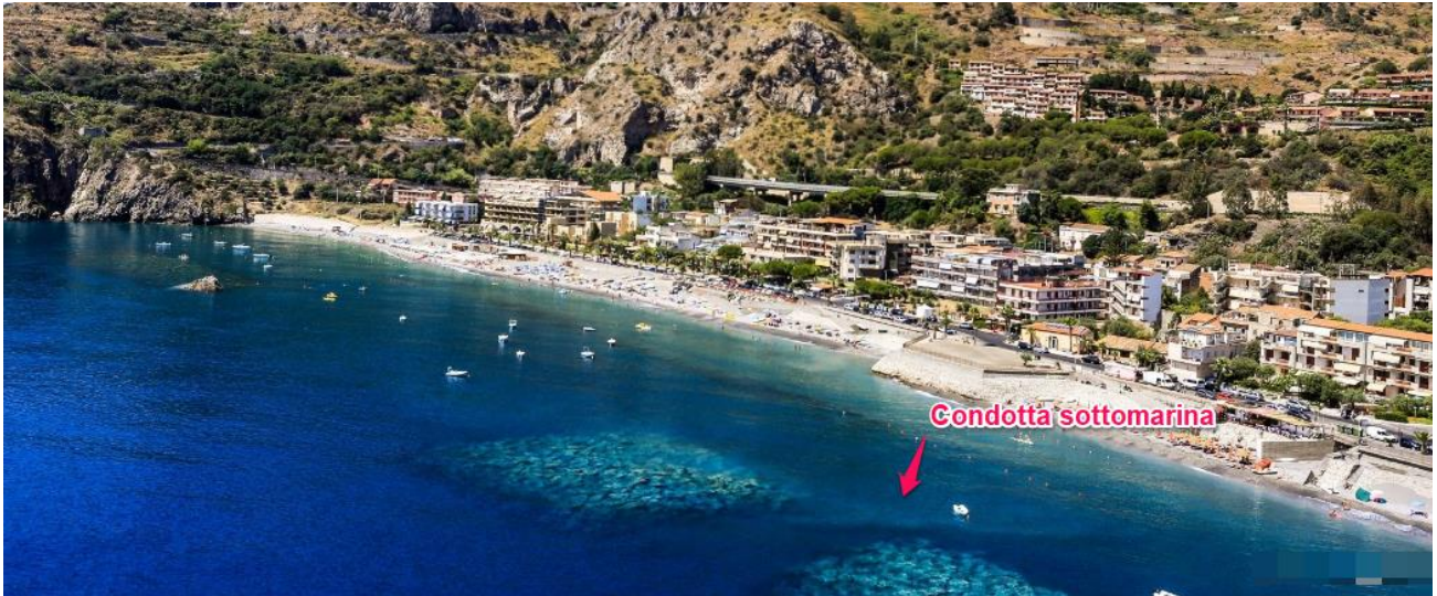
Figura 2-2: Interferenza n. 1