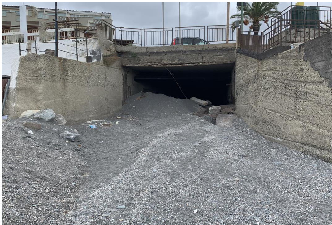
Figura 2-3: Interferenza n. 2