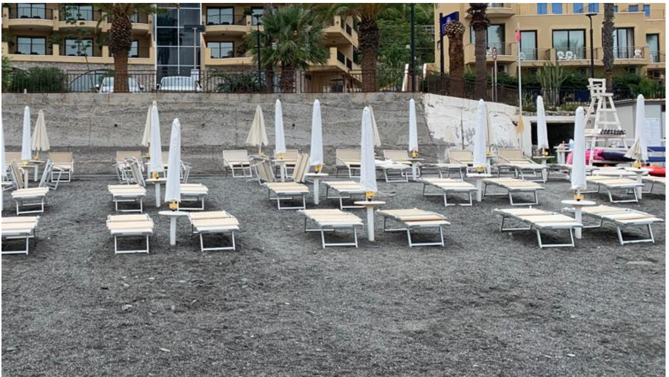
Figura 2-4: Interferenza n. 3