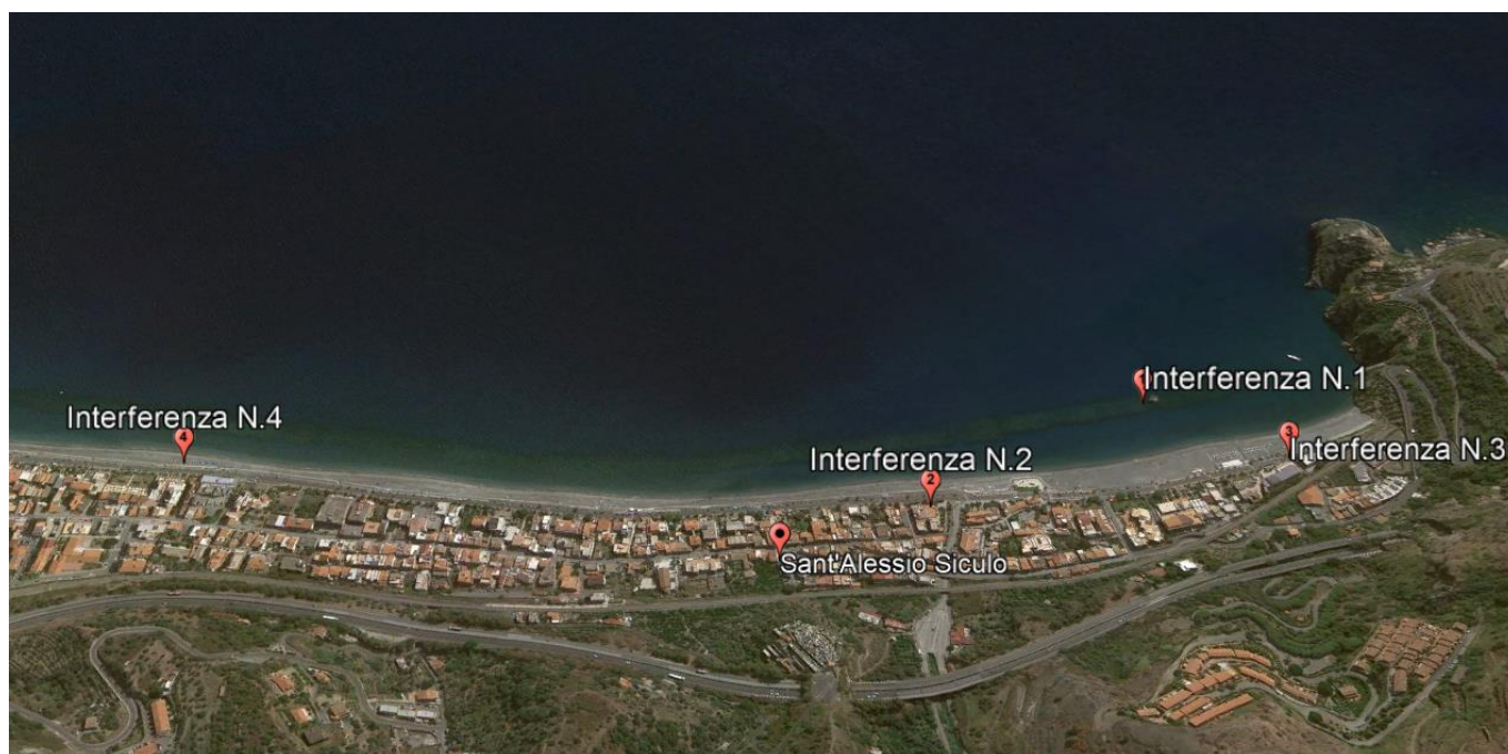
Figura 2-1: Localizzazione interferenze

A seguito di specifico sopralluogo, sono state individuate una serie di interferenze classificabili come superficiali (a meno della condotta sottomarina - interferenza n. 1):