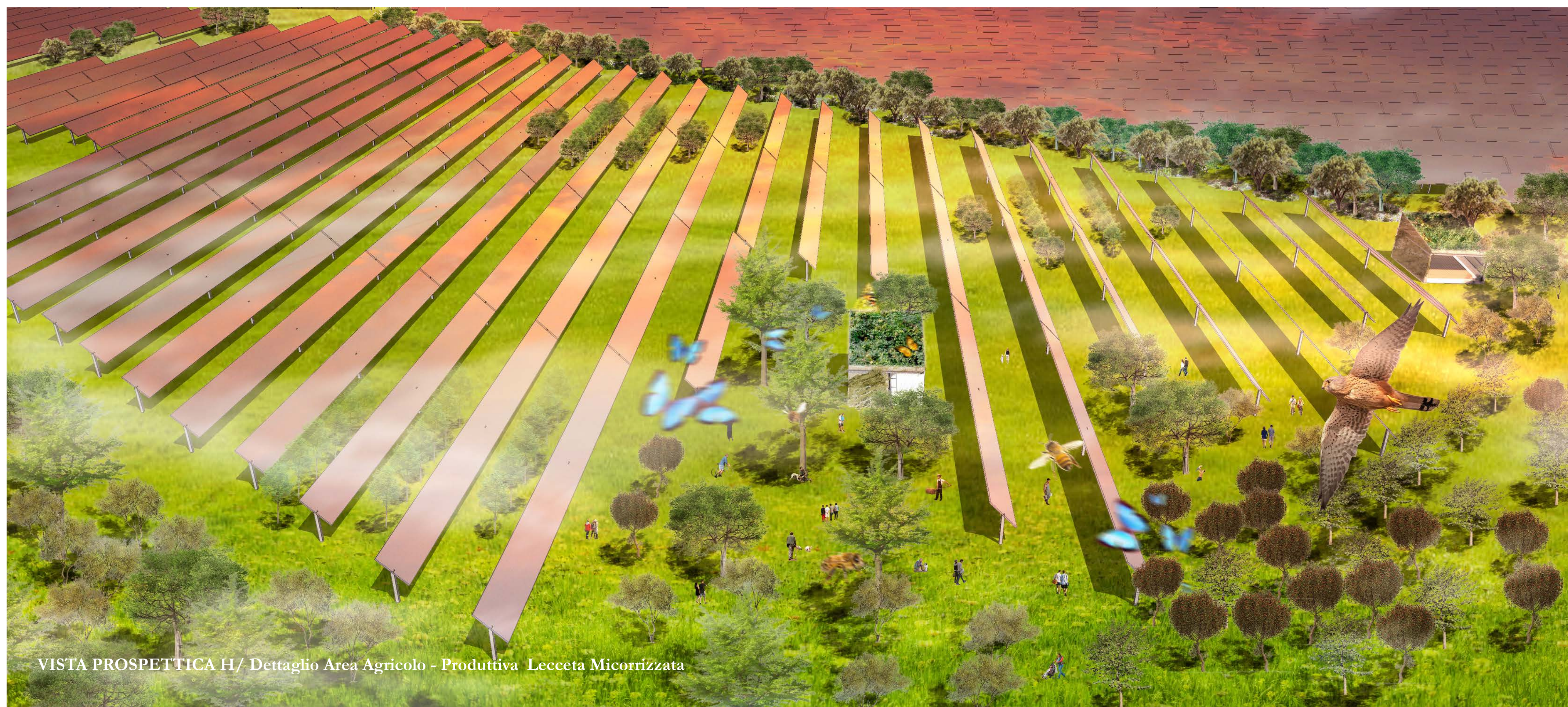
VISTA PROSPETTICA H/ Dettaglio Area Agricola - Produttiva Lecceza Micorrizzata