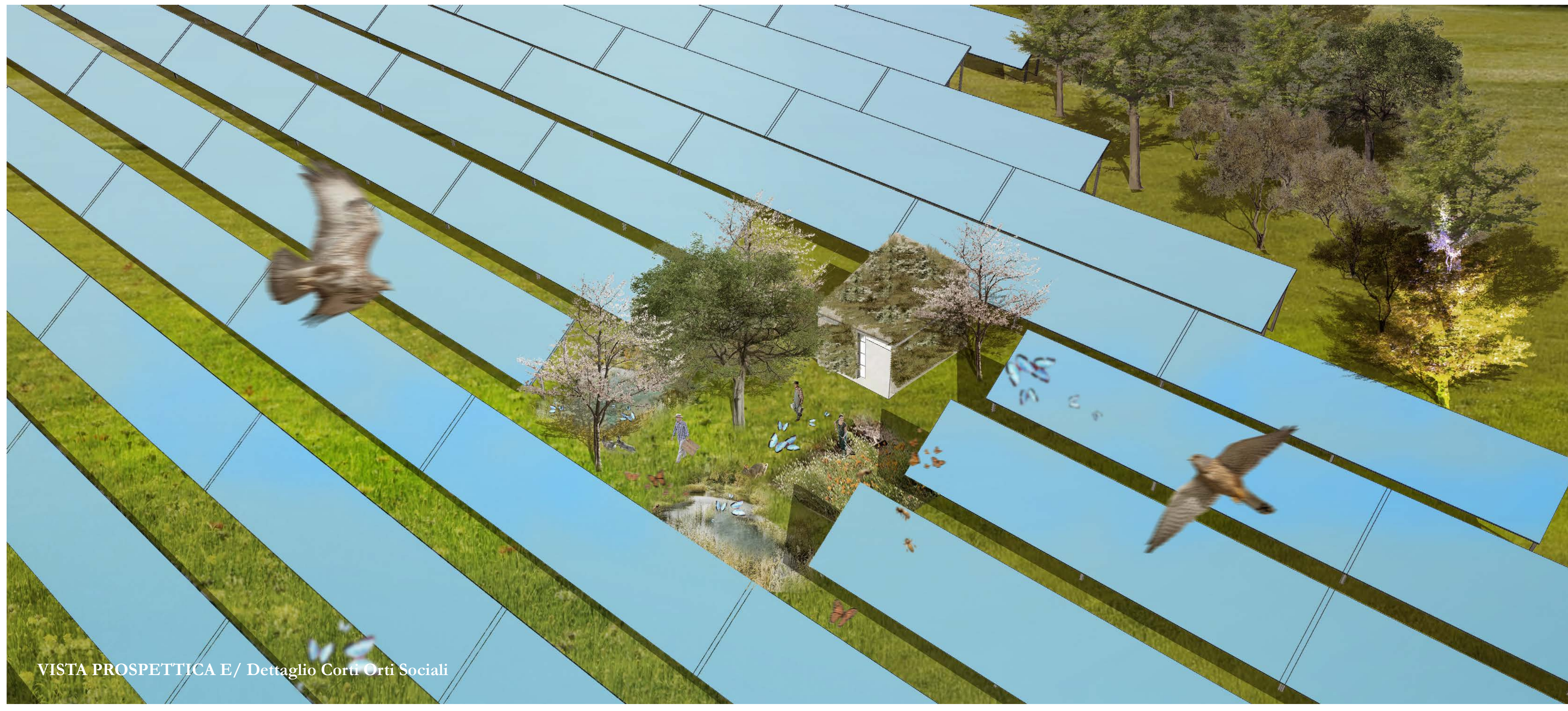
VISTA PROSPETTICA E/ Dettaglio Corti Orti Sociali