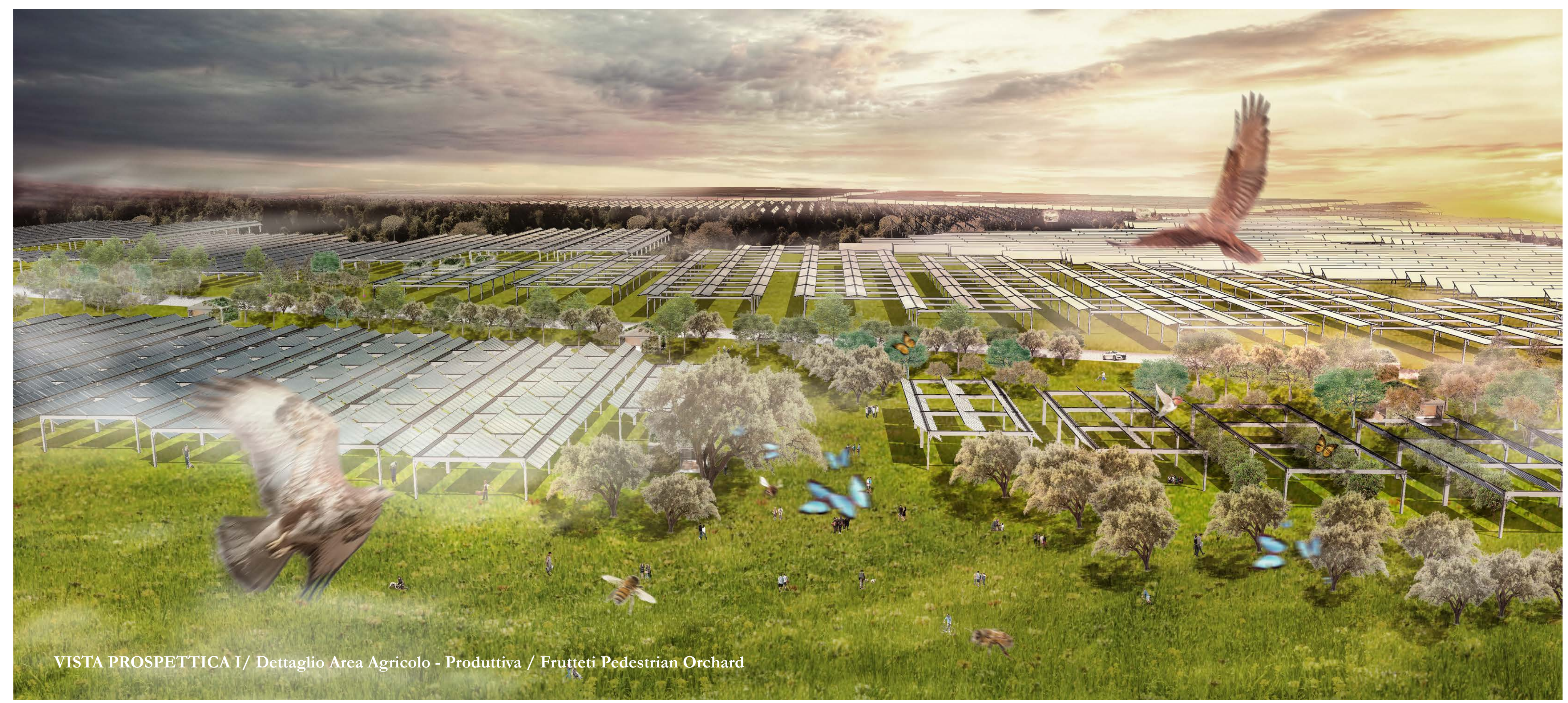
VISTA PROSPETTICA I/ Dettaglio Area Agricola - Produttiva / Frutteti Pedestrian Orchard