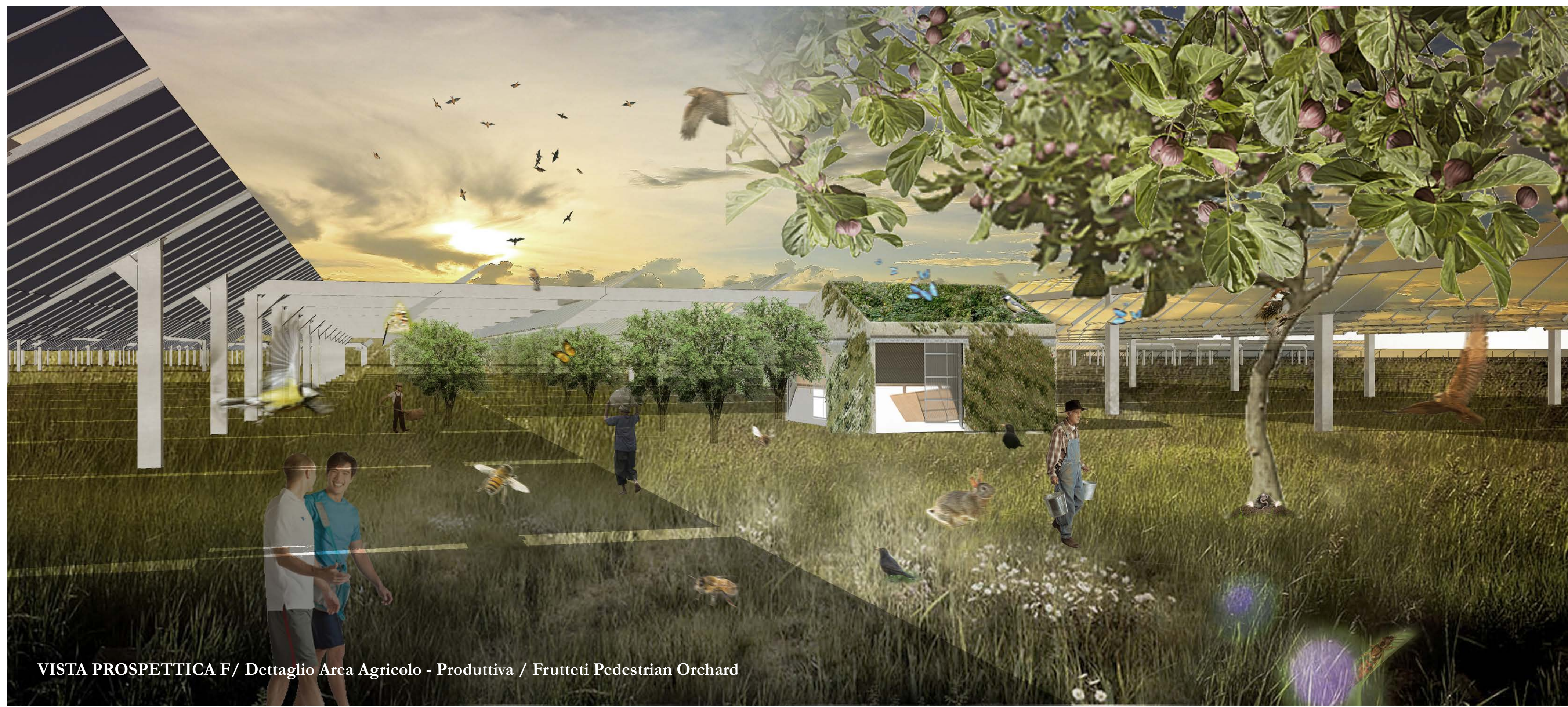
VISTA PROSPETTICA F/ Dettaglio Area Agricola - Produttiva / Frutteti Pedestrian Orchard