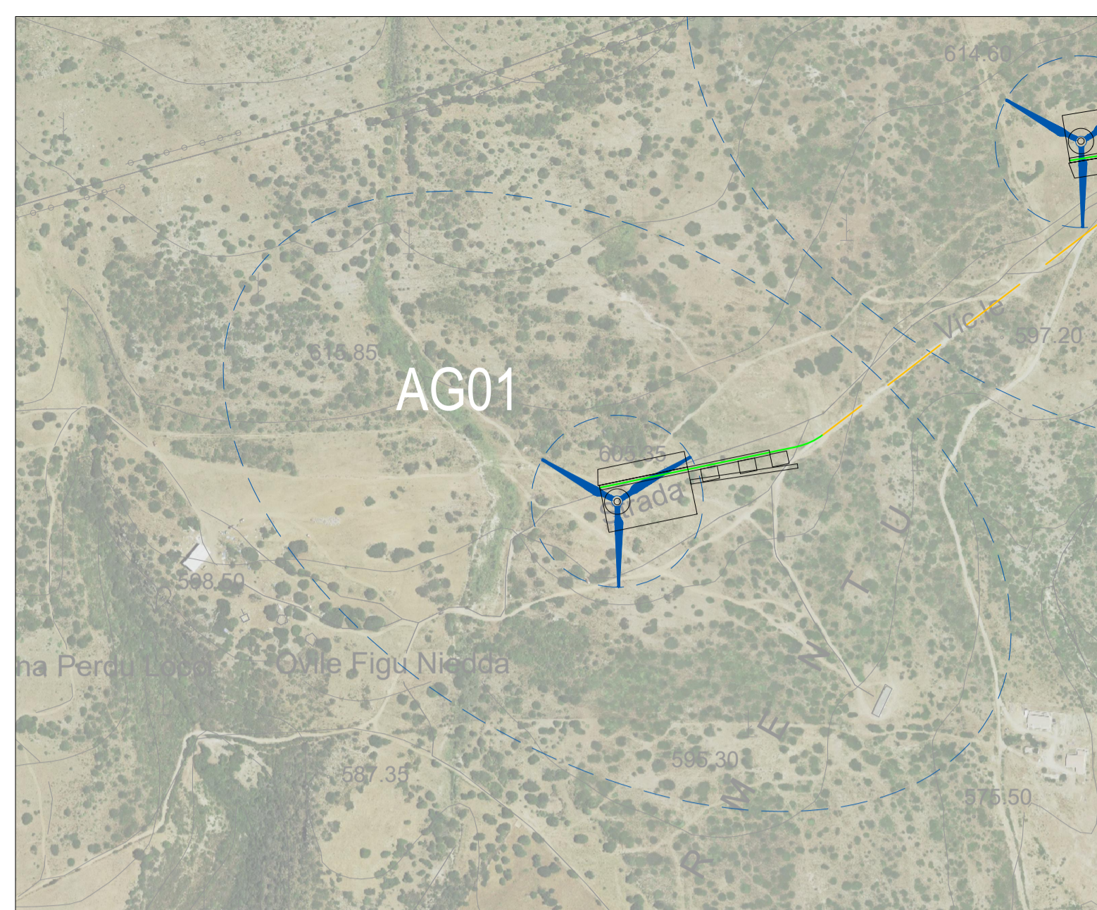
Stralcio Ortofoto - Scala 1:5000