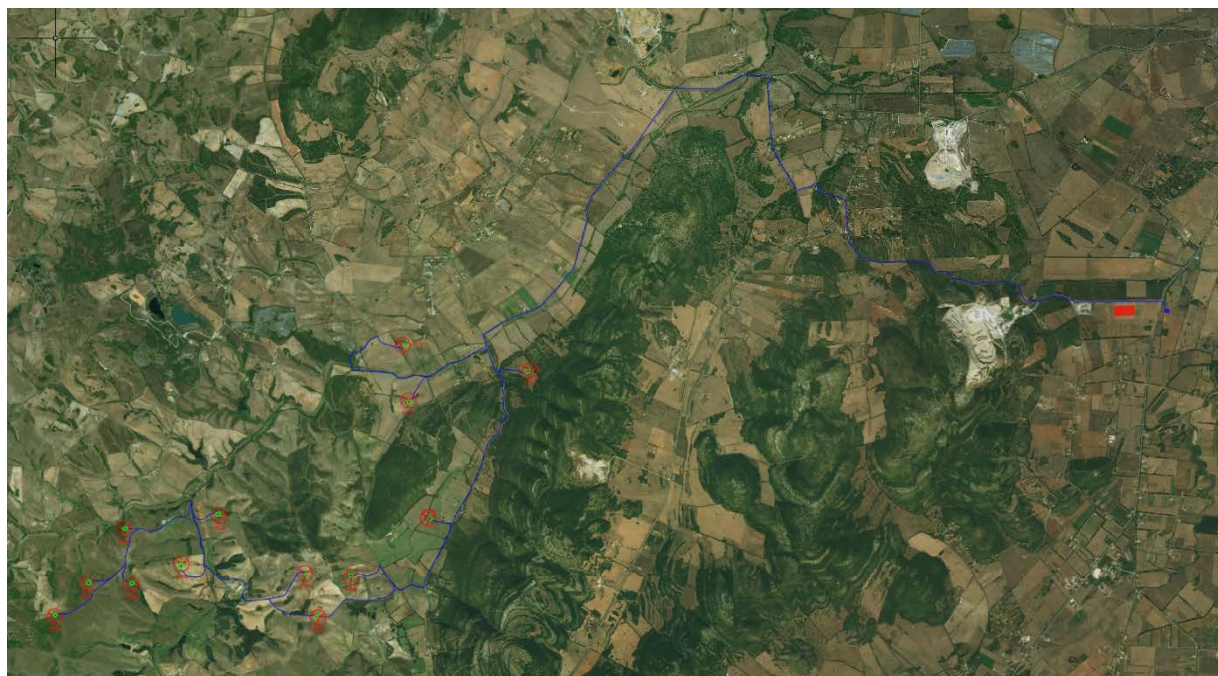
Figura 1: Inquadramento territoriale su ortofoto

L'impianto di progetto è costituito da 12 aerogeneratori modello Siemens Gamesa SG170 della potenza nominale approssimativa di 6.0 MW per una potenza totale complessiva di circa 72 MW.