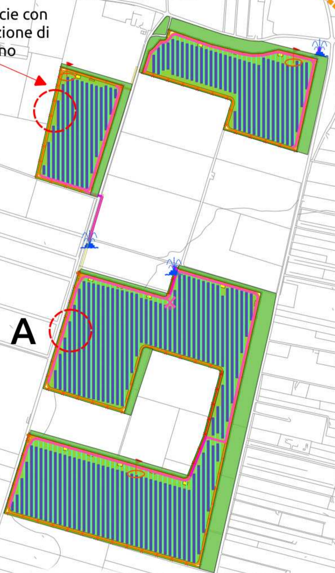
SEZIONE A Orientamento Tracker Ore 12.00