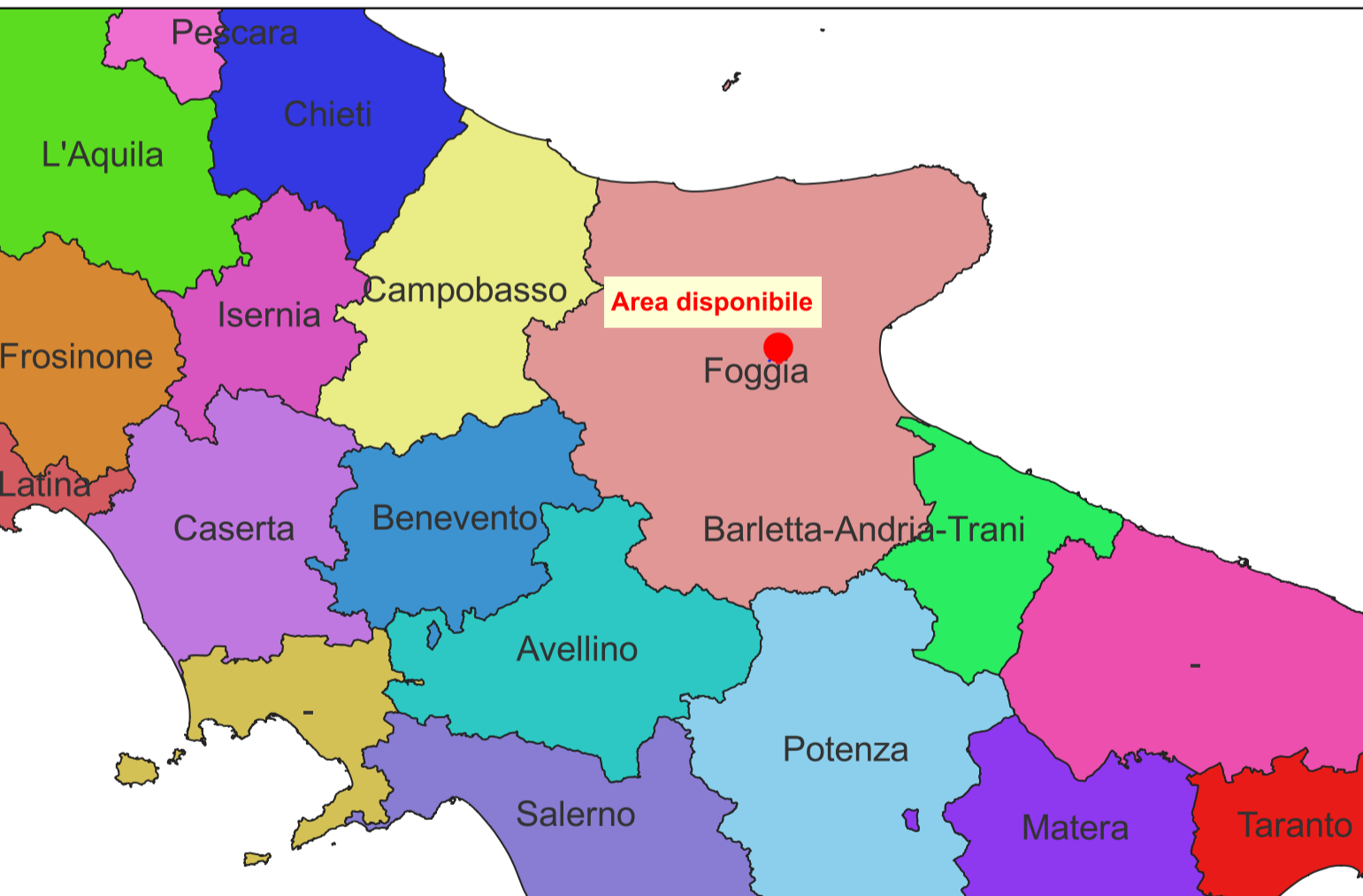
INQUADRAMENTO TERRITORIALE - SCALA 1:1.500.000