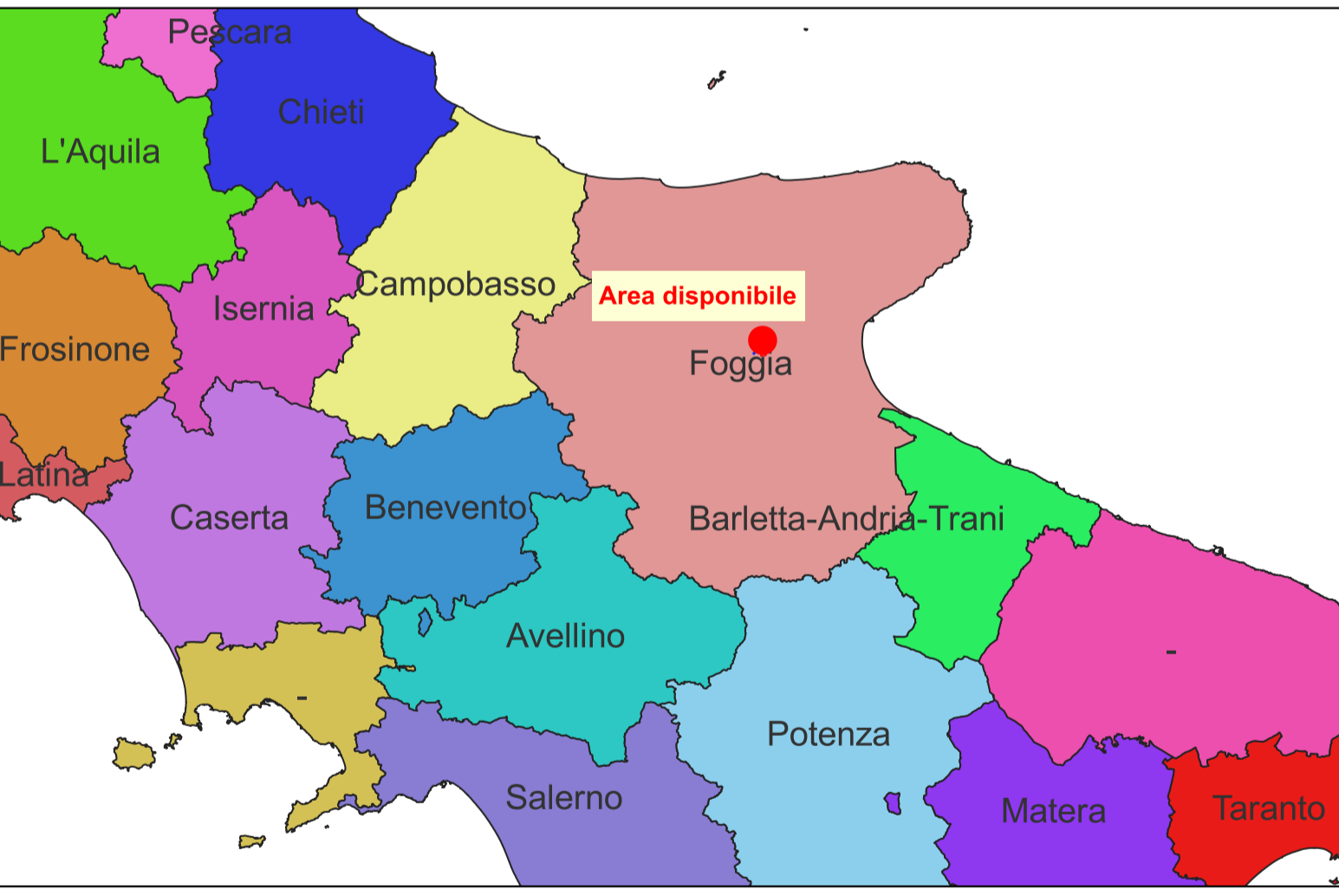
INQUADRAMENTO TERRITORIALE - SCALA 1:1.500.000