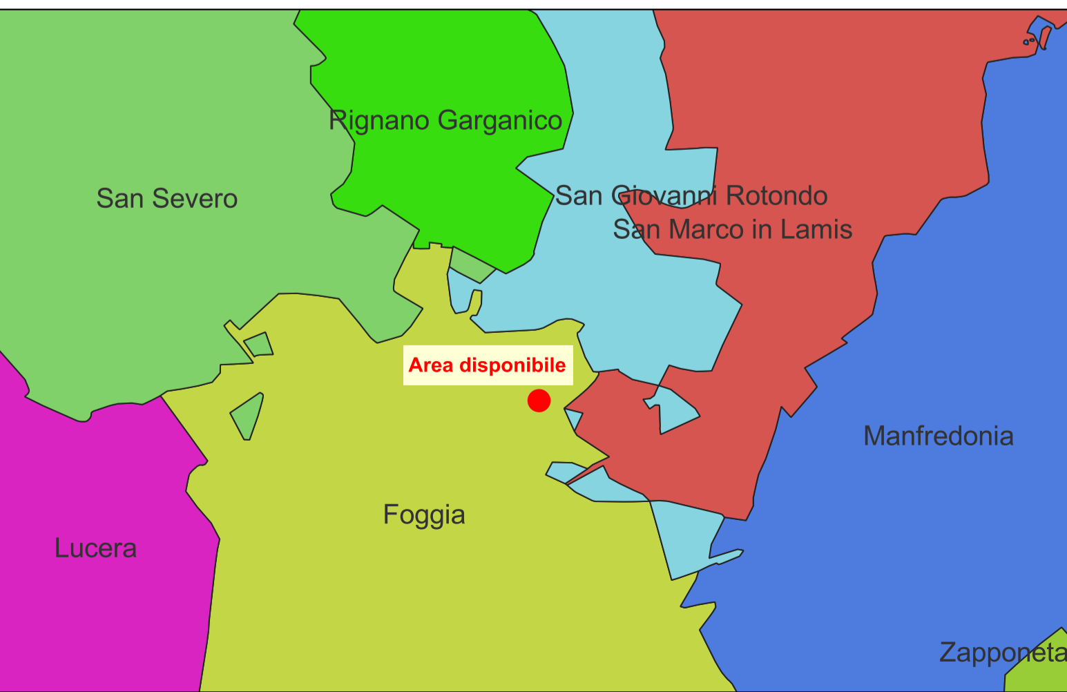
INQUADRAMENTO TERRITORIALE - SCALA 1:200.000