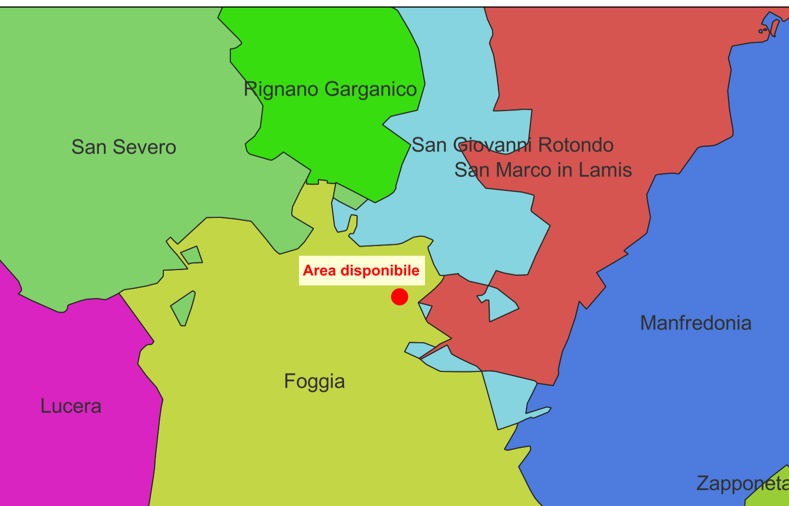
INQUADRAMENTO TERRITORIALE - SCALA 1:200.000