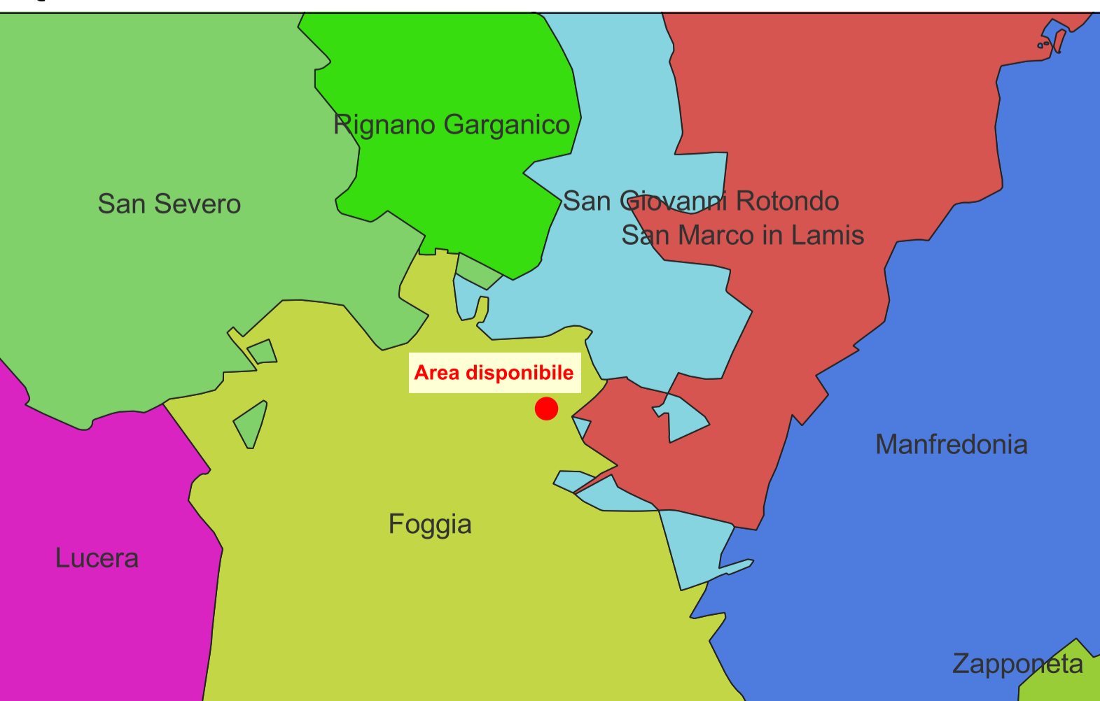
INQUADRAMENTO TERRITORIALE - SCALA 1:200.000