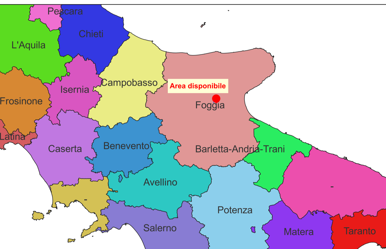
INQUADRAMENTO TERRITORIALE - SCALA 1:1.500.000