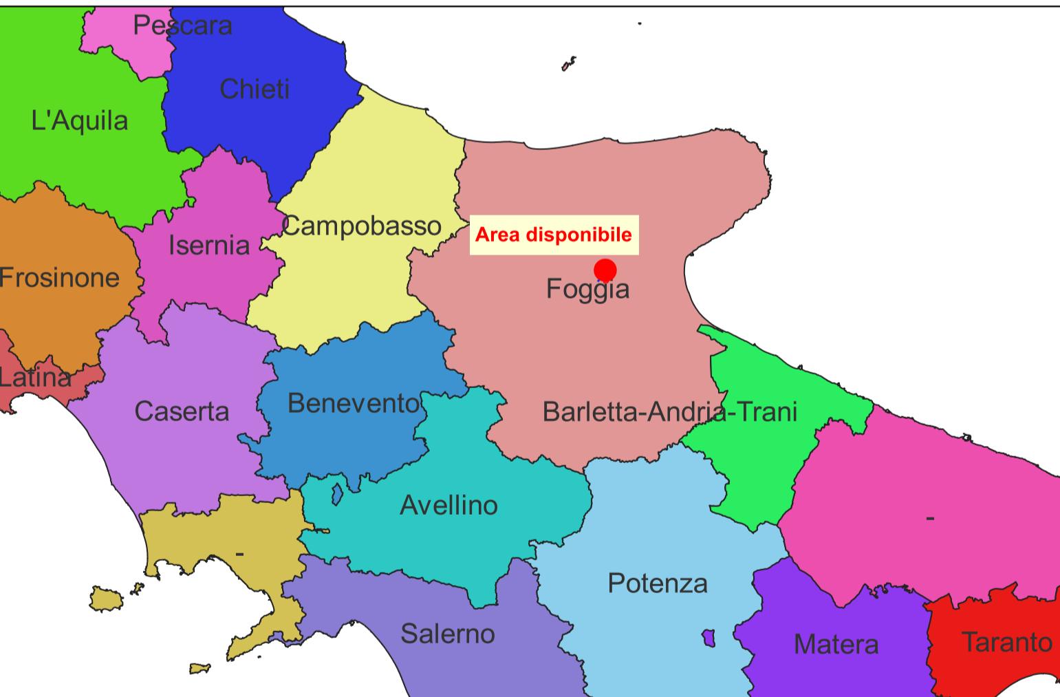
INQUADRAMENTO TERRITORIALE - SCALA 1:1.500.000