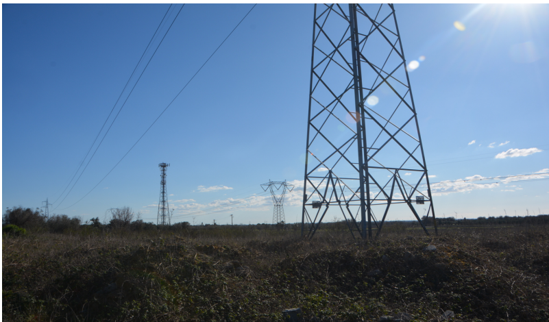
Fig. 4 L'area dell'impianto. Le linee e i tralicci dell'alta tensione. Vista da Sud

presunte anomalie/evidenze archeologiche esterne all'area oggetto di indagine. Nelle immediate vicinanze, nei terreni adiacenti all'area della centrale, però, non si sono riscontrati frammenti archeologici in superficie. Il cd "rischio archeologico" potrebbe dipendere dal fatto che molto del terreno indagato sembra essere di riporto. Un'altra cosa da annotare è l'incongruenza esistente tra la