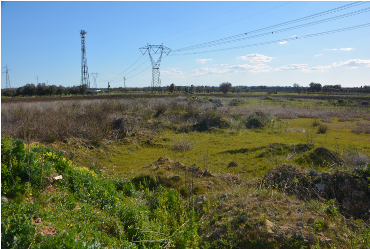
Fig. 5 L'area dell'impianto. Sullo sfondo la strada vecchia per San Donaci. Vista da Nord

Lungo questa linea di confine, un altro elemento archeologico è stato rinvenuto in un punto del limite Est dell'area. A ridosso di uno scalino di roccia, impostato in senso NO-SE, si è rivenuta, in piedi, infissa nel terreno, una fineta , cioè quel blocco squadrato in pietra locale, parallelepipedo, tipico strumento della divisione agraria dei terreni di origine romana (Fig. 6). Si crede che il blocco qui non abbia una funzione originale per cui non si è indicata l'unità topografica ma si è soltanto provveduto a notificare la sua presenza.