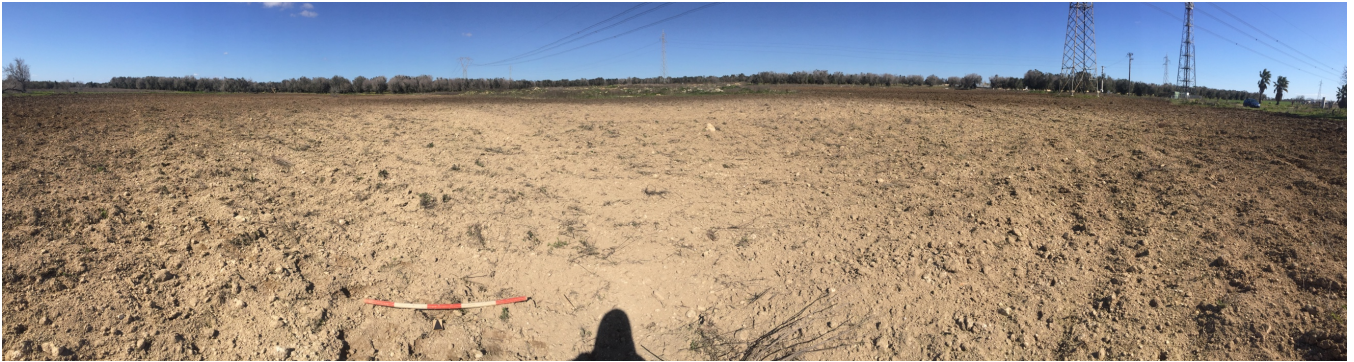
Fig. 11 L'area dell'impianto.. Vista da Sud