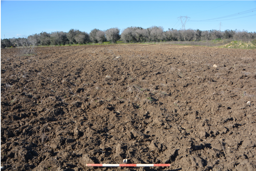
Fig. 9 L'area dell'impianto. Sullo sfondo la strada vecchia per San Donaci. Vista da Sud