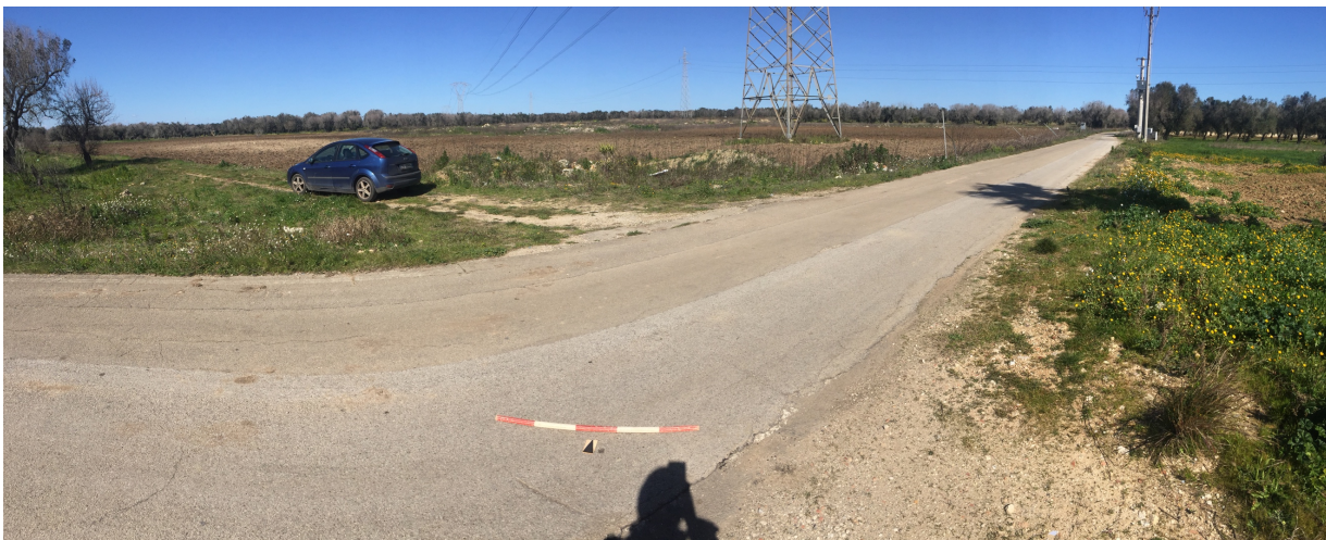
Fig. 10 L'area dell'impianto. La strada vecchia per San Donaci. E l'accesso all'area. Vista da SO