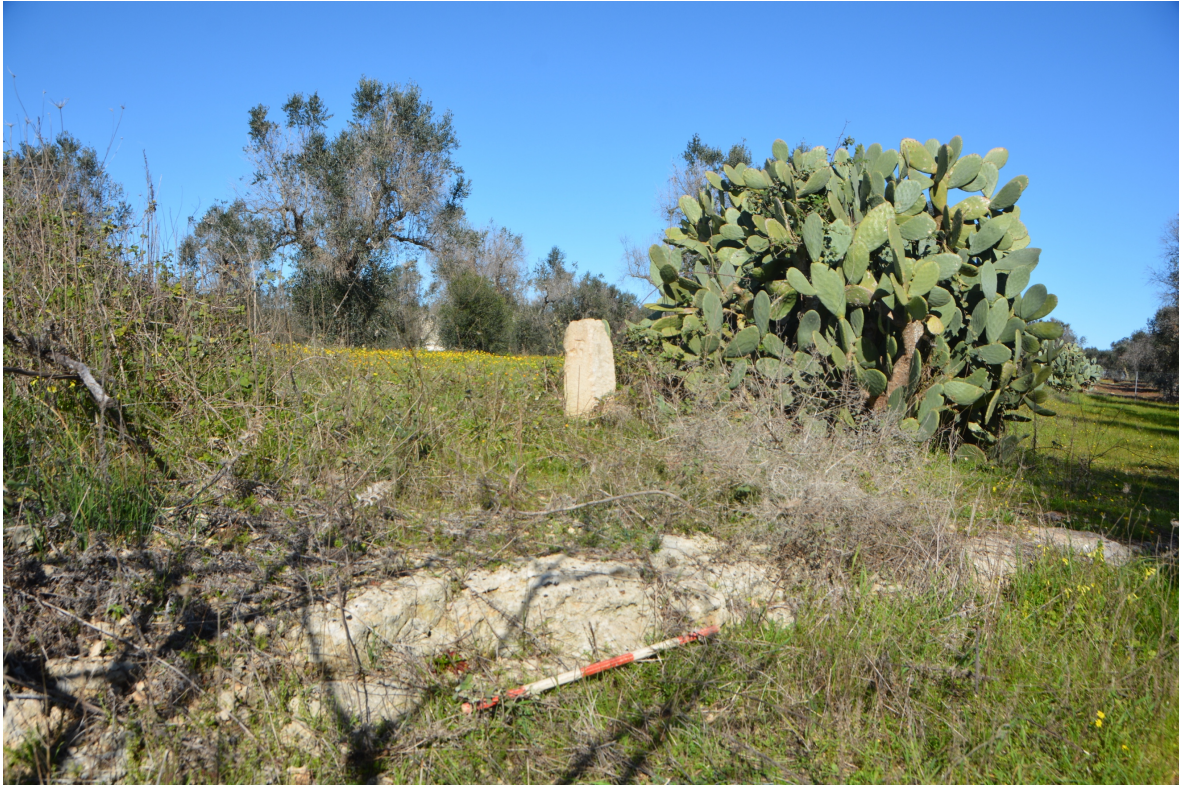
Fig. 7 Lo scalino di roccia e la fineta Vista da SO