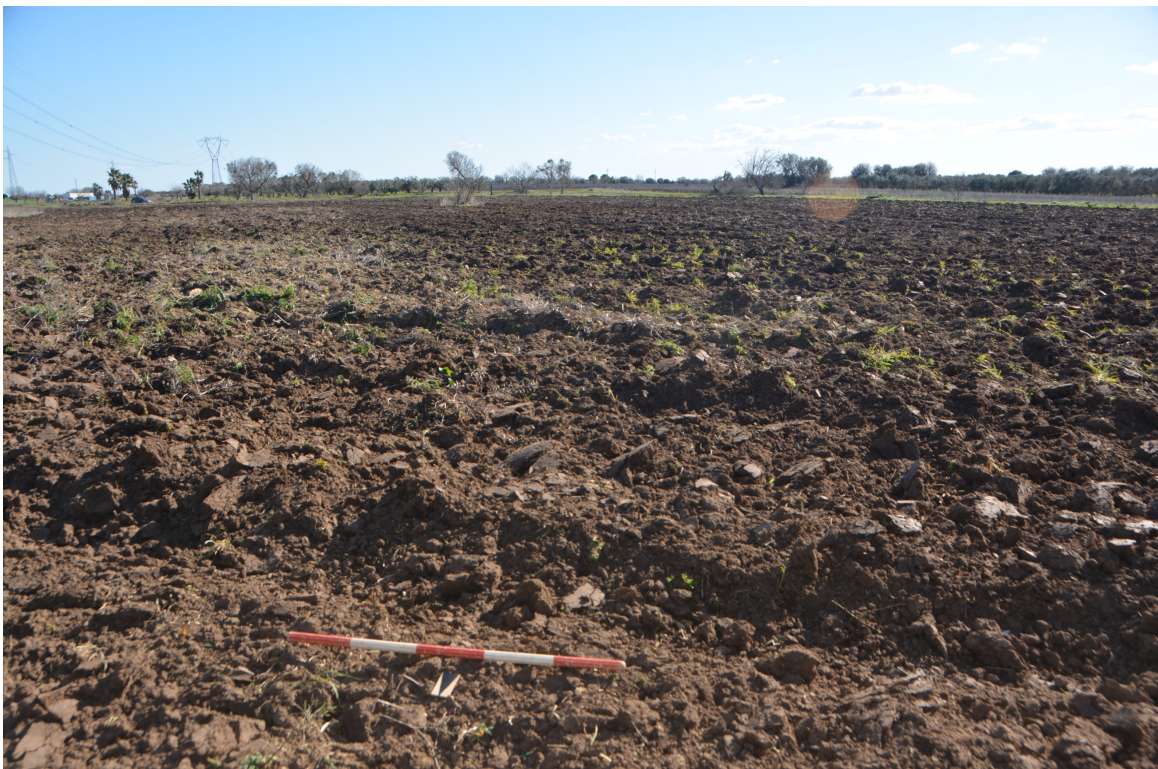
Fig. 8 L'area dell'impianto. Sullo sfondo la strada vecchia per San Donaci. Vista da NE