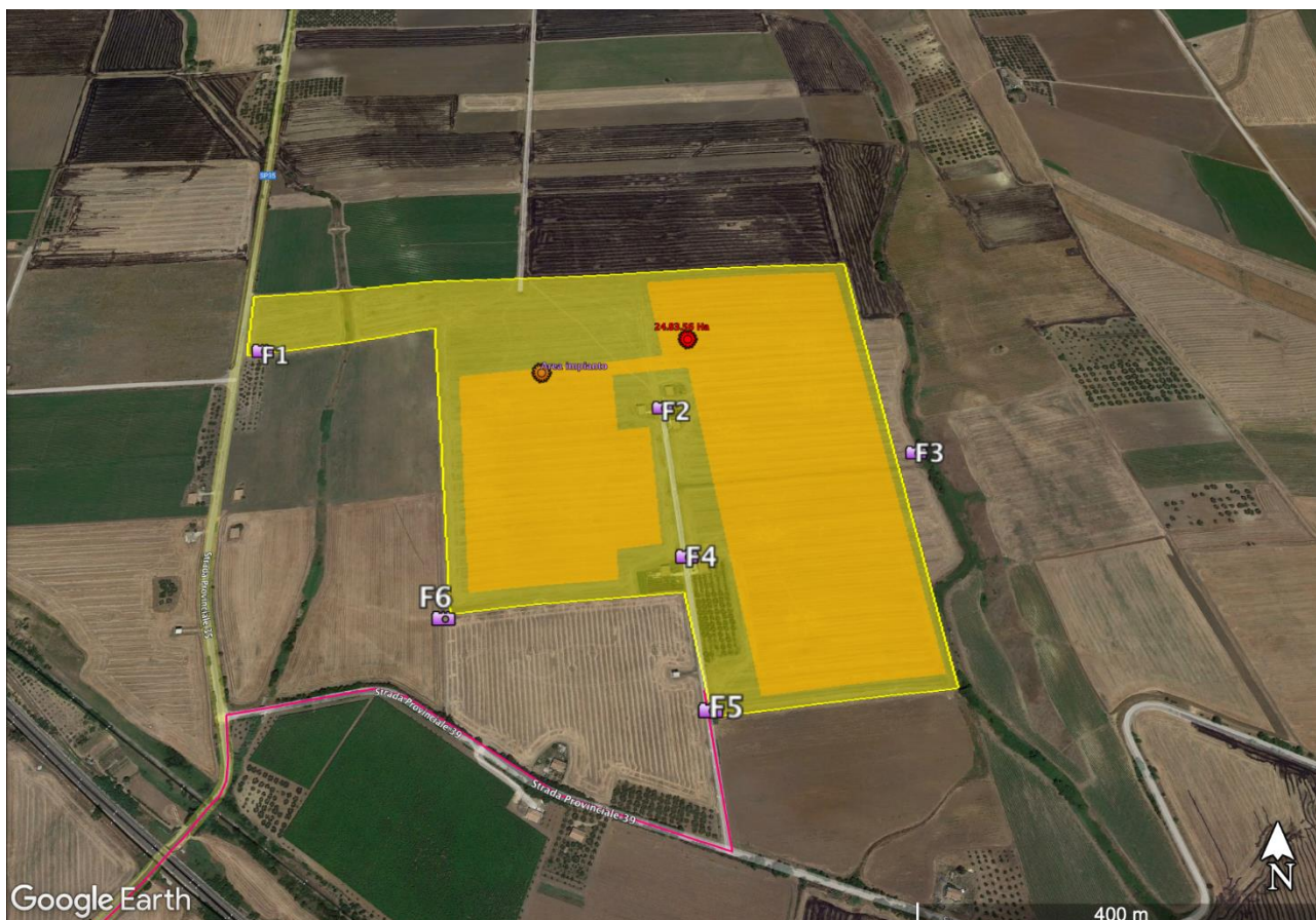
Figura 4: Ortofoto illustrante i punti di scatto relativi al sopralluogo.