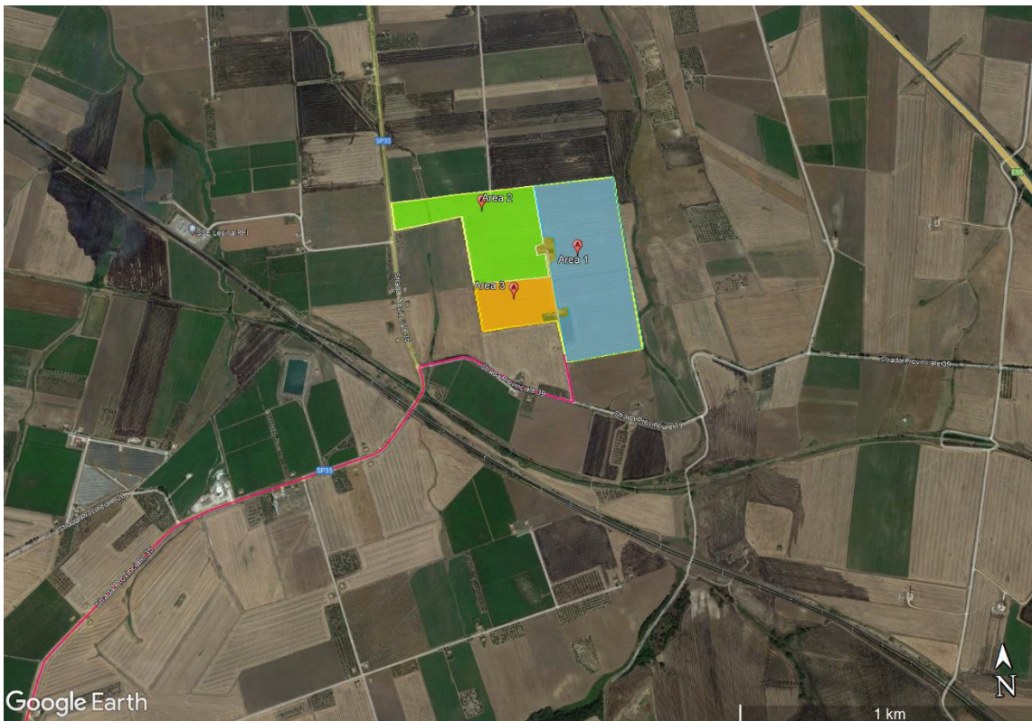
Figura 5: Ortofoto delle aree di impianto, coltivazione dello spinacio (in celeste), lattuga (verde), cima di rapa (arancione).