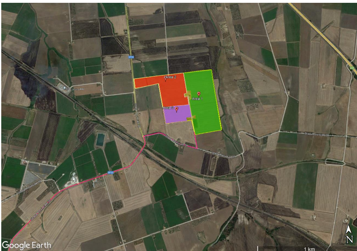
Figura 6: Ortofoto delle aree di impianto, coltivazione area coltivazione piselli (in verde), patata (in rosso), coriandolo (in viola).