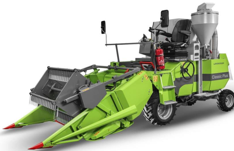
Figura 7: Immagine esemplificative di una trattrice da frutteto (in alto) e di una mietitrebbia parcellare (in basso).