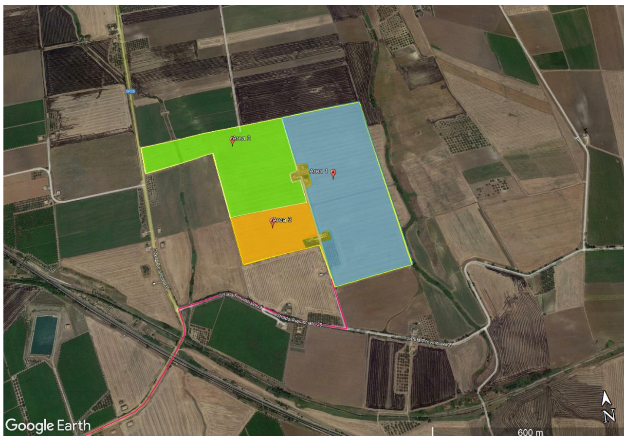
Figura 1: Ortofoto delle aree interessate dal progetto, Area 1 (in celeste), Area 2 (in verde), Area 3 (in arancio).