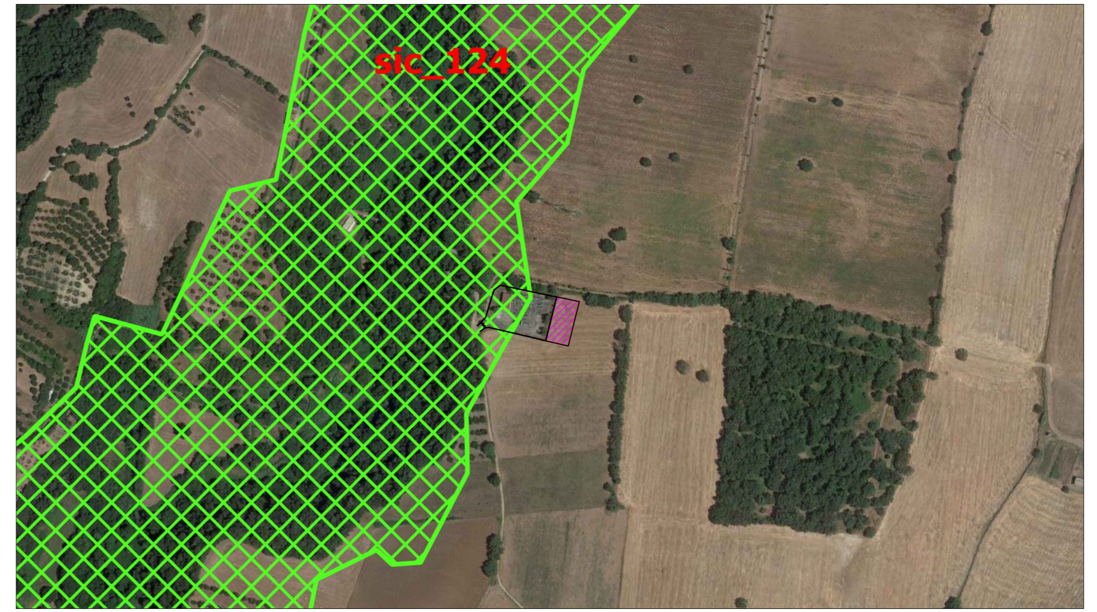
Inquadramento su NATURA 2000 - Scala 1:5.000