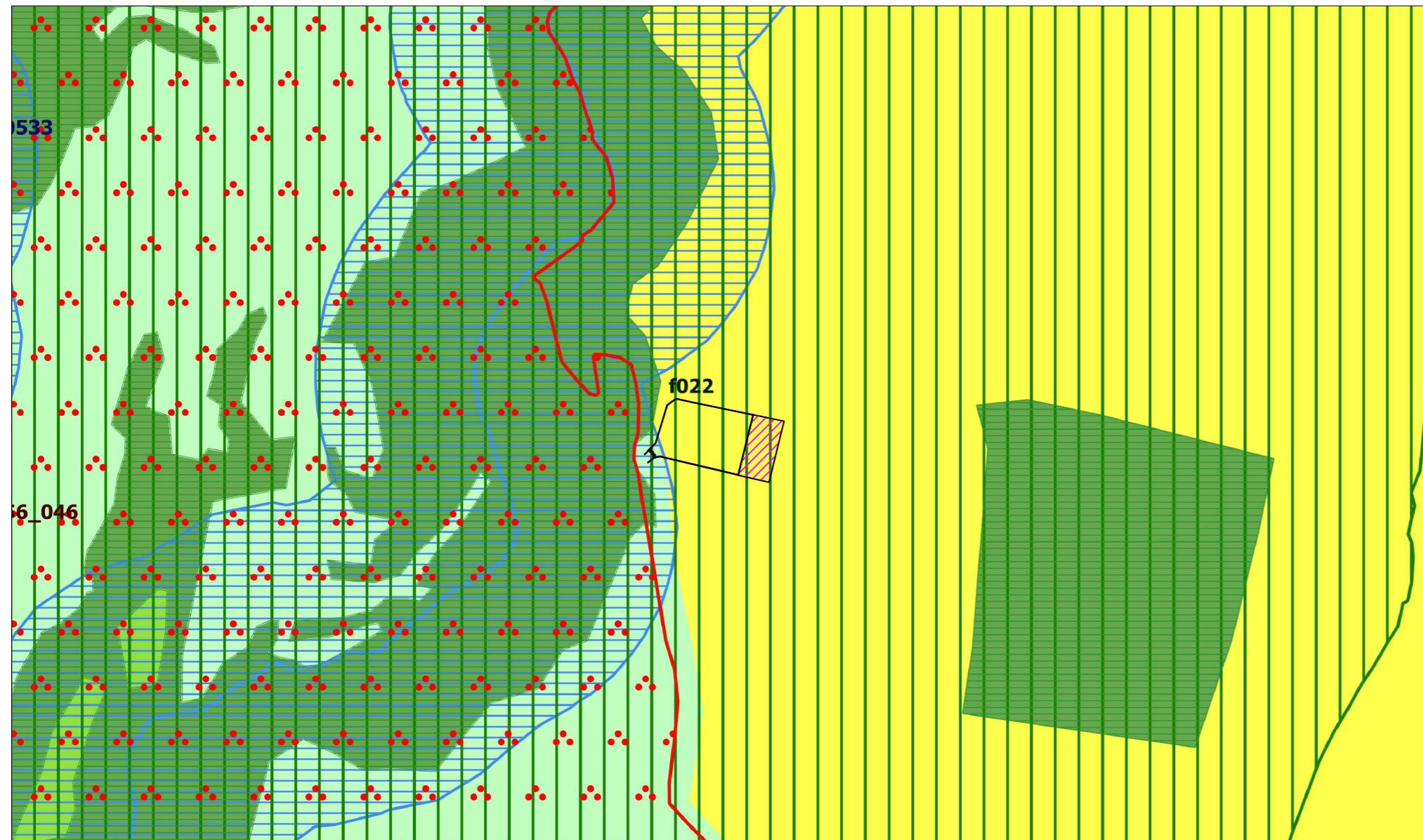
Inquadramento su PTPR - Scala 1:5.000