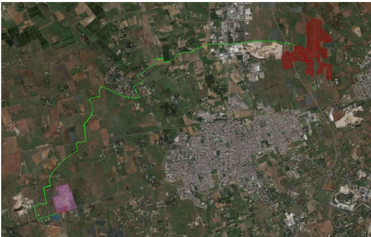
Figura 2 - Area impianto FV in rosso, SSU in azzurro e stazione RTN in magenta

La superficie delle particelle acquisite ai fine della progettazione e futura realizzazione, è pari a 46 ha 30 are e 48 ovvero mq. 463.048; l'area destinata all'impianto fotovoltaico ricopre globalmente una superficie di circa 17,5 ha, e l'area impiegata per la produzione agricola circa 37,56 ha oltre alle opere perimetrali di mitigazione, la viabilità e le pertinenze. La seguente figura riporta uno stralcio ortofoto dell'area di intervento.