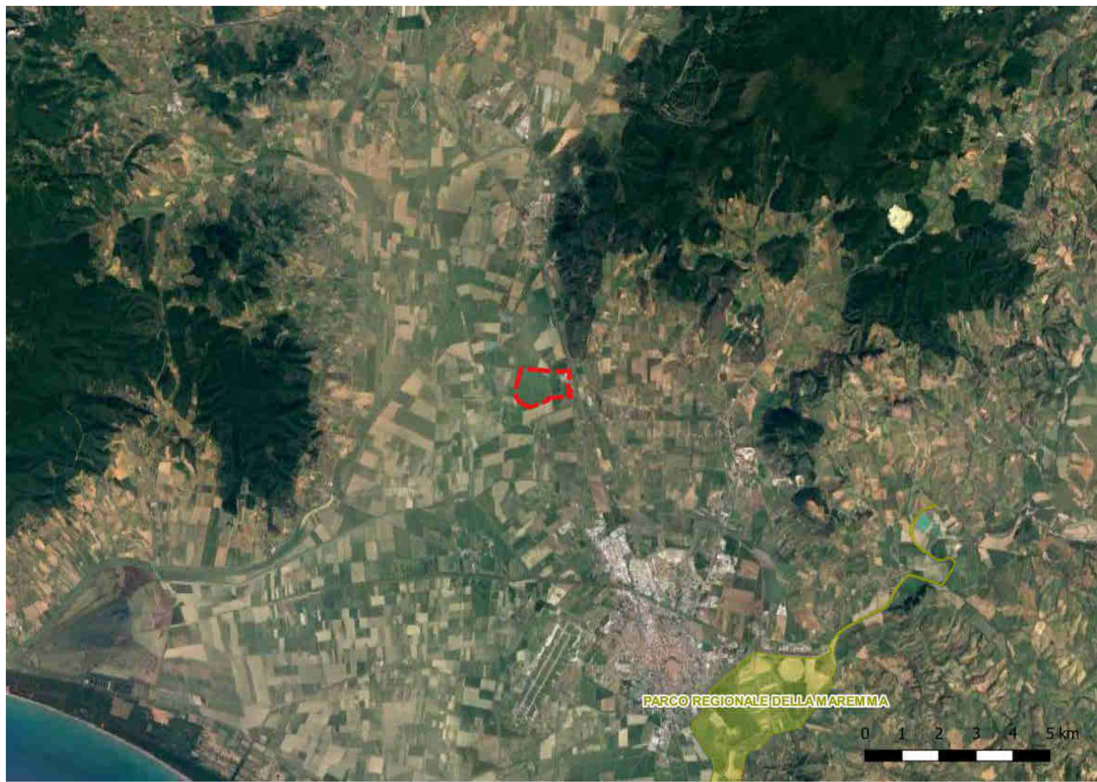
Inquadramento dell'area di intervento in riferimento ai parchi regionali (Parco Regionale della Maremma)