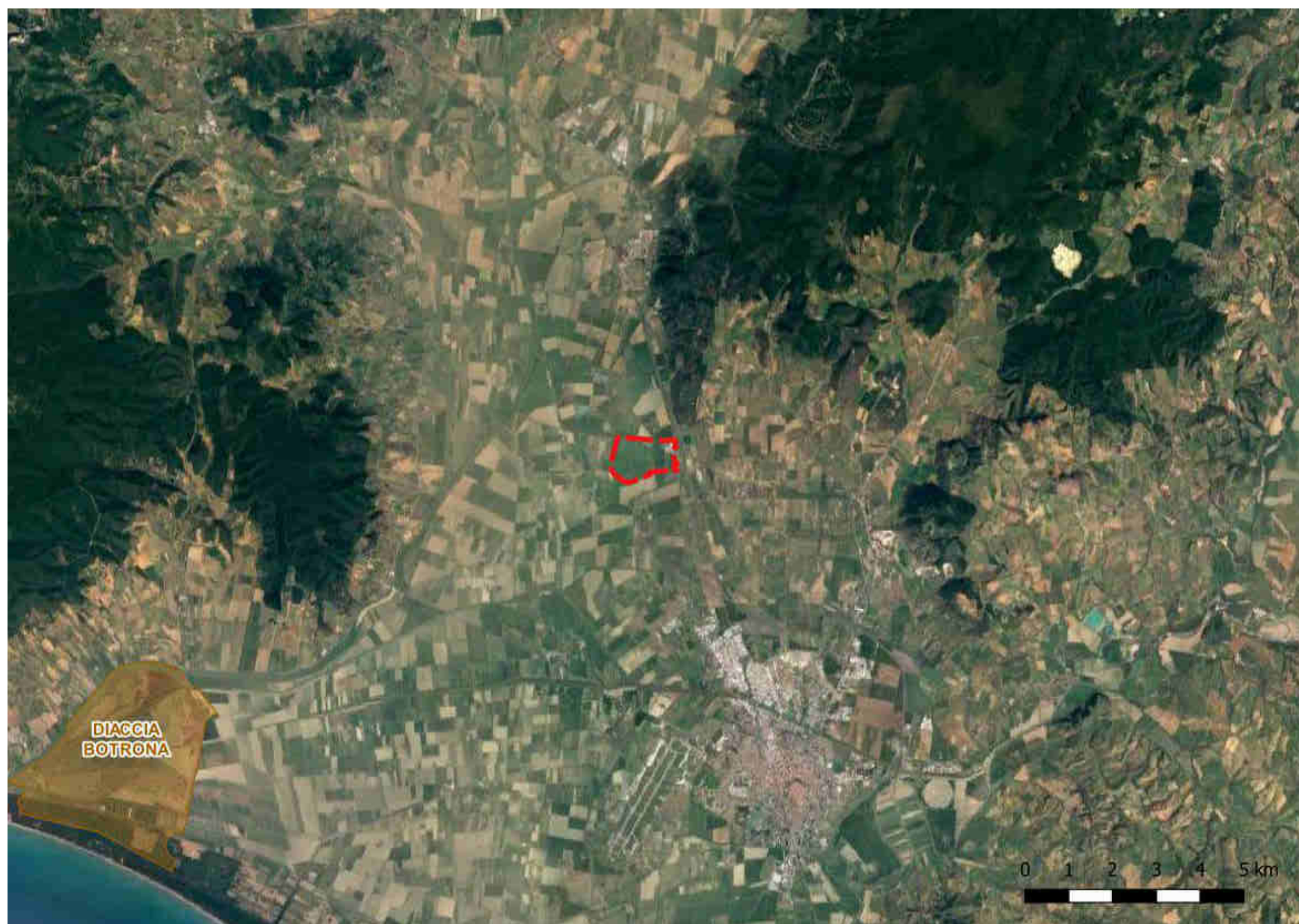
Inquadramento dell'area di intervento in riferimento alle zone umide RAMSAR