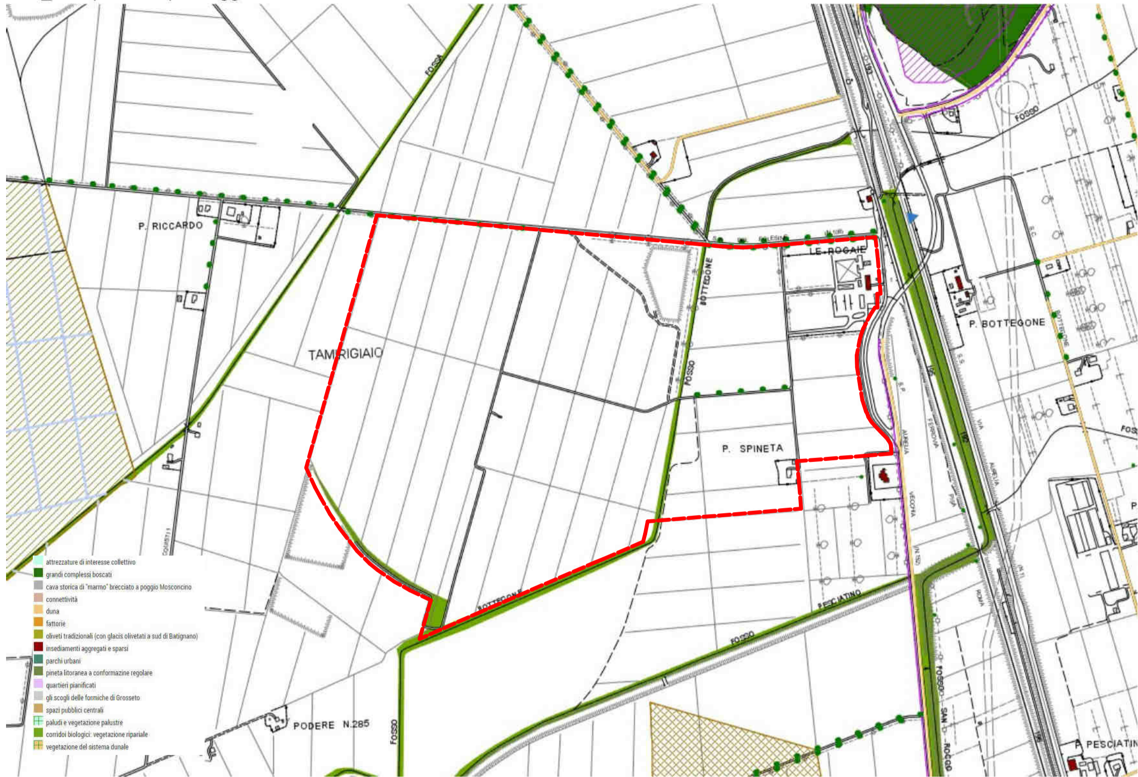
RU GROSSETO_Disciplina del paesaggio e delle invarianti strutturali