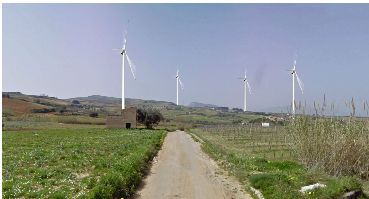
Vista 2 - Stato post-operam (strada comunale)