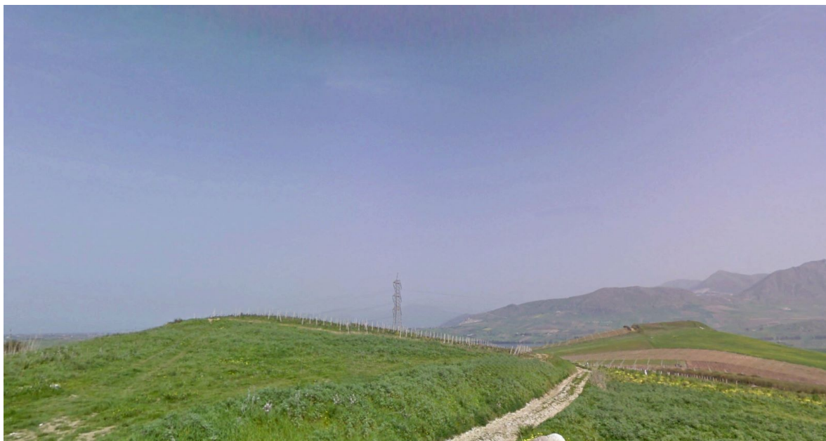
Vista 1- Stato ante-operam (strada comunale)