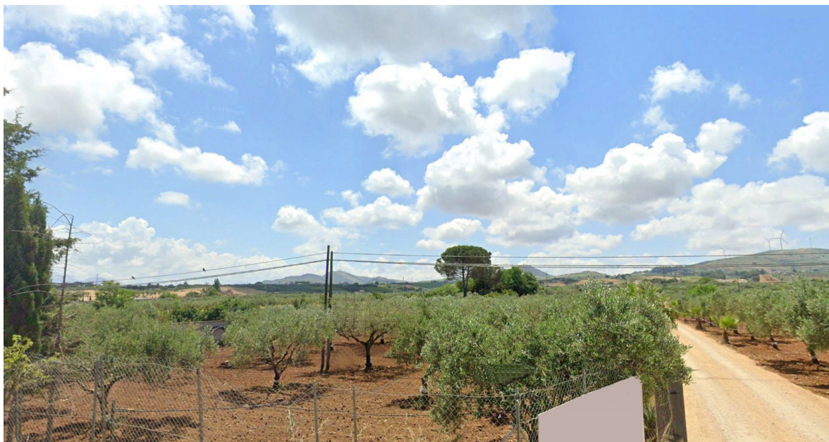
Vista 3 - Stato ante – operam (SS113)