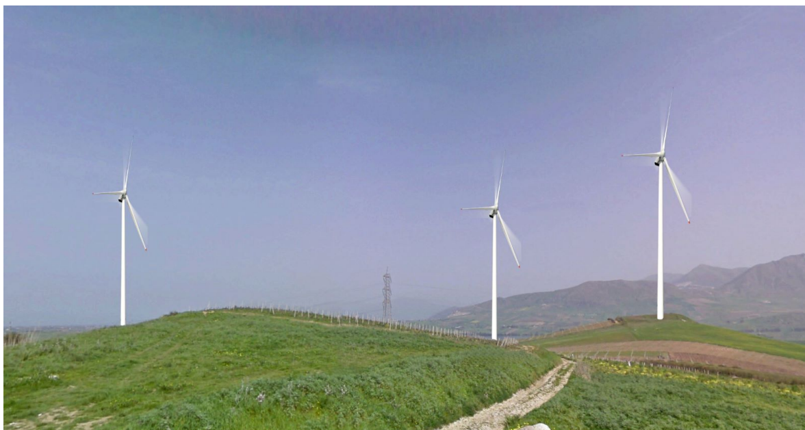
Vista 1- Stato post-operam (strada comunale)