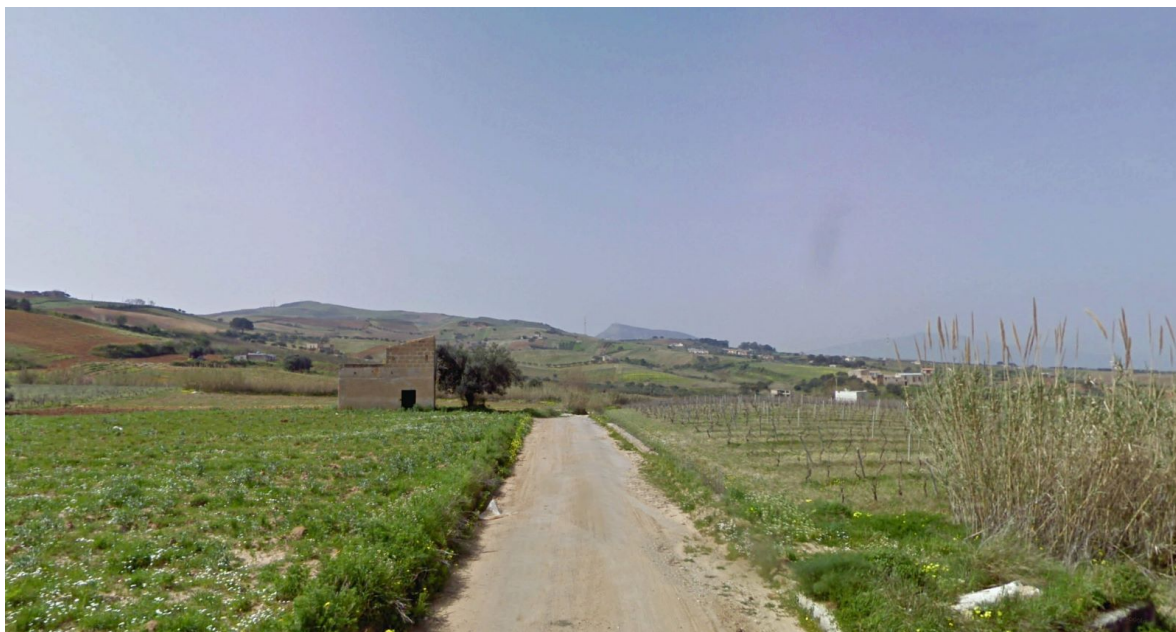
Vista 2- Stato ante-operam (strada comunale)