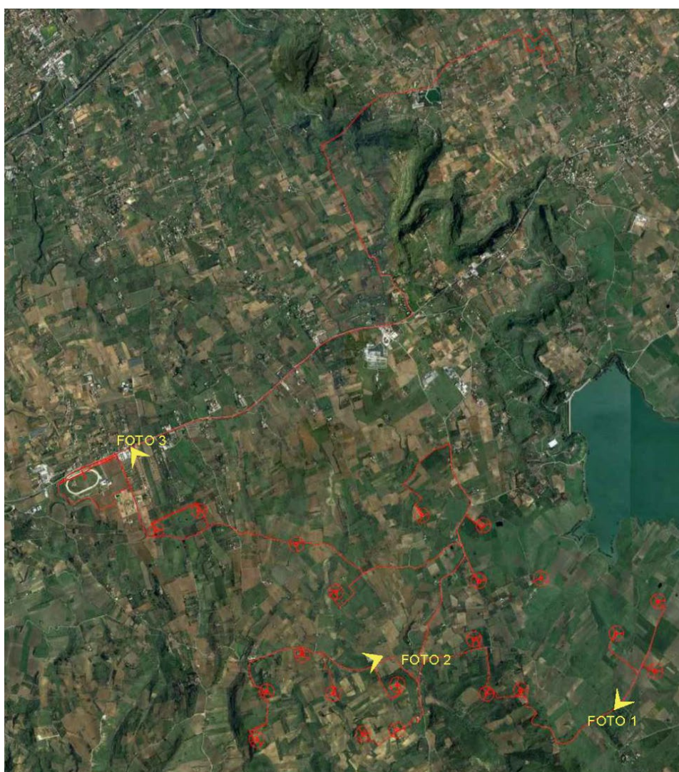
Inquadramento generale del parco eolico S&P16 su ortofoto

Per avere una comprensione quanto più oggettiva dell'impatto visivo del parco eolico in progetto sono stati realizzati una serie di foto-inserimenti evidenziano le differenze tra lo stato ante-operam e post-operam. Dell'analisi del contesto paesaggistico di riferimento sono stati individuati una serie di punti di vista ritenuti maggiormente significativi per poter rappresentare al meglio l'evoluzione dell'area e l'impatto visivo ed estetico; è stato riportato un inquadramento territoriale e una foto della situazione ante-operam (in alto) e una post-operam (in basso); i coni ottici delle viste ante e post operam sono stati posizionati lungo le principali arterie di collegamento viario che interessano l'area in esame.