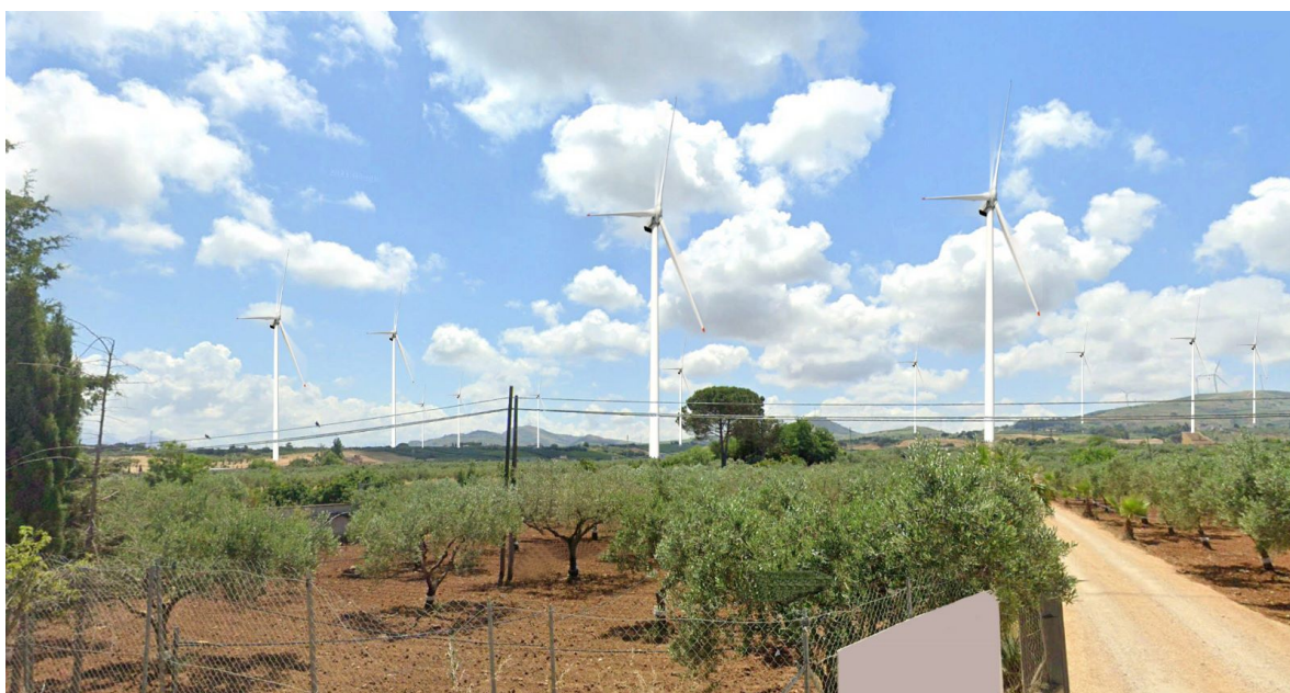
Vista 3 - Stato post – operam (SS113)