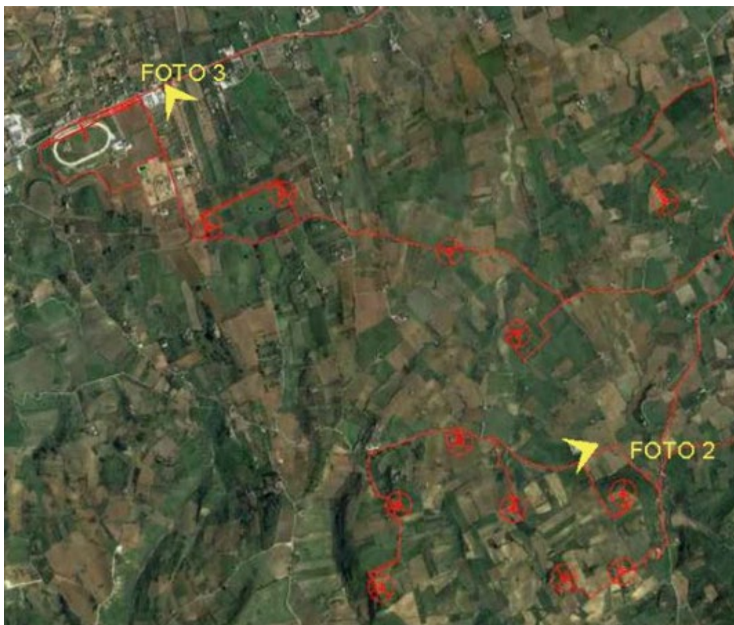
Inquadramento dell'area del parco eolico C/da Bosco su ortofoto