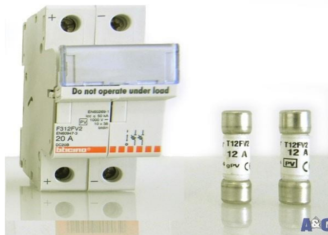
Figura 3: fusibili per la protezione delle stringhe fotovoltaiche