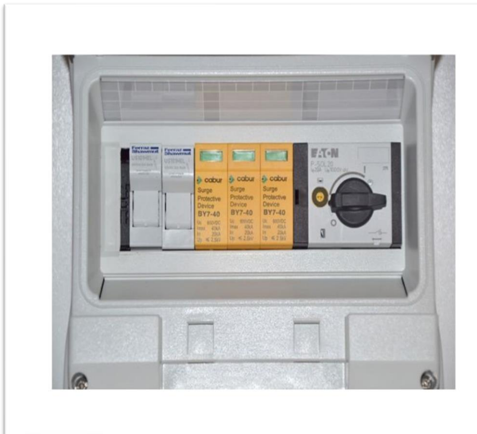
Figura 2: tipico quadro di parallelo stringhe

La struttura dei QPS sarà in resina autoestinguente con portina frontale trasparente montata su cerniere e munita di battuta in neoprene. Ciascun quadro sarà provvisto di staffe di ancoraggio e di ingressi e uscite cavi muniti di pressacavo.