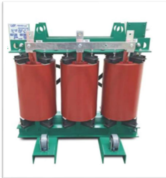
Figura 8: trasformatore di potenza isolato in resina

Come deducibile dallo schema elettrico unifilare, è previsto l'utilizzo di trasformatori di potenza isolati in resina da 3150 kVA.