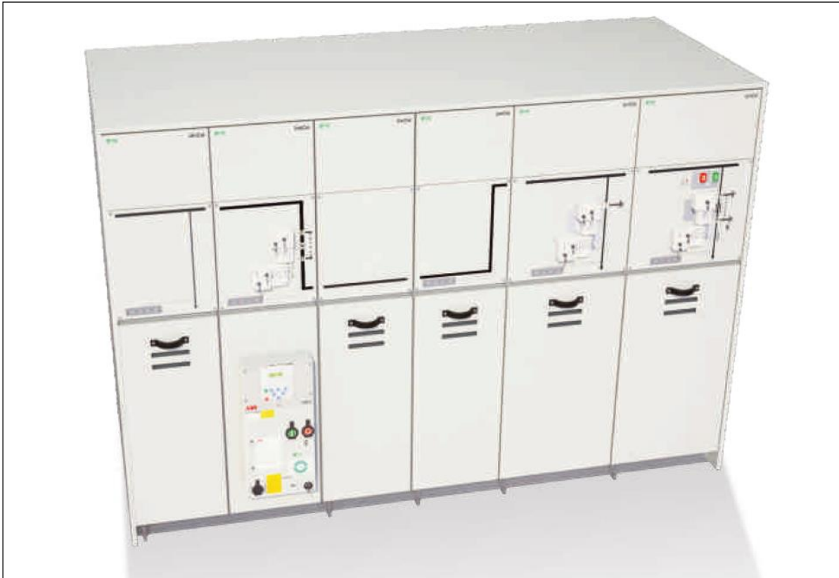
Figura 13: esempio tipico di quadro elettrico di MT

Il quadro elettrico generale di media tensione verrà installato all'interno della cabina di raccolta, posizionata in prossimità dell'area di accesso al sito, e sarà costituito da scomparti predisposti per essere accoppiati tra loro in modo tale da formare un'unica apparecchiatura: