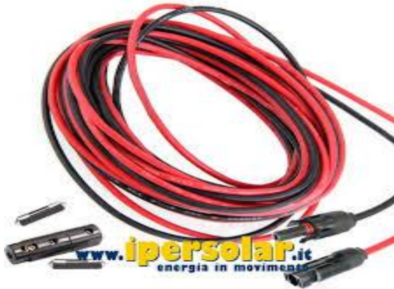
Figura 6: esempi di cavi solari per posa in aria