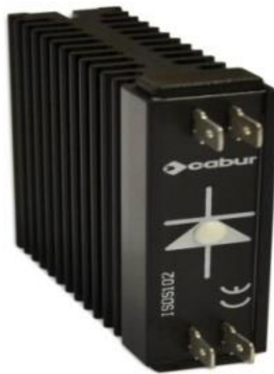
Figura 4: diodi di blocco