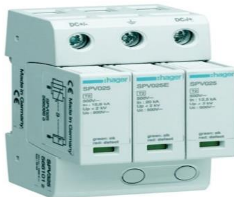
Figura 5: scaricatori di sovratensione per applicazioni fotovoltaiche

Si fa presente che la scelta dei componenti sopra menzionati, verrà fatta in fase di progettazione esecutiva, a valle dell'ottenimento delle Autorizzazioni necessarie alla costruzione dell'impianto.