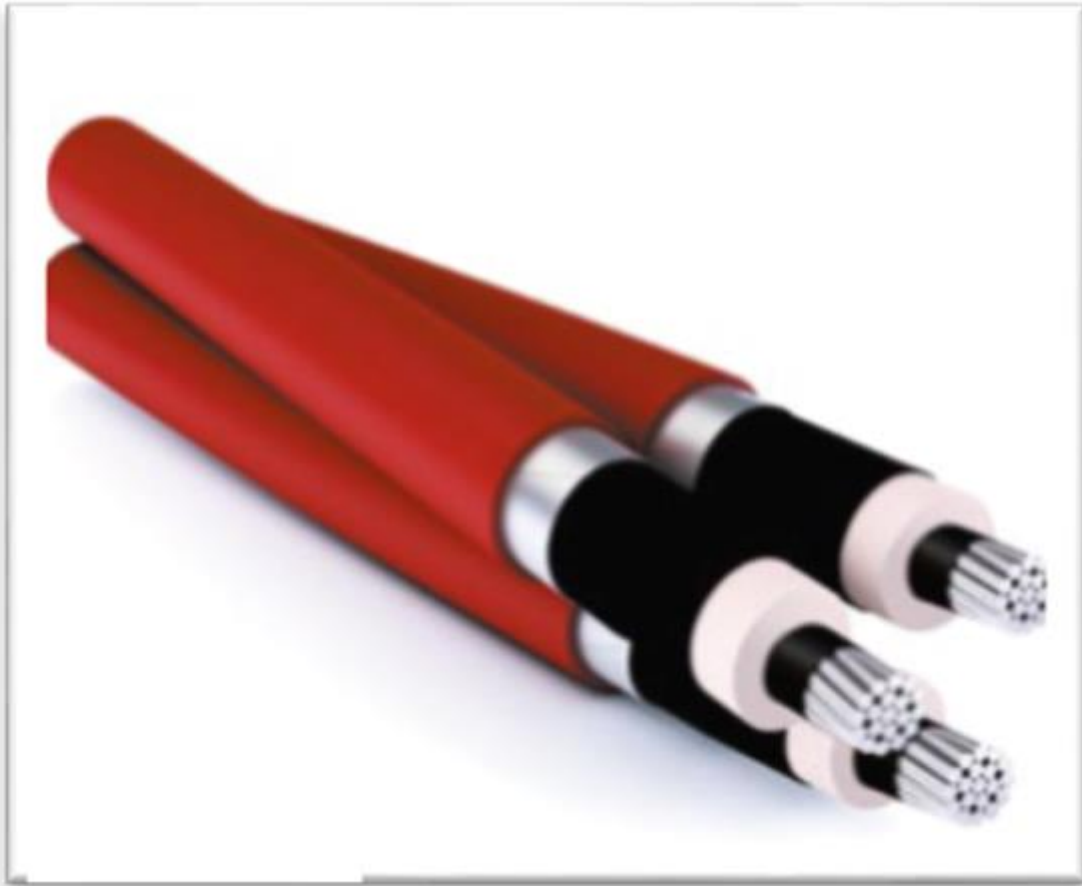
Figura 10: cavi MT tripolari ad elica visibile

In questa fase della progettazione, si è scelto di utilizzare cavi tripolari ad elica visibile per posa interrata ARE4H5EX 18/30kV.