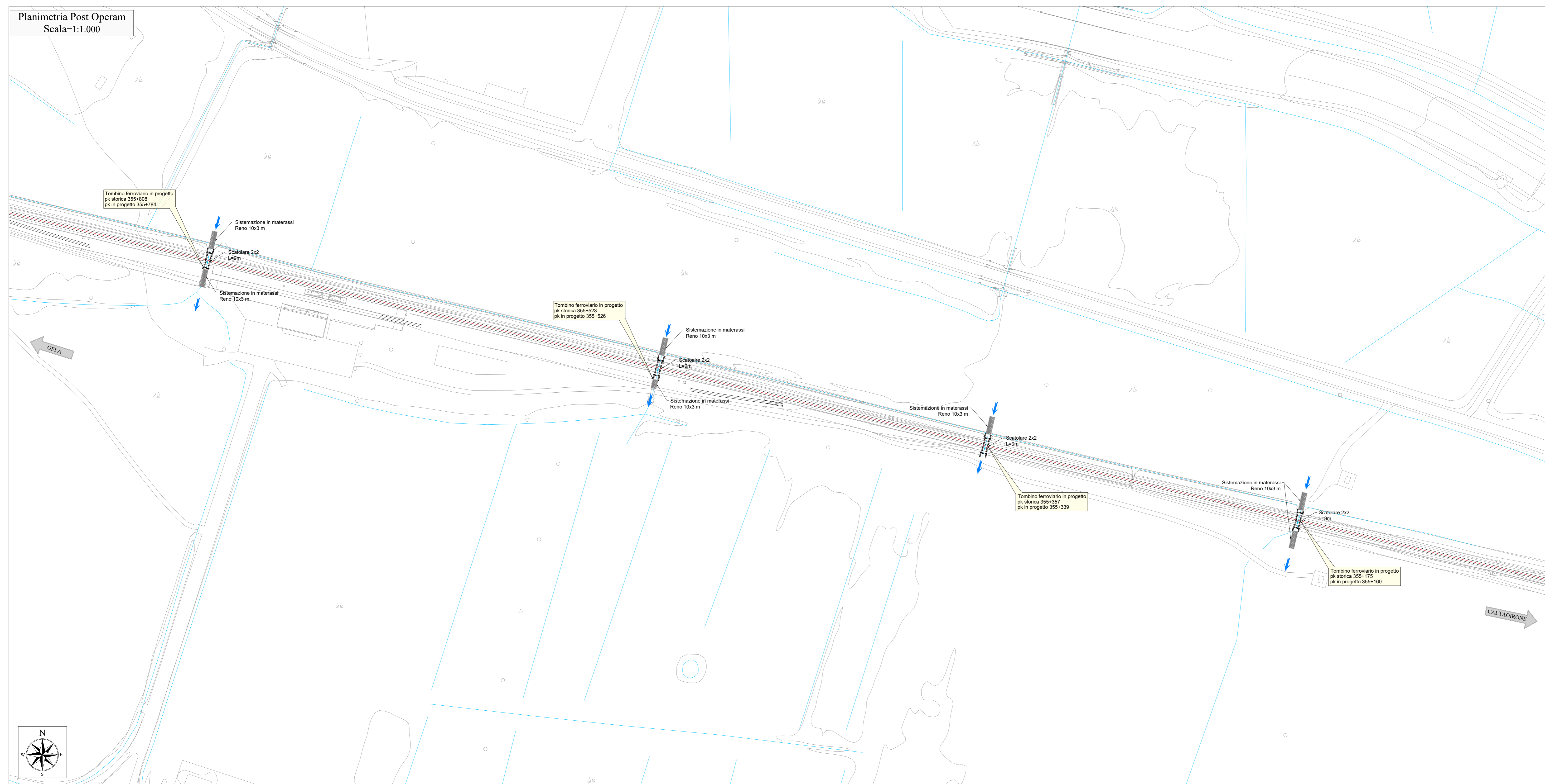
Planimetria Post Operam Scala=1:1.000