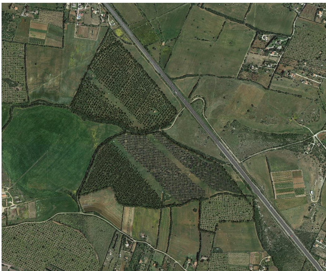
Fig 3: Planimetria ripristino ambientale post-operam.

Le azioni necessarie per l'attuazione di tali obiettivi sono: