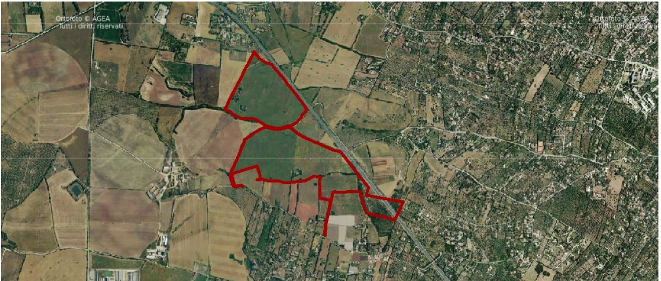
Fig. 1: Sito di installazione dell'impianto su ortofoto.