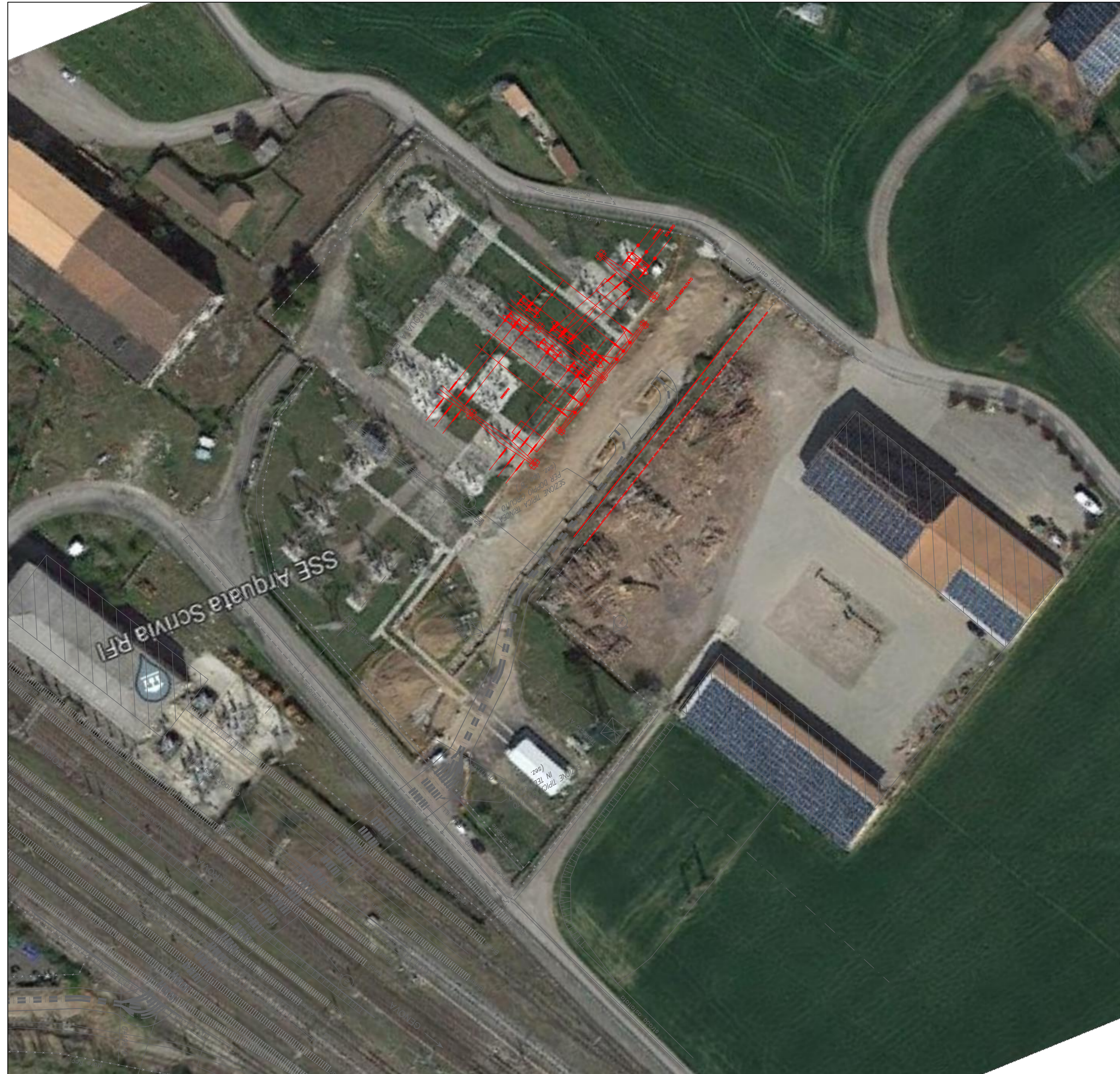
PLANIMETRIA SCALA 1:500