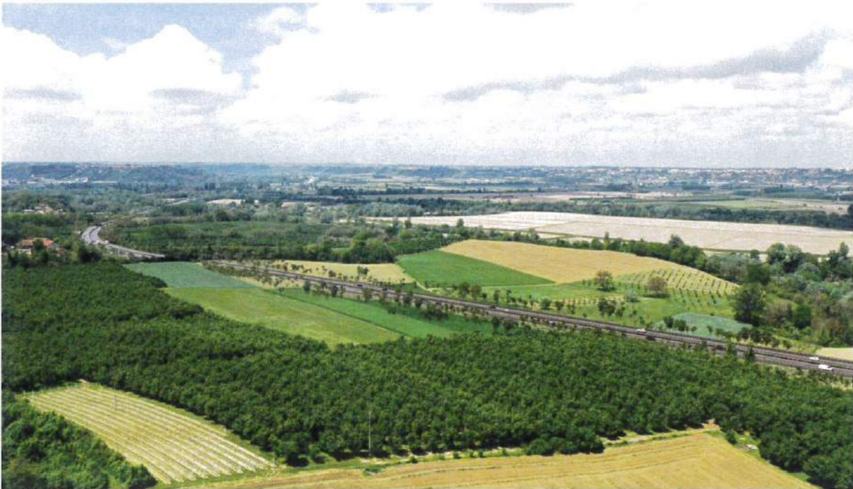
Punto di vista A.3 - Post mitigazione