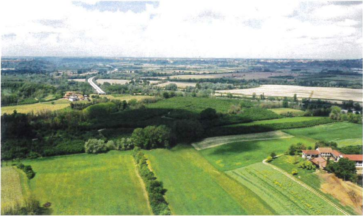
Punto di vista A.4 - Ante Operam