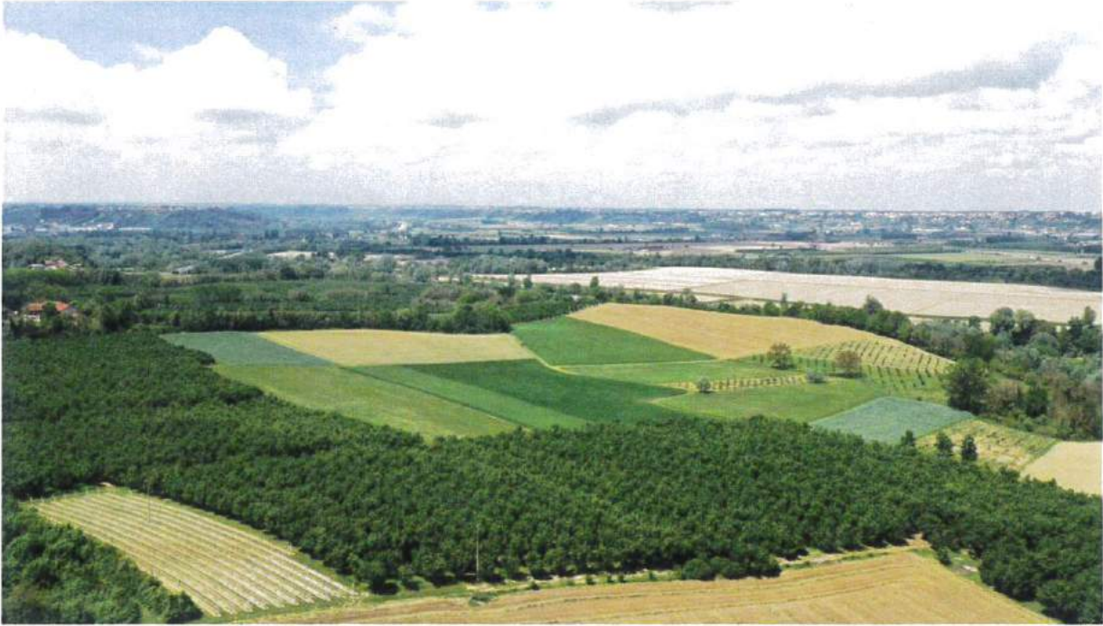
Punto di vista A.3 - Ante Operam