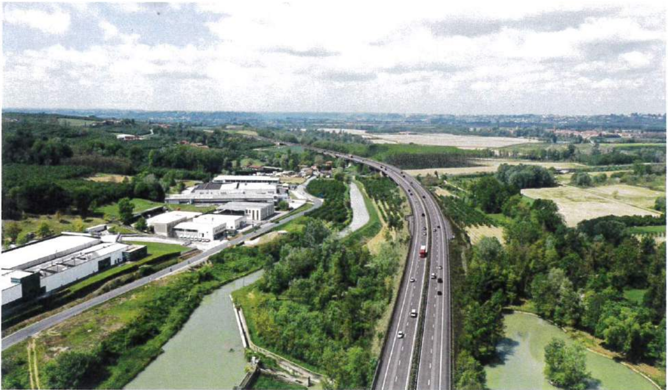
Punto di vista A.1 - Post mitigazione