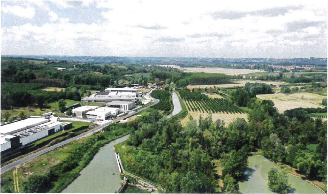
Punto di vista A.1 - Ante Operam