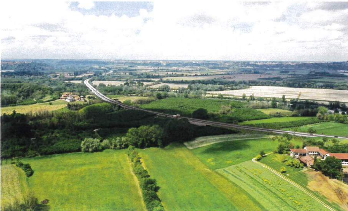
Punto di vista A.4 - Post mitigazione