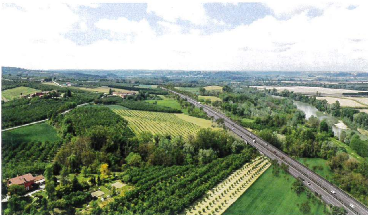
Punto di vista A.2 - Post mitigazione