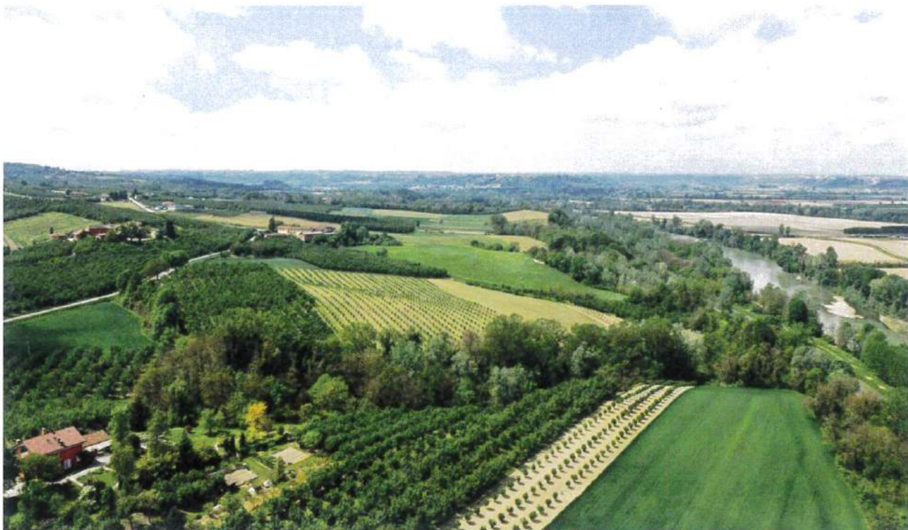
Punto di vista A.2 - Ante Operam