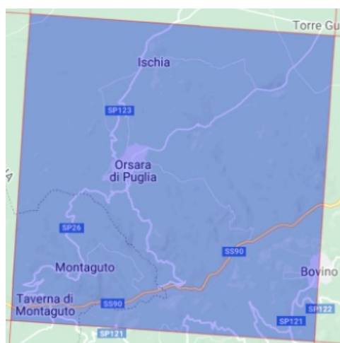
10kmE476N203 cella reporting direttiva dati 4° report (2013-2018)

Dalla consultazione dei link http://reportingdirettivahabitat.isprambiente.it/habitat-cellcodes-search e http://reportingdirettivahabitat.isprambiente.it/species-cellcodes-search che riportano i dati aggiornati all'ultimo rapporto ex Articolo 17 della Direttiva Habitat 92/43/CEE (in grado di rendicontare lo stato di conservazione e i trend delle specie e degli habitat italiani di interesse comunitario), lo scrivente ha verificato la presenza di habitat e di specie faunistiche nell'area di intervento ricadente nelle celle 10kmE476N203 e 10kmE477N203 così come mostrato nella seguente figura: