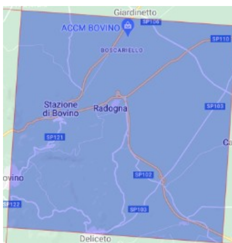
10kmE477N203 cella reporting direttiva dati 4° report (2013-2018)

Nelle seguenti tabelle si riporta l'elenco degli habitat e delle specie faunistiche potenzialmente presenti all'interno delle celle 10km E476N203 e 10km E477N203 così come previsti negli strati informativi del suddetto Reporting Direttiva Habitat.