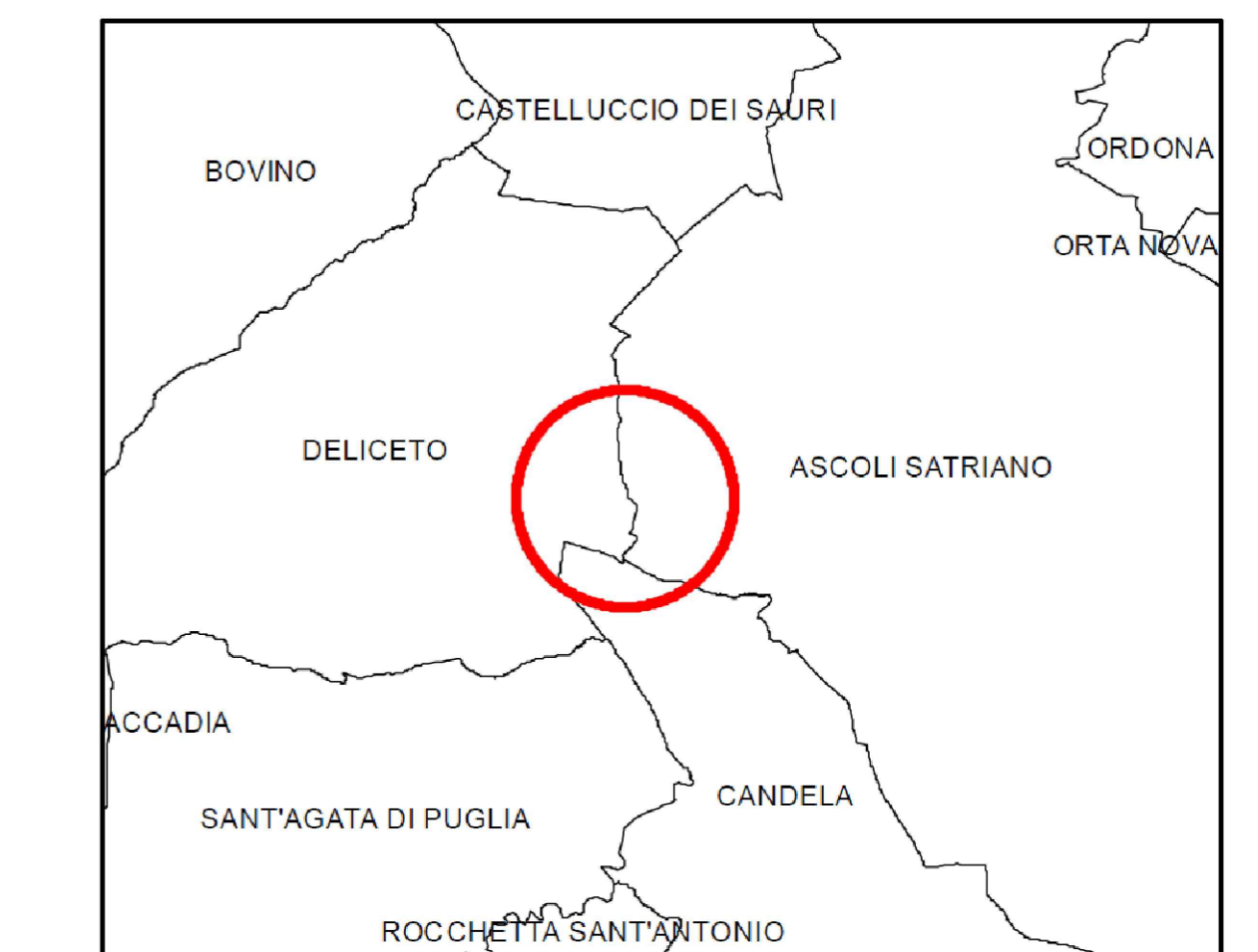
Tavola attraversamenti Rete di Connessione MT SCALA 1: 25.000