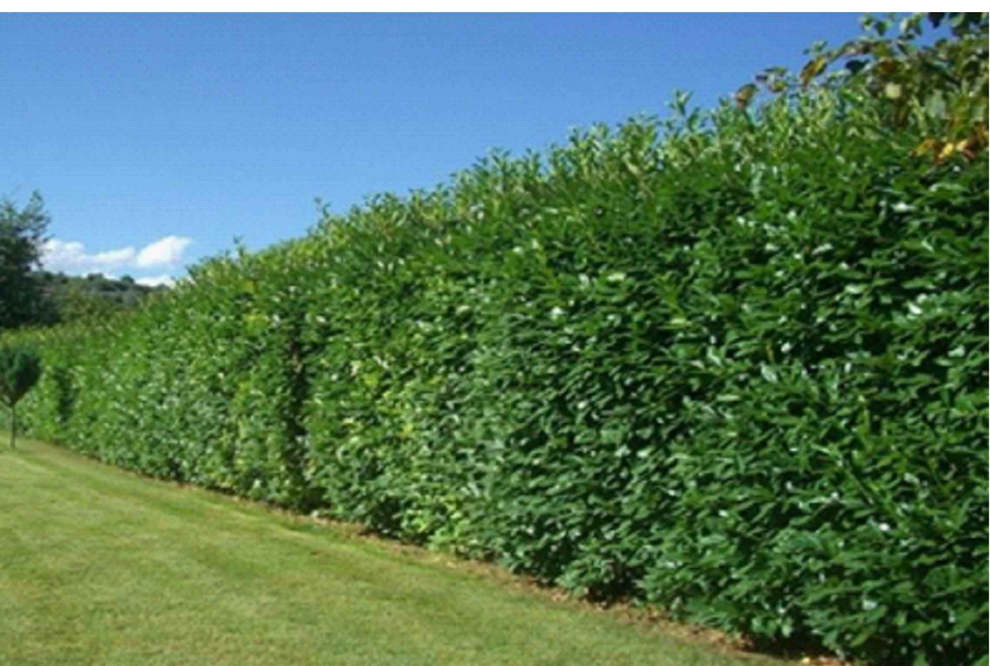
Alloro ( Laurus nobilis L., 1753) spec. tecnica rif. doc. "PD_REL02"