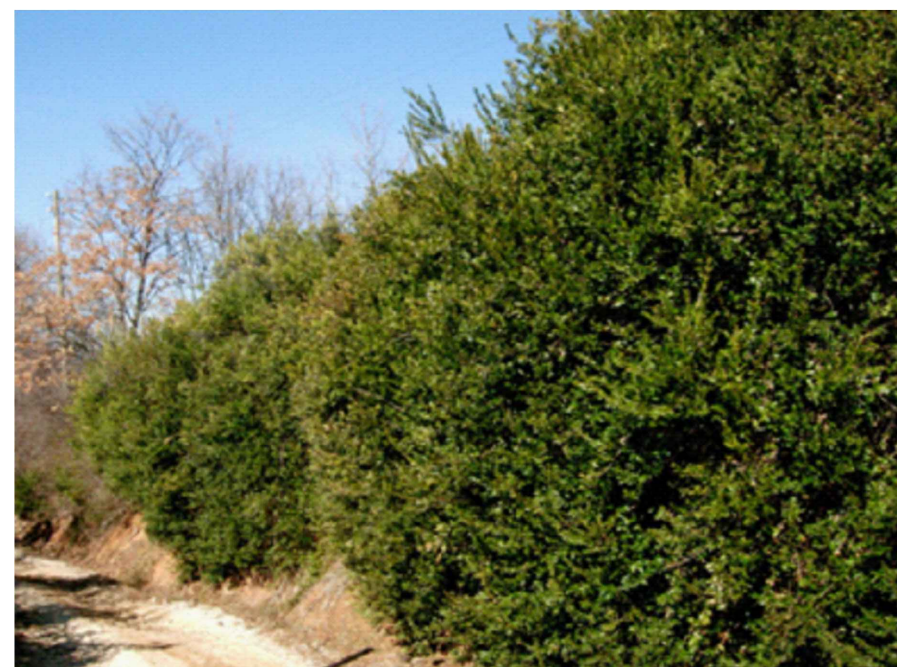
Mirto ( Myrtus communis L., 1753) spec. tecnica rif. doc. "PD_REL02"