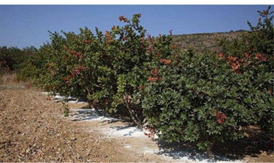
Lentisco ( Pistacia lentiscus L., 1753) spec. tecnica rif. doc. "PD_REL02"